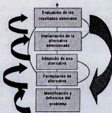
FIGURA 1. EL CICLO DE LAS POLÍTICAS PÚBLICAS

FUENTE: Manuel Tamayo Sáez. "El análisis de las políticas públicas". Editorial Alianza Universidad Texto, Madrid, 1997.