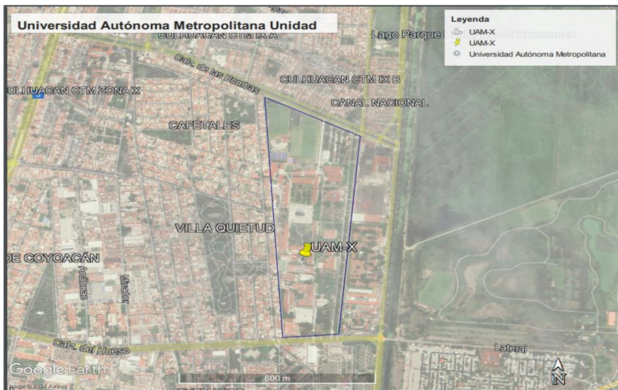
Figura 1. Ubicación de la Universidad Autónoma Metropolitana- Unidad Xochimilco

Las actividades del servicio social se realizaron en el laboratorio de Análisis Químico de Alimento Vivo, en la Universidad Autónoma Metropolitana Unidad Xochimilco localizada en Calzada del Hueso 1100, Col. Villa Quietud, Delegación Coyoacán, C.P. 04960, D.F. México.