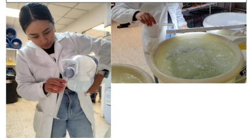
Figura 3. Esquema del proceso de mantenimiento de agua

Transcurrido el tiempo, se agrega tiosulfato de sodio a una concentración de 1 mL/L con el objetivo de eliminar el cloro residual, se mantiene la aireación del agua durante otras 24 horas.