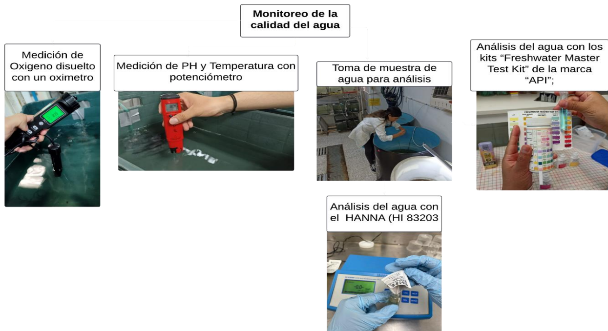
Figura 2. Esquema de monitoreo de agua.

En los casos en que los parámetros no se encontraban dentro de los rangos óptimos establecidos, se realizaron recambios de agua hasta alcanzar las condiciones adecuadas para garantizar un ambiente óptimo para el desarrollo de los cultivos, este monitoreo constante permite mantener la estabilidad y calidad del agua en todo momento.