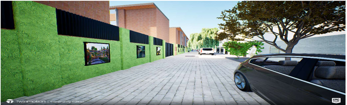
Fig. 5 Diseño y modelado de mejoramiento barrial mejoramiento en los muros, el asfalto y una colocación de marco para imágenes urbanas.