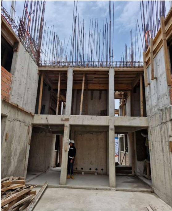
Fig. 7 fotografía de uno de los edificios de la obra leyes de reforma