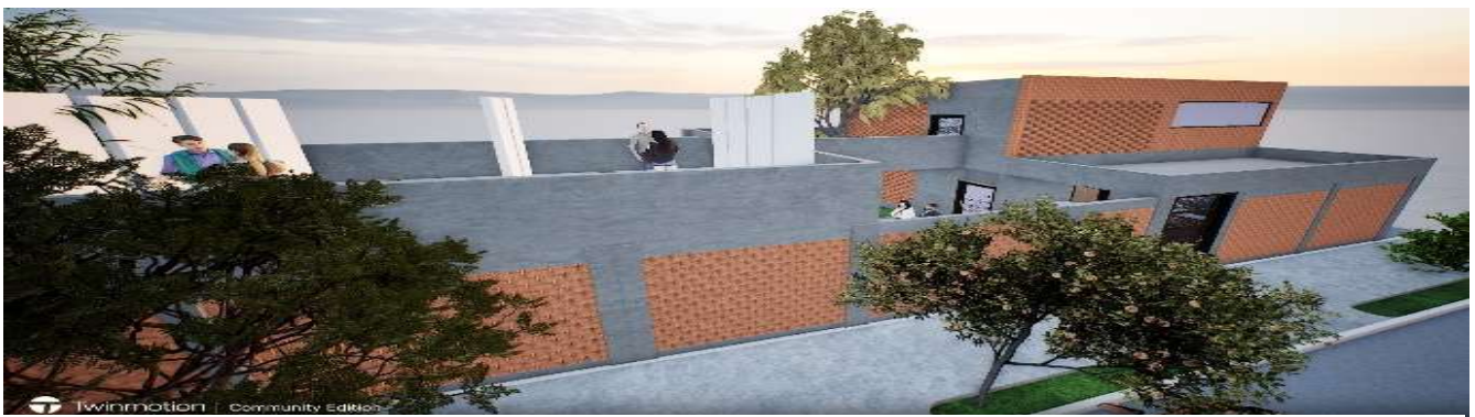
Fig. 6 Propuesta una cafetería y museo para reliquias arqueológicas encontradas en obra, incentivando y preservando la cultura de la región.