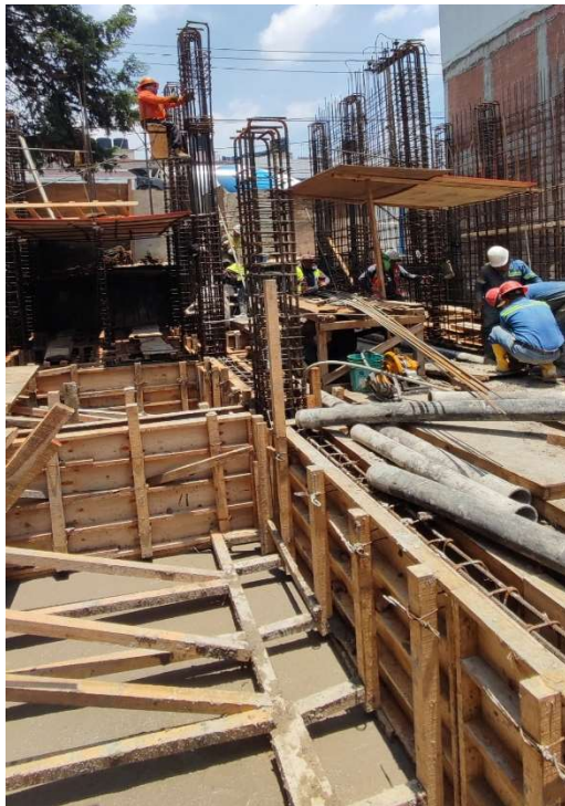
Fig. 9 Fotografía de colado y armado en la obra de Álvaro obregón