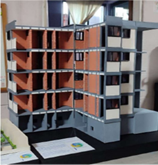
Fig. 1 Maqueta de edificio tipo de 4 departamentos con cajón de cimentación para la presentación de NODOX de la UAM-X para atraer más interesados en el proyectos de servicio social.