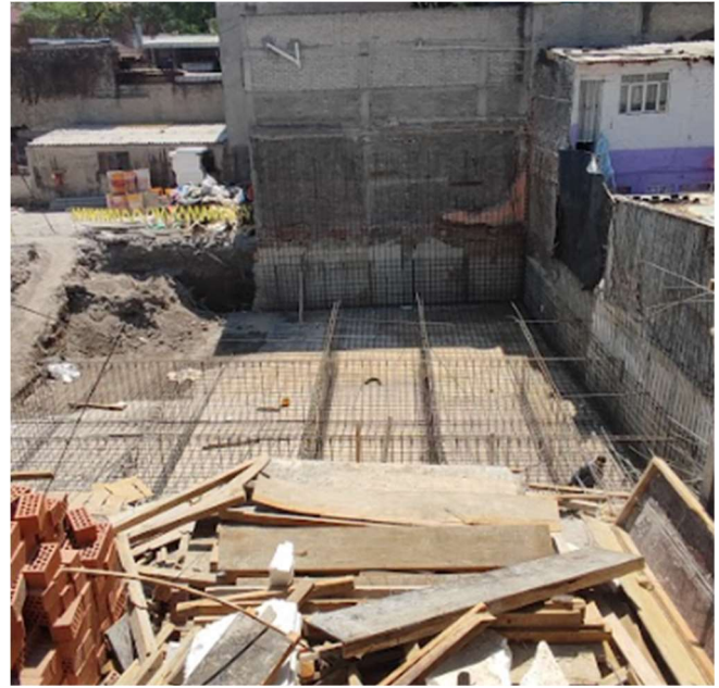
Fig. 8 fotografía de la obra la cruz, armado de contra traves para cajón de cimentación