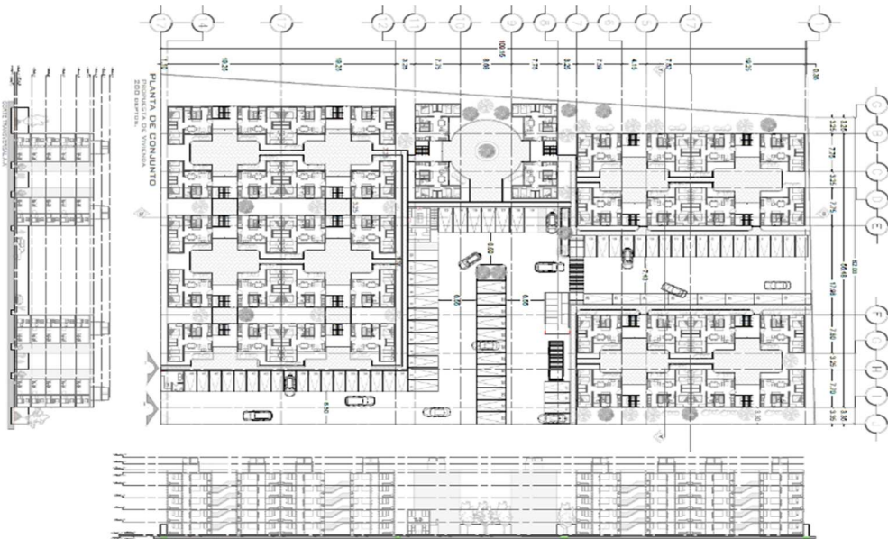
Fig. 3 Diseño de conjunto habitacional, para 200 acciones de vivienda, en el predio ubicado en San Rafael Atlixco s/n, entre Calle Augusto Manuel y Calle Manuel M. López, Colonia Zapotitlán, Alcaldía Tláhuac. Con un diseño d edificio tipo con 5 niveles permitidos por torre.