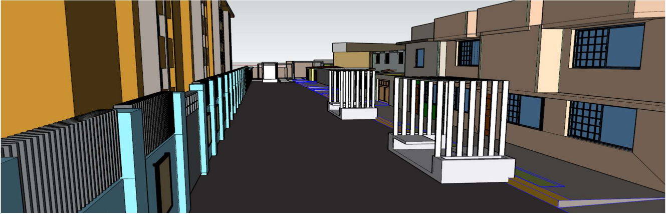
Fig. 4 Diseño y modelado de mejoramiento barrial en el cual se propuso para dar una mejor de la calidad de vida de las personas de esa calle, el cual consistía en colocar espacios definidos para estacionarse, áreas de descanso con techumbre y una plazoleta para apoyar a los locales de la zona.