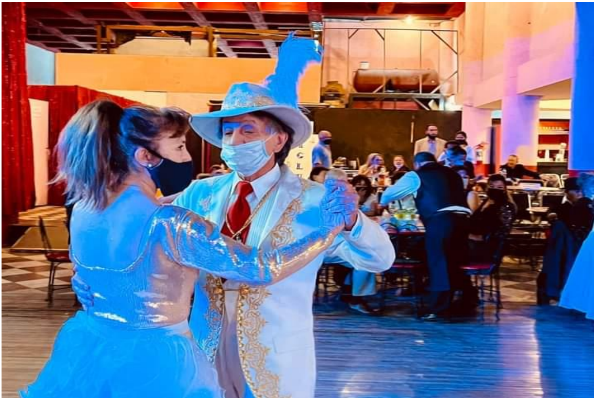
Ilustración 24 bailes de pachucos en el Salón Los Ángeles.

El pachuquismo en la actualidad se ha mantenido vigente tanto los Estados Unidos como en México con el esfuerzo de aquellos pachucos de antaño que continúa expandiendo esta cultura a la sociedad; pero este esfuerzo también ha sido por parte de algunos aficionados amantes del pachuquismo, que a través de diversas plataformas de internet se han encargado de difundir noticias, confirmación de eventos y memoriales conmemorativos. Haciendo de ello que algunas plataformas de internet se conviertan en el principal difusor de la cultura del pachuco , evocando y convocando a los diferentes eventos a personas que se encuentran tanto en el pachuquismo como aquellas que son ajenas a este.