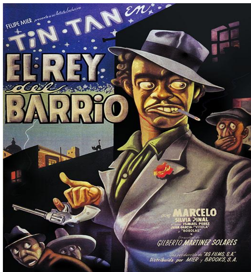
Ilustración 22 German Valdez Tin Tan en " El rey del barrio ", 1949.

la imagen del personaje de pachuco a la de " El peladito " 35 , como también lo interpretara Cantinflas . "Con el filme titulado " El rey del barrio " (1949), marca el inicio de esa despachuquisacion ; bajo el disfraz de maquinista , Tin Tan se desempeña como líder de una banda de ladrones que nunca ha logrado cometer un robo importante. Tin Tan hace creer a los miembros de su banda que él había dirigido una banda de ladrones en Chicago. Con las ganancias que los miembros de su banda logran obtener de robos menores, Tin Tan ayuda económicamente a sus vecinos del barrio en el que vive. A pesar de que conserva el zoot-suit , el pachuco en esta película se transforma en una especie de " Robín Hood " que borra el elemento contestatario del pachuco original". (Ojeda, Tania. 2011. Pp. 19)