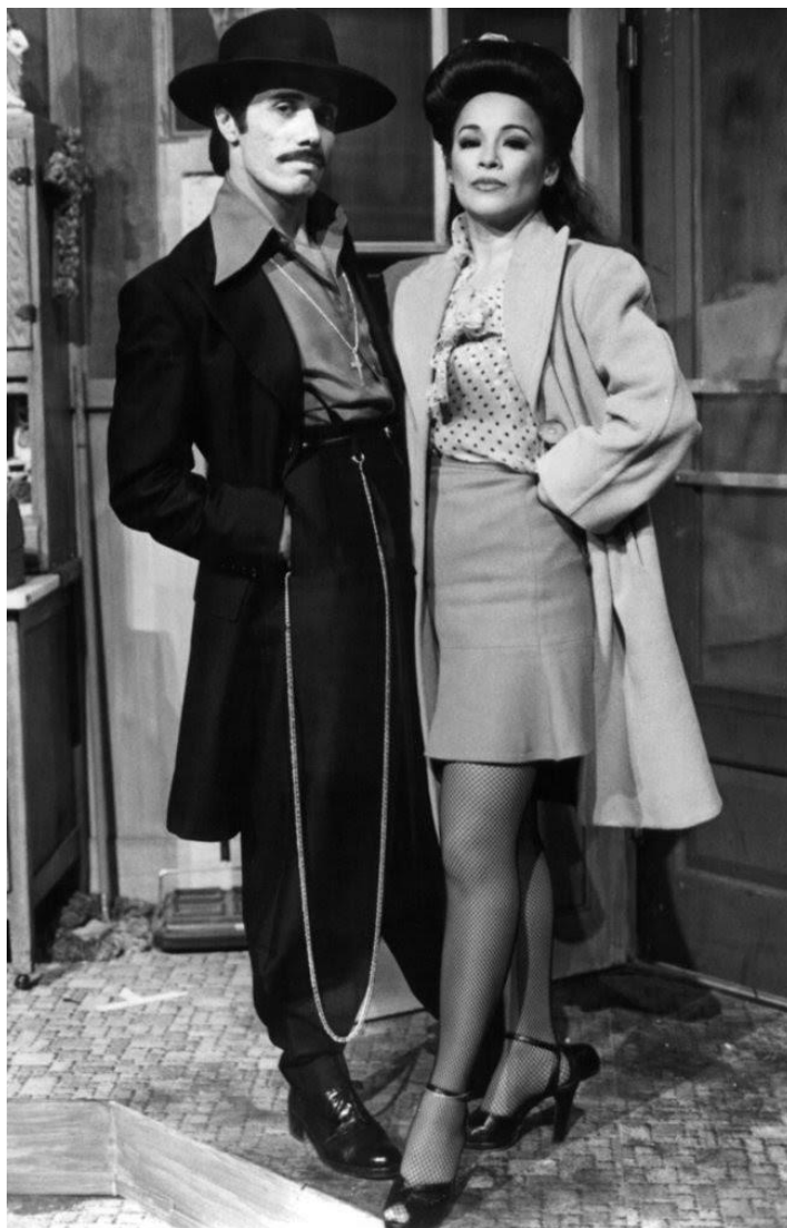
Ilustración 5 Edward James Olmos y Alma Martínez en la película Zoot Suit , 1981.

Con ello el fenómeno de los pachucos pronto adoptaría características propias que sobresaldrían e identificarían como únicos, la primera de estas características sería la vestimenta que portaban estos jóvenes pachucos que como se muestra en la imagen dota de una idea de cómo era la vestimenta en la época. El atuendo que portaban estos jóvenes constaba de extravagantes atuendos denominados Zoot Suit 22 , que consistía en un pantalón de cintura alta o tiro alto ajustados o estrechos