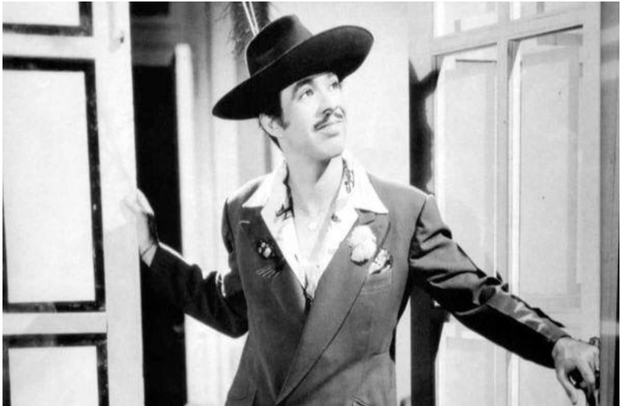
Ilustración 23 Indisciplinado, revoltoso, parrandero, desorganizado, mujeriego, impuntual, dicharachero, pero inteligentísimo, alegre, simpático, bondadoso, generoso y muy trabajador y profesional, así era Tin Tan.

“Sin embargo, el personaje estereotipado del chicano-pocho, con su lenguaje mezclado de inglés y español, con su largo saco, sus pantalones bombachos, su ancha corbata, la camisa llamativa, su sombrero con pluma y su larga leontina nunca fueron olvidados. Y Germán Valdez Tin Tan siempre será parte del imaginario colectivo como El Pachuco de Oro”. (Milagros, Ana. 1958. Pp. 20)