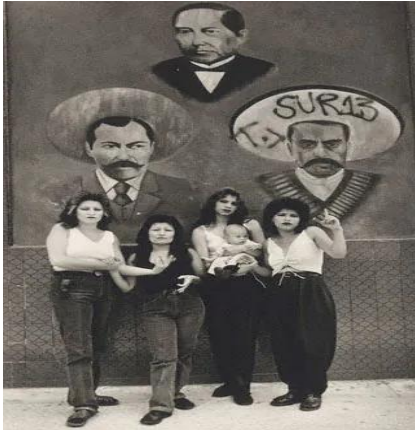
Ilustración 11 Cholas que conformaban la sección femenina de las pandillas callejeras de Los Ángeles, California; con el tiempo se conformaron pandillas conformadas únicamente por mujeres, 1970.

Entre otras de las características de los cholos se encuentra el código de vestimenta, en el que este elemento a simple vista sería causa en la gran mayoría de ocasiones motivo exclusión, estigmatización y constantes hostigamientos por las autoridades. Lara, Luis Fernando. (1992) menciona "La vestimenta del cholo se encuentra fuertemente relacionada con dos aspectos fundamentales al interior del movimiento, el primero de ellos se encuentra vinculado a partir del movimiento pachuco de la década de los años cuarenta en el que algunos elementos de esta vestimenta fueron adoptados y adaptados por el cholismo; el segundo aspecto se encuentra relacionado con el aspecto laboral, ya que los cholos hicieron posible que a través de la portación de sus uniformes de trabajo fuera de los espacios laborales se convirtiera esta vestimenta una forma normal de atuendo en las calles escandalizo de nueva cuenta a la sociedad norteamericana" . Entre el atuendo