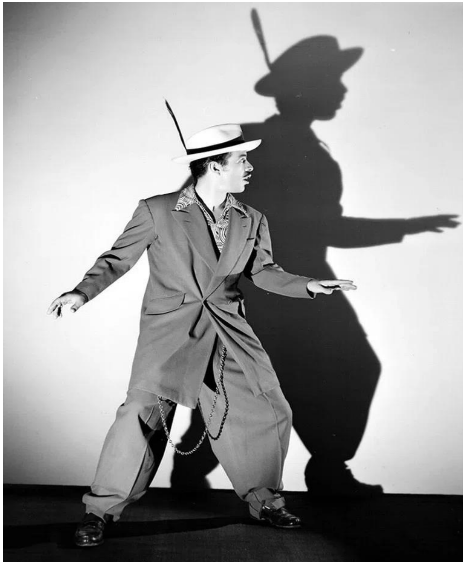
Ilustración 20 Germán Valdés " Tin Tan ", el Pachucote. Fotografía: Infobae.com

Meneses junto a Juan B. Leonardo iniciaron una temporada de teatro musical en la que incluyeron a Germán promocionándolo con el seudónimo de “ Topillo Tapas ”. Es precisamente en la frontera donde Germán radico desde los doce años que tenía el conocimiento absoluto de su auditorio, el cual a través de su rutina cómica reflejaba de manera artística el vivir de la frontera; por lo que el disfraz de pachuco y la manera de cambiar los códigos fueron las bases en las cuales se forjaría aquel naciente joven Tin Tan .