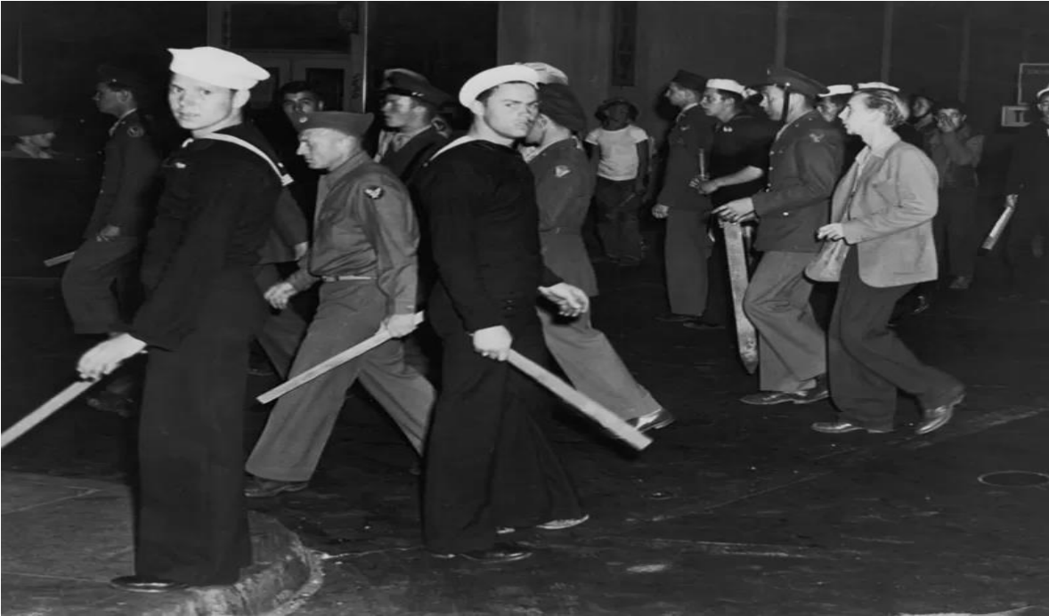
Ilustración 10 Grupos de marinos y policías tomaron como misión la persecución de pachucos posteriormente de los disturbios angelinos, 1943.

manifestación contra la desigualdad que vivía esta generación convirtiéndose más que en una contracultura, en una forma de vida única en la que los jóvenes pachucos mostraban la inconformidad por medio de una moda desenfadada y rebelde.