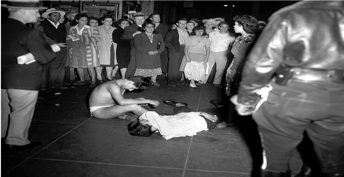
Ilustración 9 Jóvenes golpeados por policías y militares en los disturbios Zoot, en Los Ángeles, California.

Dichos acontecimientos marcaron negativamente la figura del pachuco pasando de una forma de pronunciamiento por los jóvenes en los Estados Unidos para acabar con la desigualdad de la cual eran objeto a una que según los medios de comunicación y los grupos policiales denominaron como grupos de jóvenes violentos; representando para esta generación numerosos motines en contra de los pachucos que solo era una de las tantas formas en las que la sociedad norteamericana demostraba el rechazo a personas binacionales que ocupaban parte de su territorio haciéndolos ver de forma despectiva únicamente por su apariencia física y su estatus social.