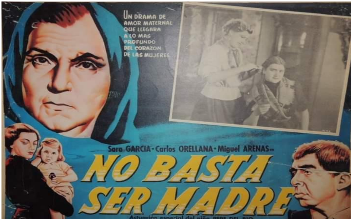
Ilustración 18 Sara García en "No basta con ser madre", 1937.