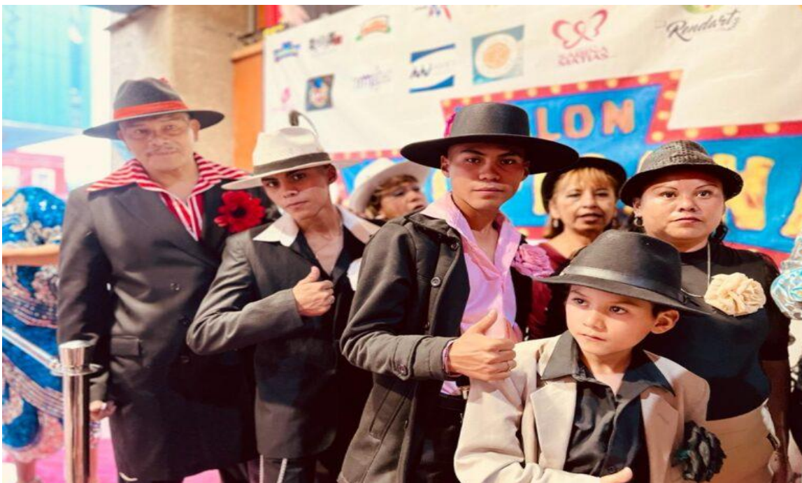
Ilustración 27 Familia de pachucos.

círculos familiares, es decir, el portar el atuendo característico de los pachucos es una forma de continuar con un legado iniciado por padres y abuelos. En este sentido, se puede decir que el pachuco es constructor de una cultura que va arraigándose de generación en generación, ya que como se veía en el apartado teórico de este texto los teóricos utilizados abordan el concepto de cultura desde una perspectiva la cual hace referencia a aquellos elementos que se comparten y a la vez son transmitidos por los miembros de una generación adulta a una generación joven; por lo que Linton, R. (1983) menciona que “ La transmisión juega un papel importante para la preservación de una cultura, ya que es la única forma en la cual las pautas de conducta se llegan a hacer colectivas ”, siendo de esta manera que el concepto de cultura abordado desde el ámbito teórico parte del precepto en el que un grupo social sería la base para que se pueda generar la cultura estableciendo una relación entre esta y la sociedad en el que por medio de esta relación es transmitida la cultura a través de habilidades, costumbres y formas de vida que únicamente pueden ser creadas por los mismos integrantes de un grupo social ya sea por necesidad biológica o social con el paso de las generaciones siendo cada individuo emisor y receptor de cualidades a lo largo de su vida en sociedad.