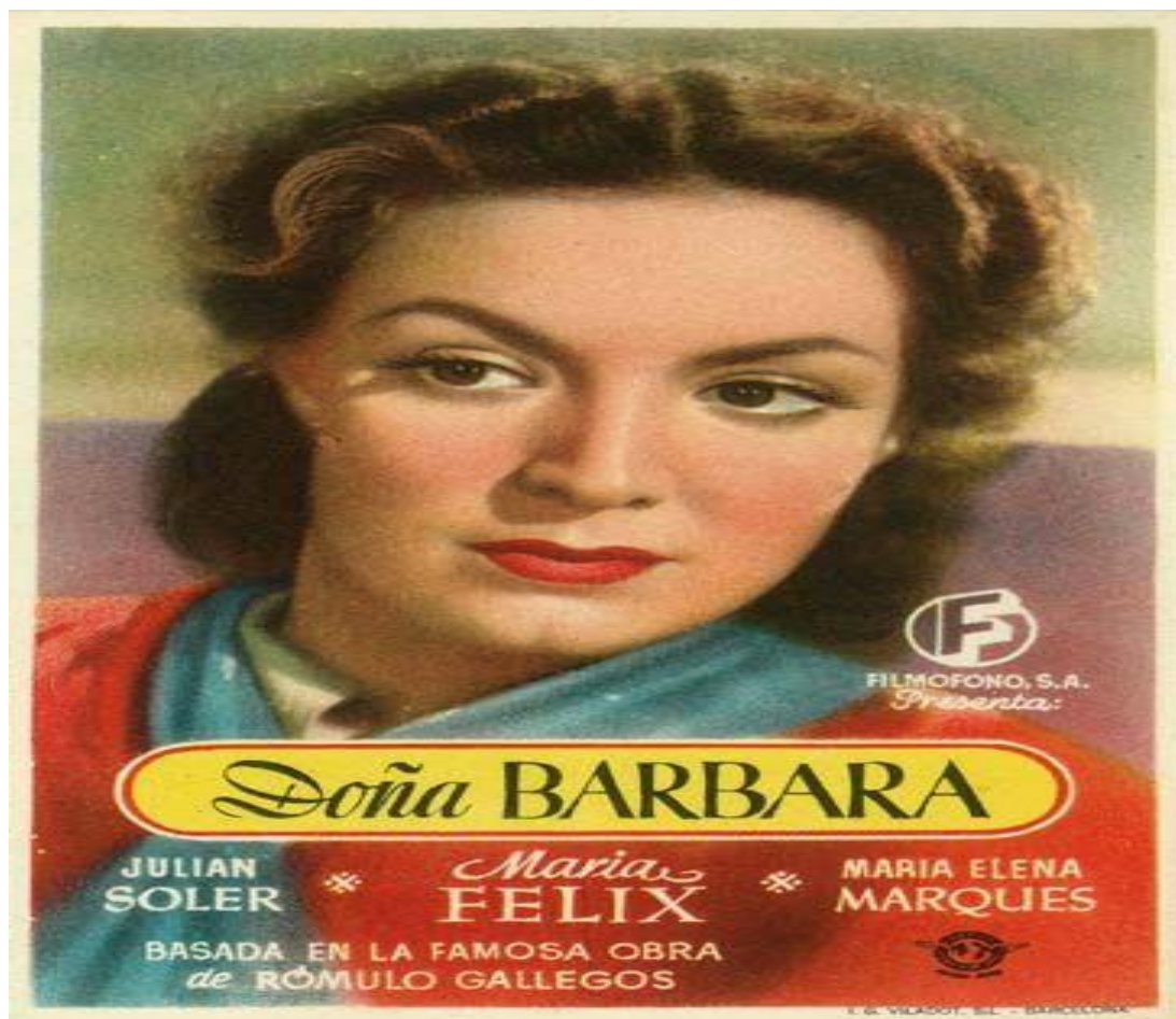
Ilustración 16 María Félix en Doña Bárbara, 1943.

Emilio “El indio” Fernández que gracias a su enorme visión logro colocar a un personaje que se convertiría en un emblema, claro estamos hablando de la actriz María Félix que bajo el personaje de la india bonita fue una mujer bravía ligada a ámbitos revolucionarios, fuerte y luchadora que nunca estuvo a la sobra de ningún macho; ella simplemente fue La generala , La Valentina , Doña Diabla , La devoradora y Doña Bárbara .