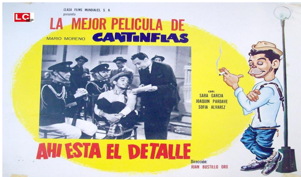
Ilustración 19 Mario Moreno "Cantinflas" en "Ahí está el detalle", 1940.

“Cantinflas eludía el diálogo para no comprometerse, negaba la comunicación por miedo a hablar, nunca se dejó atrapar porque solo decía incoherencias y frases sueltas que confundían al oyente. Esta manera de comunicarse se hizo tan popular que hasta logro promover un nuevo verbo para identificar el acto de hablar sin decir nada: Cantinflear”. (Milagros, Ana. 1958. Pp. 9)