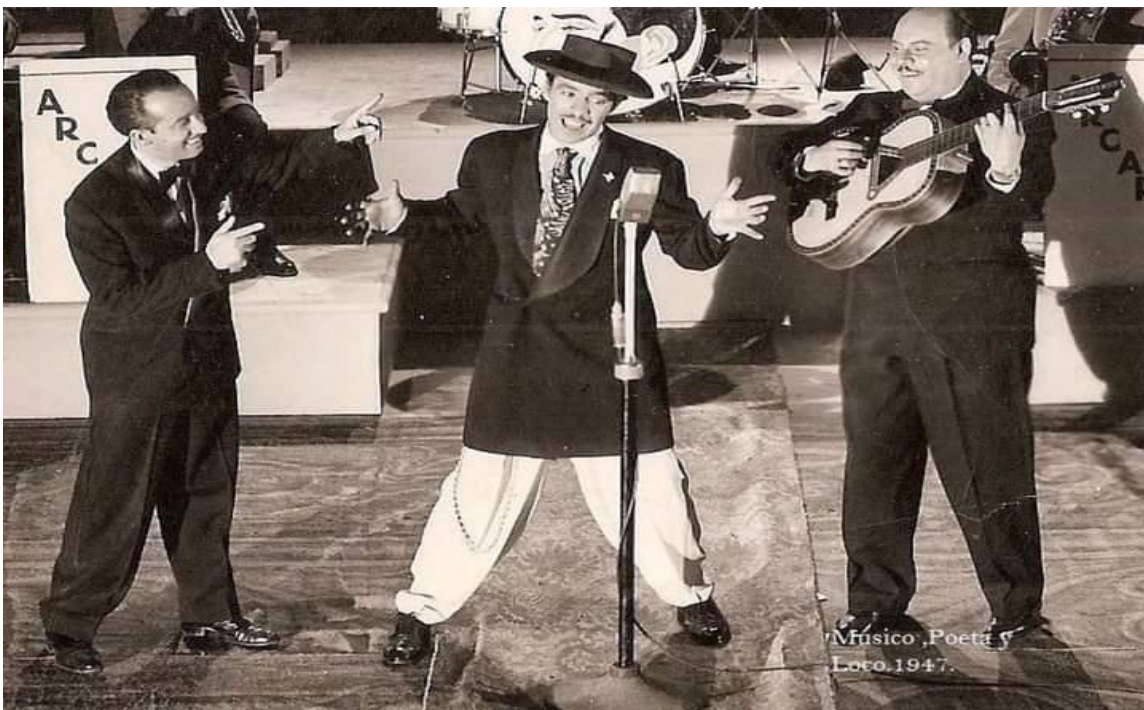
Ilustración 21 Tin Tan se inició en el cine y revoluciono al género con su nueva propuesta de la imagen cómica del Pachuco. Junto a él, su fiel compañero desde la época de las carpas y el teatro, estaba su “carnal” Marcelo. Fotografía: Músico, Poeta y Loco, 1947.

Más allá del vestuario, el lenguaje, entre otras características fundamentales adoptadas del pachuquismo sobrepasaron más que una simple imitación burlesca, convirtiéndose en toda una postura ética y estética; sin embargo, con este peculiar personaje Germán Valdez se arriesgaba a que su público se ofendiera y terminara por rechazarlo, pero logro lo que nadie esperaba, ya que el personaje logro colocarse en el gusto de las personas logrando éxito y aceptación. Con ello el camino al éxito de Germán comenzaba, pero aún era necesario un factor que detonaría su popularidad entre el pueblo mexicano; era necesario un cómplice que colaborara junto a Germán en las actuaciones en vivo; por lo que el 5 de noviembre de 1943 se presentaba por primera ocasión al cantante, actor y comediante “Tin Tan con su carnal Marcelo” . (Milagros, Ana. 1958.)