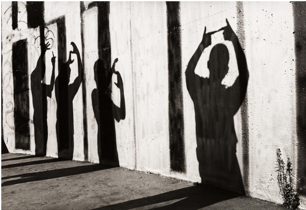
Ilustración 13 Pandilla de cholos "Harpys" en Los Ángeles California, 1990.

movimientos, adaptándolos y haciéndolos suyos como una forma de reclamo ante la marginación percibida, es decir, los jóvenes de las colonias populares en estas zonas del país no son empleados en un régimen formal orillándolos a emplearse en la informalidad, implicando una naciente clase obrera desposeída que lucha por sobrevivir en ambos países. Es precisamente en este momento donde el crisol de los cholos florece al igual que los pachucos que conforman la contracultura exhibiendo la marginalidad de algunos sectores de la población urbana, en el que la figura del cholo proviene de estratos sociales bajos donde las principales carencias son la baja escolaridad, falta de empleo y la ruptura familiar entre otras tantas situaciones; el cholismo adopta su ideal como una forma de resistencia ante la sociedad que los rezaga ya sea por la vestimenta o imagen que portan haciendo de ello que las diferencias existentes entre cada grupo sean por un bien común que consiste en hacer frente ante la marginación de la sociedad norteamericana; es así que cholos chicanos y mexicanos luchan por marcar una diferencia a la cultura oficial y como lo realizó el pachuco en su momento el cholo constituye un fenómeno cultural que traspasa las fronteras.