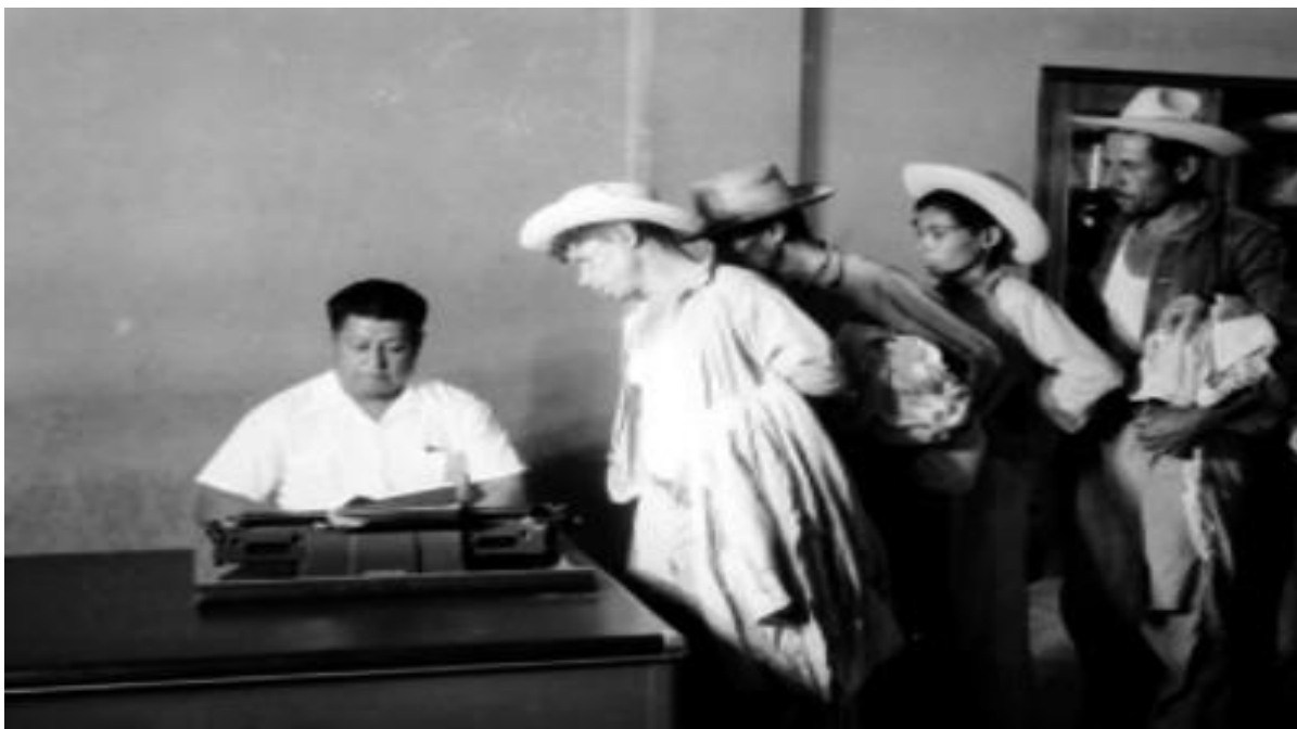
Ilustración 1 Grupo de braceros en una oficina de la aduana en Nuevo Laredo, Tamaulipas. (1953). Fotografía: Instituto Nacional de Antropología e Historia (INHA)

El programa Bracero estuvo envuelto en toda una serie de controversias en ambos países, las críticas en torno a dicho programa fortalecieron y aceleraron la culminación de este al término del conflicto bélico, ya que aquellos que se encontraban en contra de dicho programa hacían hincapié al maltrato que sufrían estas personas, las malas condiciones durante el reclutamiento y la idea de que los flujos migratorios se encontraran regulados solo por los mercados de trabajo.