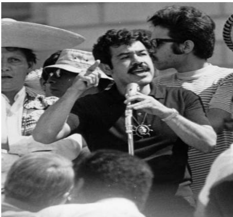
Ilustración 3 Rodolfo "Corky" González, fundador de la Organización Cruzada por la Justicia.

Es de esta manera tanto las luchas llevadas a cabo por el Movimiento Chicano y los diferentes activistas que apoyaron al movimiento desde distintas vertientes consiguieron darle voz a aquellos que eran menospreciados en los Estados Unidos por su condición de invasor, pero no solamente este movimiento estuvo sustentado a través de las acciones antes mencionadas; el ámbito literario sería parte sustancial del Movimiento chicano dotándole de un significado reflexivo a la identidad chicana. Algunos recursos literarios que vendrían a dotar de esta reflexión serían por medio de la publicación de la revista El Grito: A Journal of contemporary Mexican-American , de la editorial del "Quinto Sol" 16 por otra parte, se encontraba el activista y poeta mexicoamericano Rodolfo "Corky" González, que más allá de los importantes aportes realizados al Movimiento Chicano formaría parte del acervo literario chicano, explorando la identidad vista desde la perspectiva chicana definiéndola y dándole un mayor sustento histórico que le agregaría un toque