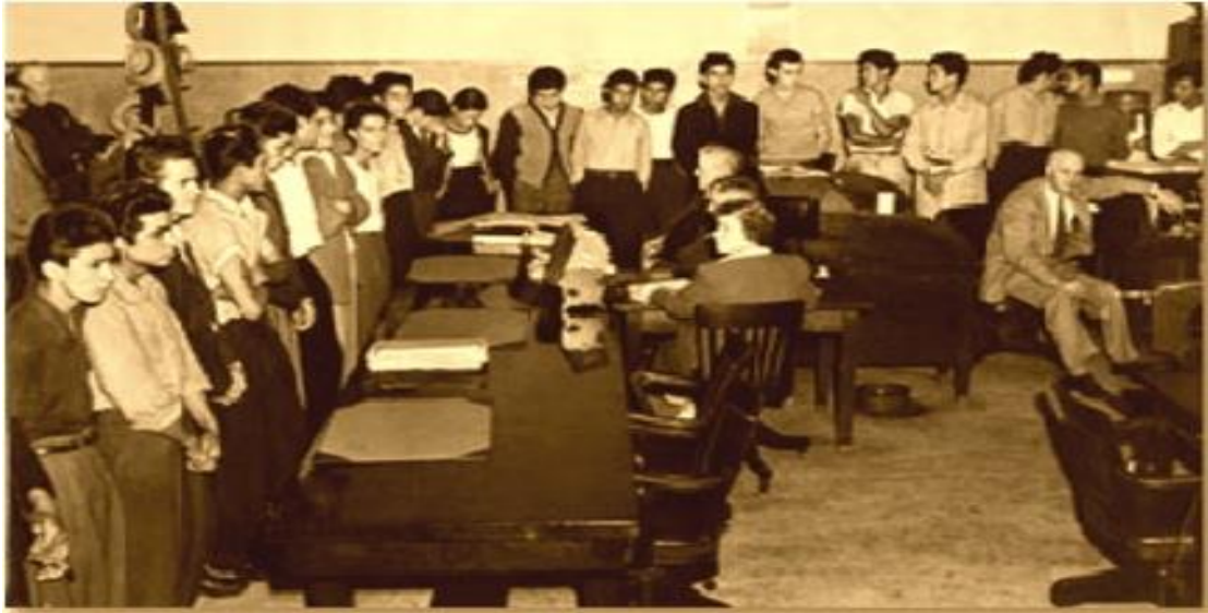
Ilustración 8 Jóvenes del grupo "Calle 38" circulando a la sala de juicio.

El juicio en la corte para los jóvenes detenidos se llevaría a cabo el 13 de octubre de 1943, siendo este el juicio colectivo más grande en la historia de California; durante el desarrollo del juicio la tensión era un tanto perceptible, ya que los perjuicios no se hicieron esperar en la corte, el juez encargado del juicio ordenaría a los inculpados ser presentados ante la audiencia con la vestimenta y los peinados que los caracterizaban como prueba de su presunta culpabilidad como se muestra.