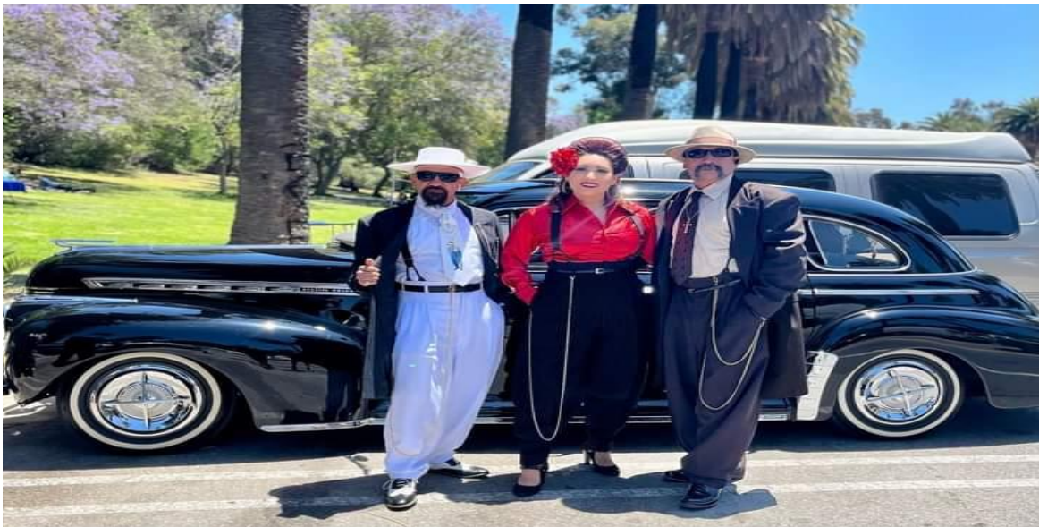
Ilustración 25 Pachucos en Elysian Park, Los Ángeles, California.

Pero no solamente existen blogs que muestran como se hace presente el pachuco en México, también los hay los que muestran como este fenómeno aún continúa existiendo en Estados Unidos, aunque con connotaciones diferentes a las mostradas en México, uno de los principales blogs es “ El Pachuco Zoot Suits, inc. ”, en el que se muestra como la cultura del pachuco se mezcla con la cultura chicana en un entorno rodeado de pachucos y cholos que comparten un mismo ideal el ser chicanos radicantes en los Estados Unidos. En este grupo se difunden principalmente eventos y memoriales en torno al pachuco , donde el elemento principal se basa más que nada en exhibiciones, convenciones y venta de accesorios para el atuendo; por lo que refiere a las convenciones y exhibiciones, los pachucos y pachucas muestran sus mejores atuendos Zoot suit aunado, a ello se le agrega la exhibición de autos clásicos reservados con un extremado toque de elegancia haciendo ver al mundo que el pachuco está más vivo que nunca.