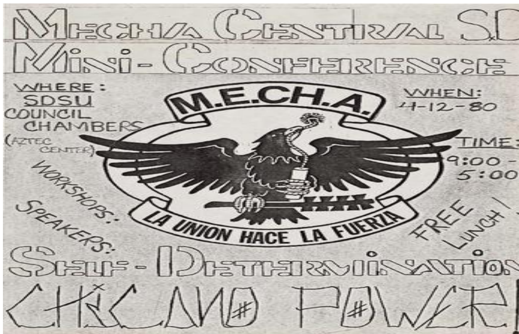
Ilustración 4 Movimiento Estudiantil Chicano de Aztlán (MECHA), portada del programa de una mini reunión en la Central de San Diego, 1980.

En este sentido, el Movimiento Estudiantil lo que intentaba era llevar a cabo un cambio de conciencia en torno a la comunidad chicana, en tanto a la libertad de valores culturales y estilos de vida diferentes con relación a los establecidos con la comunidad norteamericana, planteando que los Estudios Chicanos dotarían de una orientación tanto académica y comunitaria que plantearía la idea que el conocimiento podría fomentarse más allá de las aulas académicas y que este fuera distribuido por los propios estudiantes a la comunidad chicana por medio de los departamentos de Estudios Chicanos.