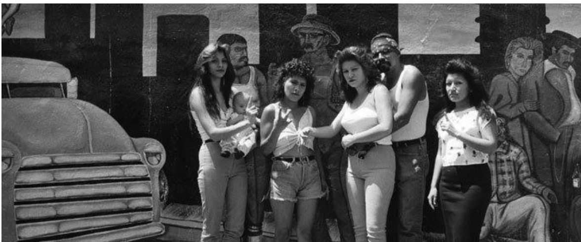
Ilustración 12 El cholismo surge en la década de los años sesena en Los Ángeles, California como una marca de identidad nacional y resistencia social/cultural de la población mexicoamericana como una defensa frente a una cultura norteamericana racista, 1960.