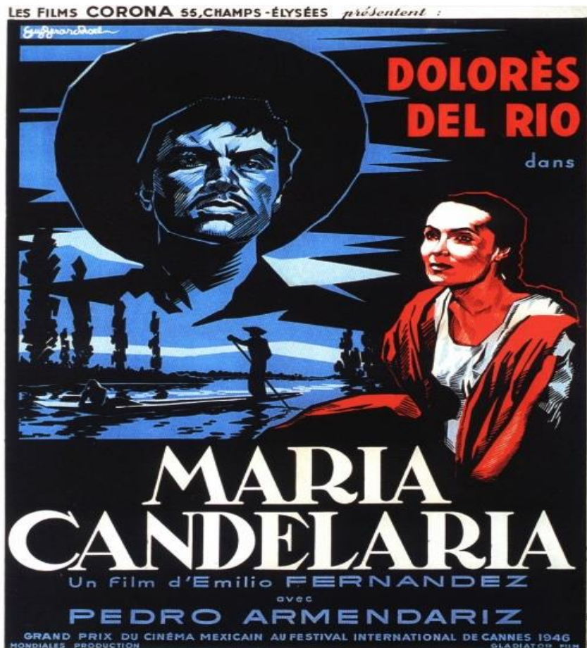
Ilustración 14 María Candelaria (1944) Primera película mexicana ganadora del Gran Prix en Cannes en 1946.

El cine mexicano ganó gran influencia en los Estados Unidos, específicamente en la ciudad de Los Ángeles, en donde cientos de migrantes al mirar la cinematografía mexicana alimentaban la nostalgia y el anhelo de regresar a su suelo natal. Pero no solamente fue en este ámbito donde cobró importancia el cine mexicano de este periodo, tanto en Argentina y España veían a México como un potencial competidor que podía imponerse en sus mercados, por ejemplo, la prensa argentina publicaba en sus encabezados que México se convertía en la nueva meca del cine de habla castellana siendo este el receptor de figuras de renombre para la realización de películas; por otro lado, en Europa triunfaba en la primera edición del festival de