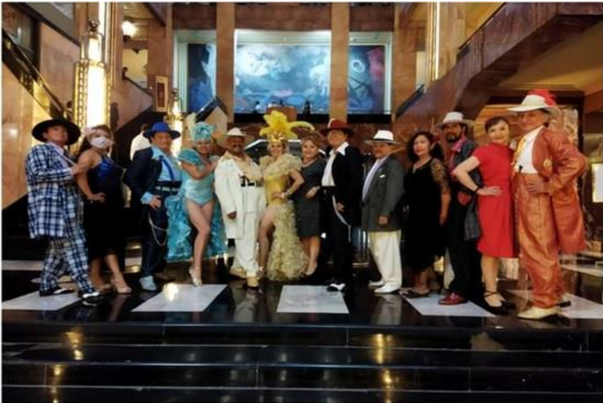
Ilustración 26 Grupo pachucos bailando junto a sus compañeras en un escenario en la Ciudad de México.

los principales salones de baile de la Ciudad de México como lo son “ El California ” y “ Los Ángeles ” bailando al ritmo de Danzón y Mambo, Boogie-Woogie y Cha cha cha; rescatando aquella elegancia que caracterizaba a pachucos y pachucas haciendo de ello un retroceso en el tiempo representando para algunos veteranos sus mejores años de vida y para las nuevas generaciones un acercamiento de cómo era el pachuquismo de la época como fiel representación viva que ha perdurado con el pasar de los años manteniéndose intacta.