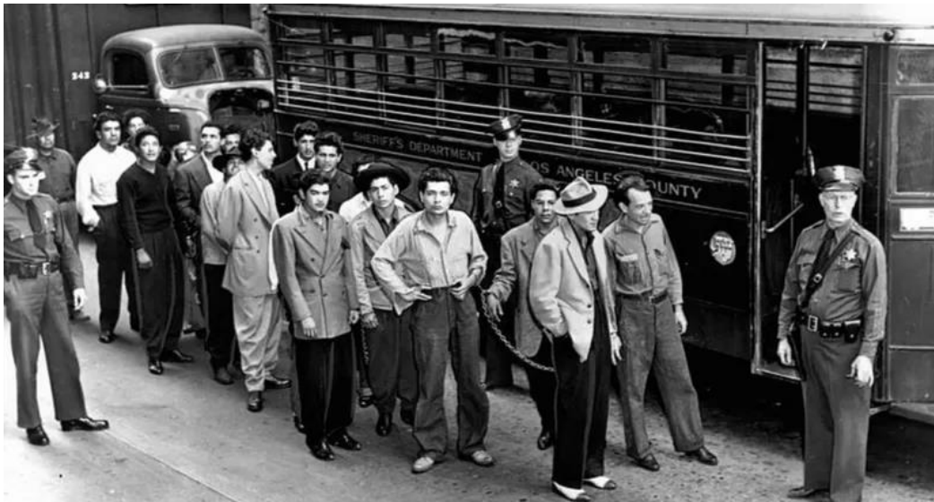
Ilustración 7 Jóvenes pachucos detenidos por el presunto asesinato en Sleepy Lagoon, 1943.

Uno de los sucesos de mayor relevancia que marcaron de forma negativa el entorno de los pachucos en los Estados Unidos ocurrió durante la década de los años cuarenta, específicamente el 2 de agosto de 1942 con el caso de “ El asesinato de Sleepy Lagoon ” (La Laguna dormida) 26 . Sleepy Lagoon conocida popularmente por la comunidad mexicoamericana se localizaba en el Rancho Williams, en el este de Los Ángeles, California; este sitio era una reserva de agua que era utilizada como alberca comunitaria y lugar para la realización de fiestas por la comunidad mexicoamericana, la tarde del 1 de agosto de 1942 en este sitio se llevaría a cabo una fiesta en la que los principales asistentes serían jóvenes mexicanoamericanos, durante la fiesta se generaría una riña callejera dando como resultado que un miembro de uno de los grupos asistentes denominado “ Calle 38 ” 27 fuera golpeado. A la mañana siguiente, el hallazgo del cadáver de un joven que respondía al nombre de José Díaz, de veintidós años asistente un día anterior a la fiesta llevada a cabo en Sleepy Lagoon sería el detonante para culpar al grupo de la Calle 38 , derivado de dichos sucesos se detendrían a veintidós jóvenes por la presunta culpabilidad del asesinato del joven.