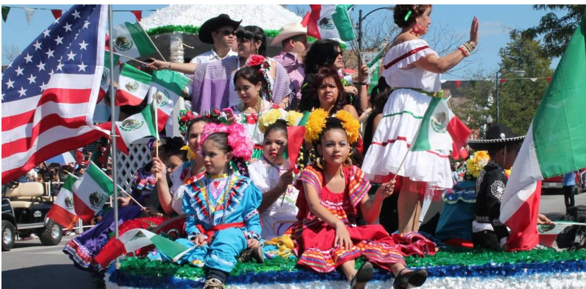
Ilustración 2 El 5 de mayo es una de las festividades más populares entre los estadounidenses, aunque su origen es completamente mexicano.

clases entre Chicano y Pocho fue marcada principalmente por los mexicanos denominados pochos , siendo estas personas de ascendencia mexicana establecidas en el país vecino, mientras que los chicanos serían personas de origen mexicano que tras la segmentación del territorio mexicano quedarían incluidos territorialmente en suelo norteamericano, algunas de estas personas adoptaron el sistema dominante imperante mientras que otras tantas personas continuaron con la preservación de la cultura mexicana”. Estas diferencias traerían consigo fuertes situaciones de discriminación hacia los Chicanos , en una primera instancia por aquellos denominados Pochos como una forma lineal de menosprecio, situación por la que primeramente habían sido víctimas al momento de su acercamiento con la sociedad norteamericana; sin embargo, en un último escenario tanto Pochos y Chicanos eran conglomerados subordinados bajo el dominio político y socioeconómico de los Estados Unidos siendo este el principal manipulador de la identidad e identificación de estos súbditos que se encontraban en un territorio ajeno y que se encontraban a expensas de las reglas impuestas por medio de una estructura clasista en el que su principal motor era regido por el racismo norteamericano, en el que Pochos y Chicanos se encontraban interiorizados bajo este sistema tratando de imponerse el uno al otro.