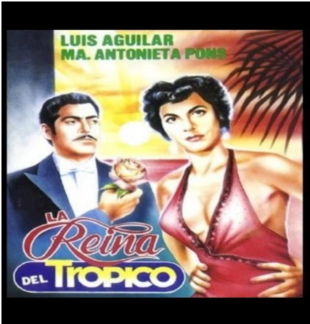
Ilustración 17 Luis Aguilar y Ma. Antonieta Pons en “La Reina del Trópico”, 1946).