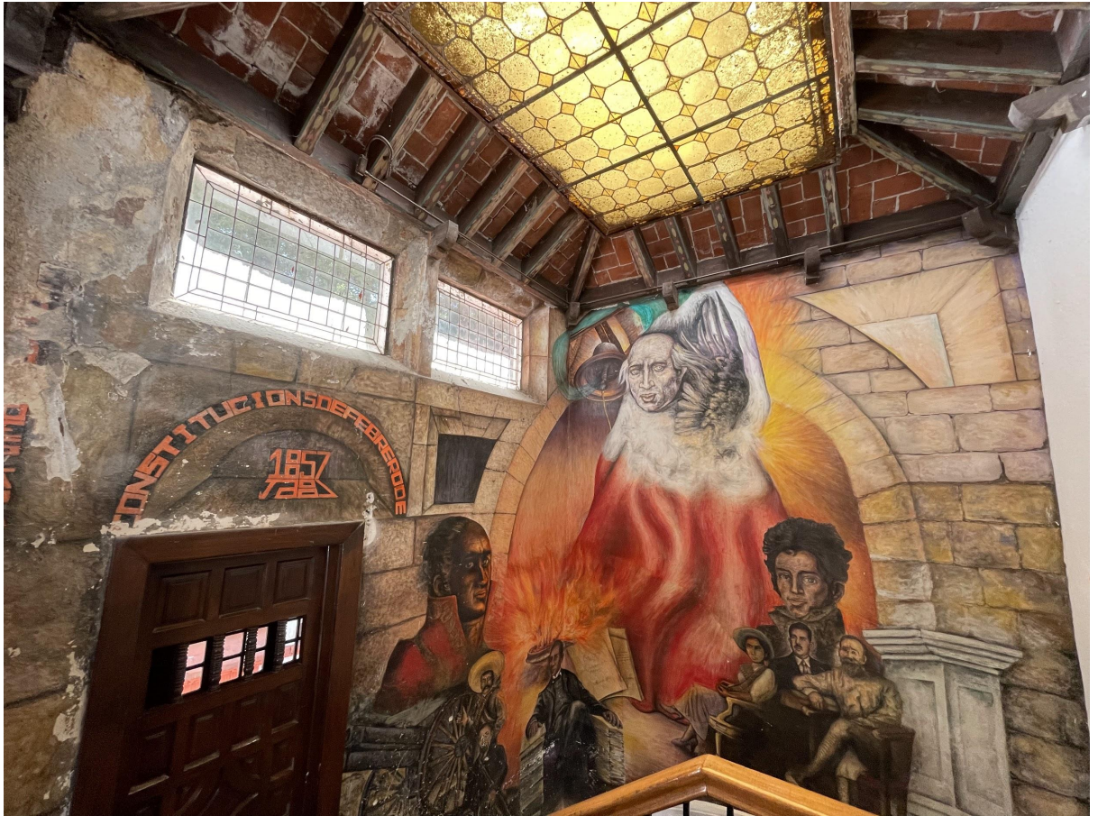
Restauración de mural y vitral en Casa de Cultura Reyes Heróles.