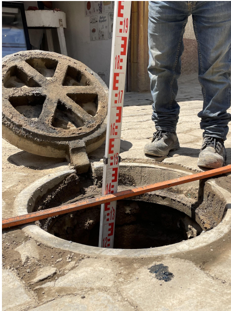
Levantamiento topográfico de pozos de visita, Obra: rehabilitación de drenaje