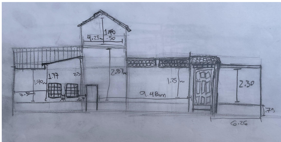
Casa de cultura Reyes Heróles , Fachada Principal Sección 1