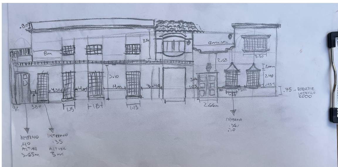
Casa de cultura Reyes Heróles , Fachada Principal Sección 3