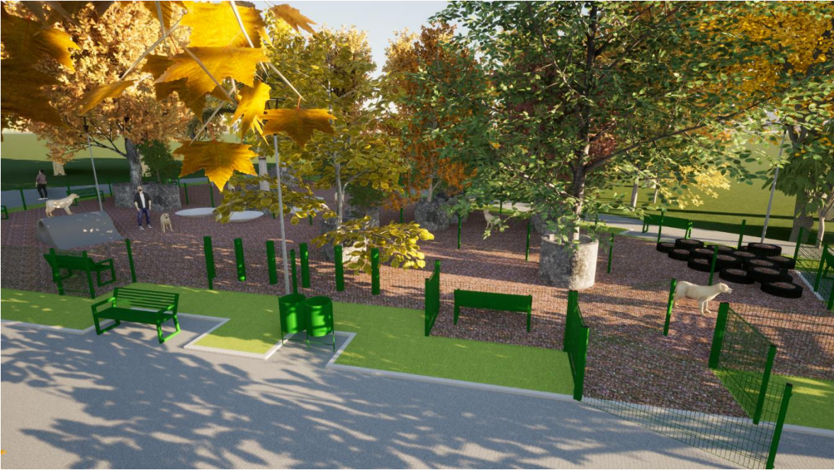
Imagen 3. Render Proyecto Parque para perros Glorieta SCOP: entrada