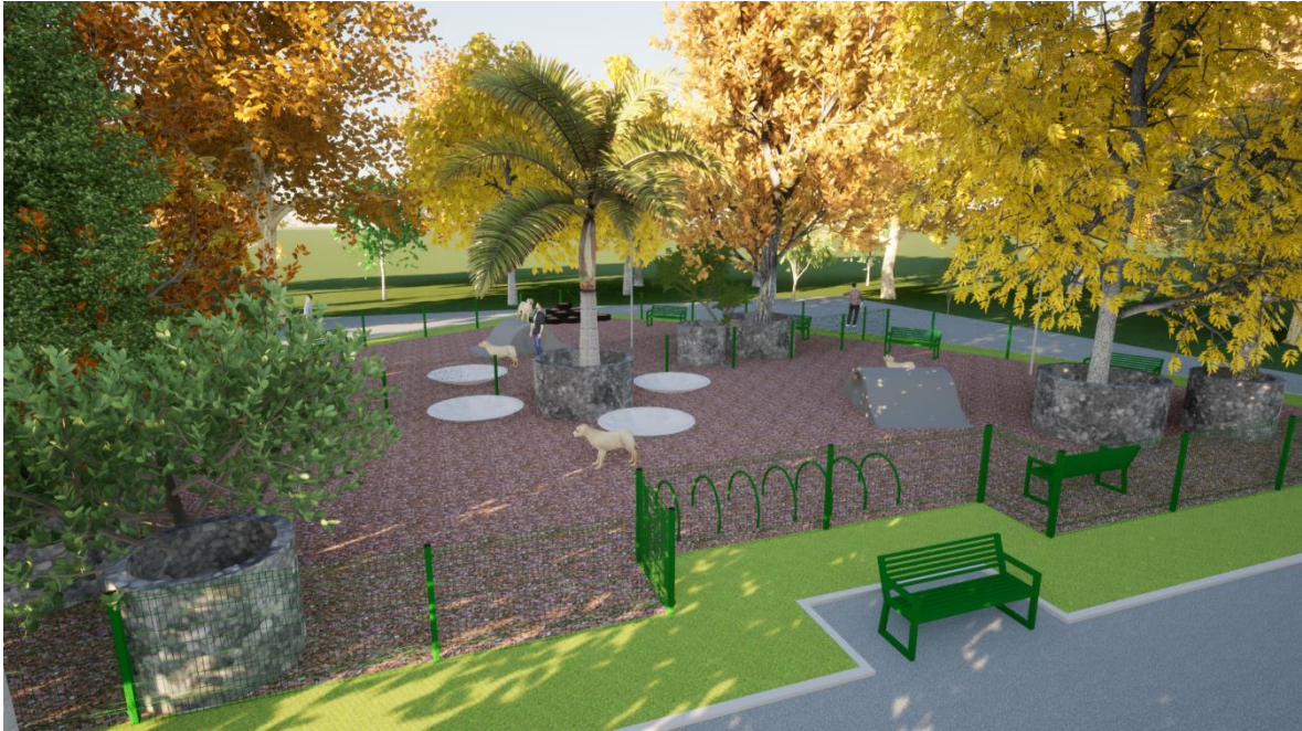
Imagen 1. Render Proyecto Parque para perros Glorieta SCOP: Bebederos