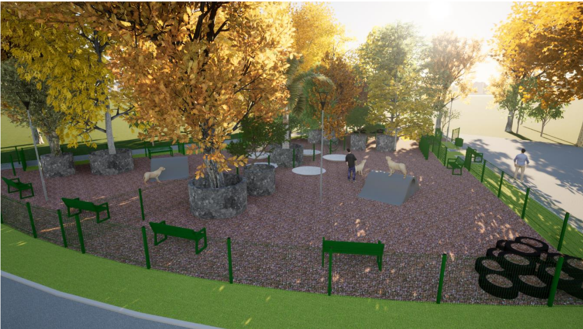
Imagen 4. Render Proyecto Parque para perros Glorieta SCOP: Vista Norte