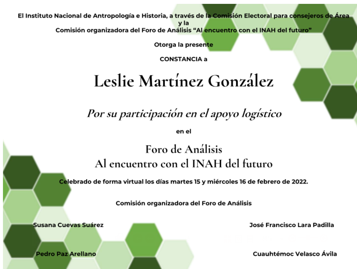
Figura 2. Constancia de participación en foro de análisis INAH