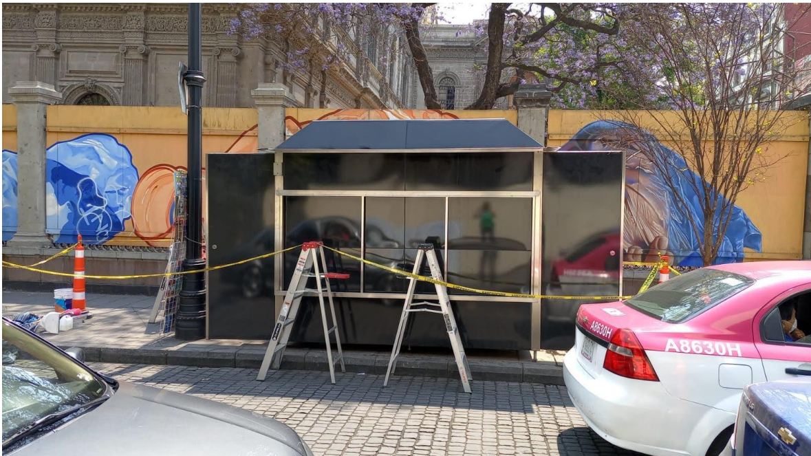
Ilustración 4 Instalación de puesto de periódico en el centro histórico

Después de la creación del nuevo diseño y las pruebas correspondientes realizadas es que se logró en un lapso no mayor a 3 meses la colocación de los 72 nuevos puestos de periódicos, de la cual tuve la oportunidad de estar presente en 2 ocasiones.