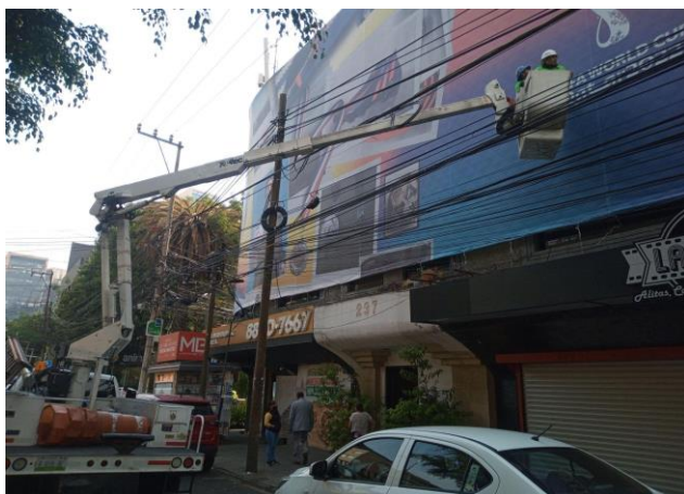
Ilustración 5 Pruebas para retiro de anuncio en la colonia condesa