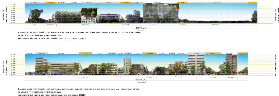
Ilustración 1 Larguillo correspondiente a la calle de Sevilla realizado durante mi servicio social en la SEDUVI

En resumen, mis principales funciones durante este proyecto fueron, visita al sitio para el análisis del mismo, toma de fotografías de las calles, para posteriormente hacer los larguillos correspondientes y por último crear un análisis detallado de la zona tomando como fuentes mapas y fotografías.