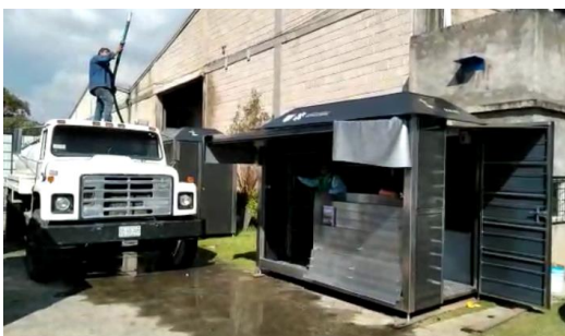
Ilustración 3 Prueba de filtración de agua en puesto de periódico