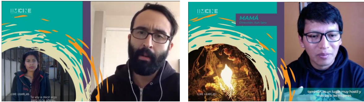
Creación cortinillas "Coberturas" Edición audio y video / Subtitulaje