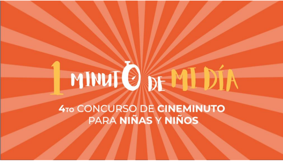
Creación de cortinilla "1 Minuto de Mi Día" Animación Motion Graphics