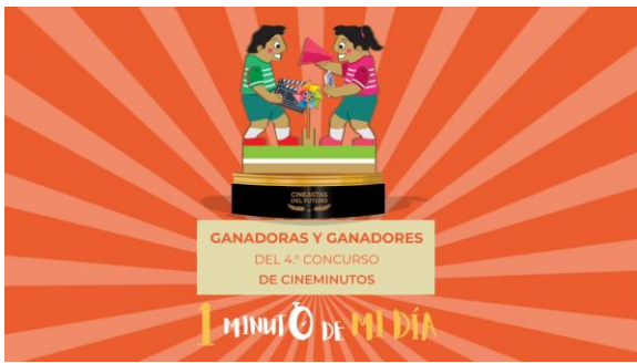
Creación de cortinilla "Ganadoras y Ganadores 1 Minuto de Mi Día" Animación Motion Graphics