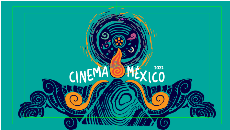
Animación Motion Graphics de cortinilla "Cinema México 2022"