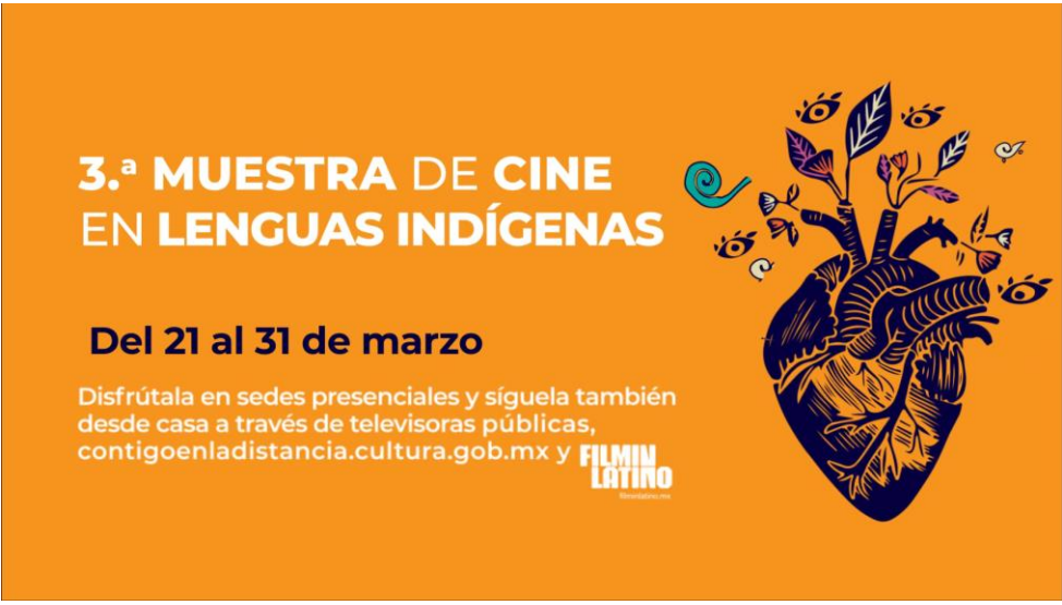
Creación de Cortilla Mensual "3ª Muestra de Cine en Lenguas Indígenas" Animación Motion Graphics / Diseño de Audio para cortinilla