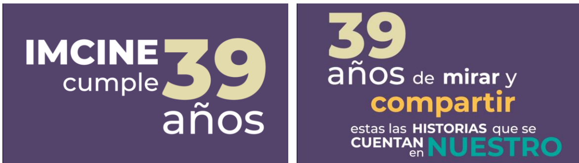
Animación de textos para cortinilla "39 Años IMCINE"