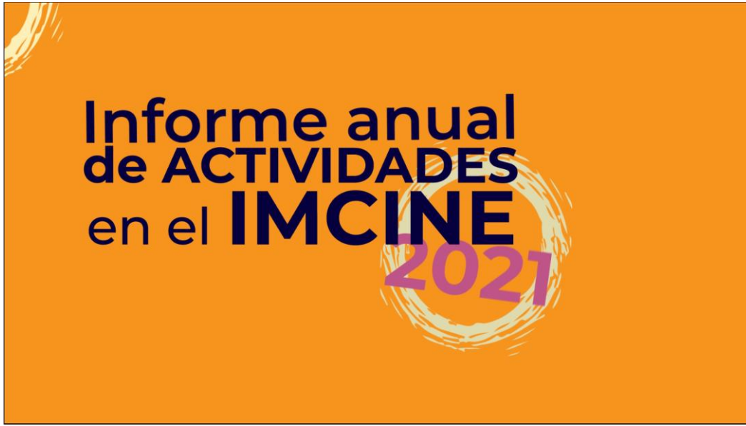
Animación cortinilla "Presentación Informe Anual de Actividades en el IMCINE 2021"