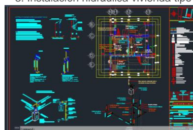
3. Instalación hidráulica vivienda tipo