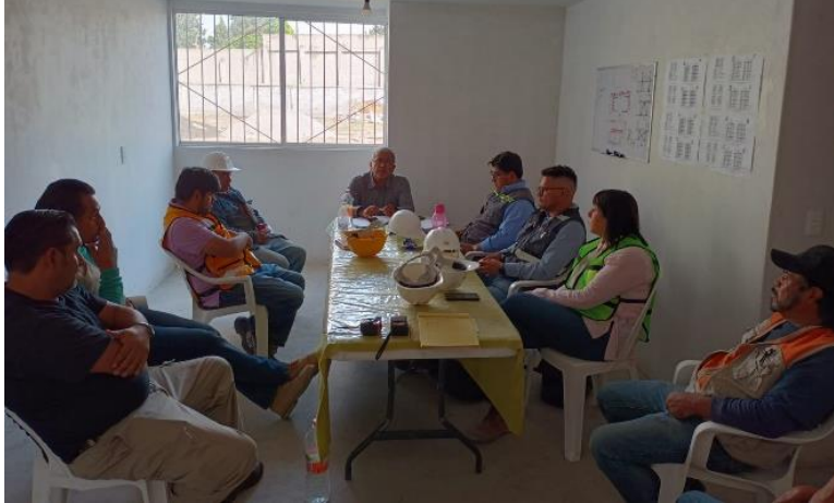
16. Reunión semanal en obra