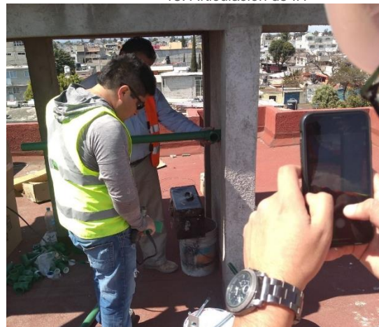
18. Articulación de IH