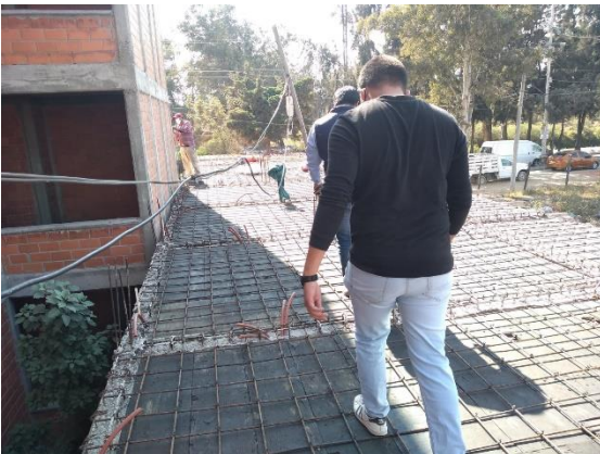
17. Revisión previa a colado Mz 25