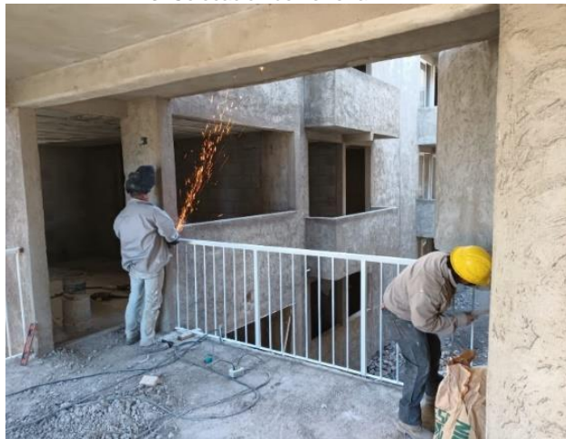
13. Colocación de herrería