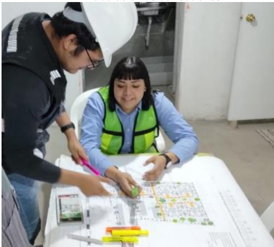
12. Elaboración de correcciones