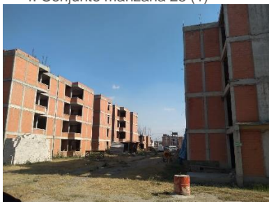
4. Conjunto manzana 25 (1)

obra, pero que al momento de terminar mi servicio social está a unos meses de poder dar termino a los trabajos que quedaron inconclusos y de esta manera otorgarles un lugar digno y funcional a los beneficiarios, que para ambos casos y de la misma forma que en el proyecto “Leyes de Reforma”, son integrantes del FPFV.