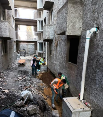
15. Zanja para IS