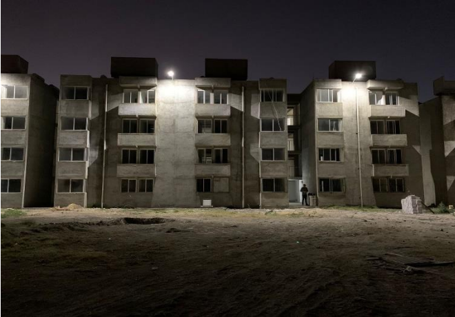
19. Conjunto Tlaxilacall