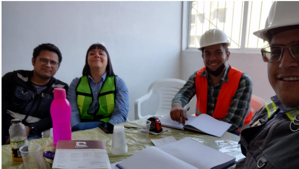
14. Elaboración de bitácora de obra