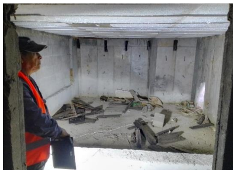
8. Revisión de cimentación