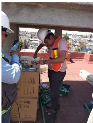
7. Revisión de instalaciones

Dentro del proyecto Tlaxilacalli y dentro de las visitas realizábamos principalmente dos actividades, un recorrido de obra para conocer el estado de los departamentos y el área en general, reconocer los problemas que debían ser solucionados y de los avances de la misma obra semana con semana, adicionalmente participábamos en una reunión con el arquitecto a cargo y con los maestros encargados de los trabajos donde se exponían los problemas y los tiempos en los que se solucionarían los mismos. Como todos estos trabajos se realizan con recursos otorgados por el Instituto de Vivienda cada semana había que entregar de manera digital reportes de obra con fotografías, de esta manera en un par de ocasiones tuve la oportunidad de elaborar estos reportes y de realizar una pequeña descripción de los avances de la obra.