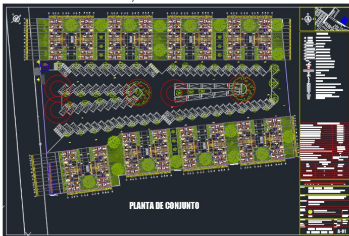
10. Conjunto San Rafael Atlixco