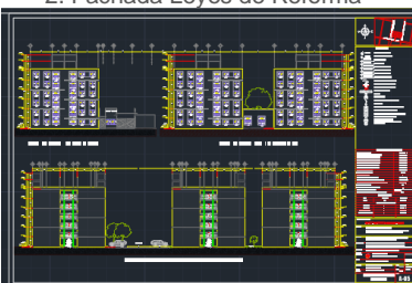
2. Fachada Leyes de Reforma