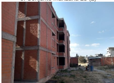
5. Conjunto manzana 25 (2)