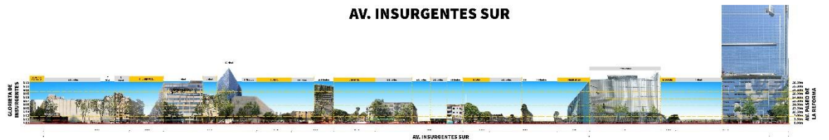
Larguillo fotográfico AV. INSURGENTES SUR, entre GLORIETA DE INSURGENTES Y AV. PASO DE LA REFORMA Niveles y alturas aproximadas Medidas de referencia tomadas de google 2021

La segunda área en la que realicé mi prestación, fue en Instrumentos y Gestión del Desarrollo Urbano (DIGDU) dentro de la Jefatura de Unidad Departamental de Diseño y Aplicación de la Normatividad Urbana (JUD), que tienen como tarea aplicar la zonificación y normas de ordenación correspondientes dentro de un polígono de actuación determinando el cambio y uso de suelo cumpliendo los objetivos y