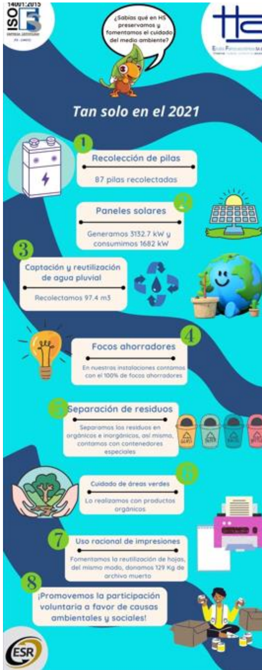
Anexo 8 Flyer elaborado para la campaña de concientización ambiental.