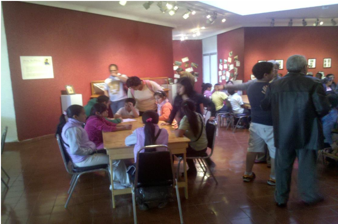
Foto1: Niños Elaborando maqueta

Fotos de Taller seminario Niños, Niñas Arquitectura.