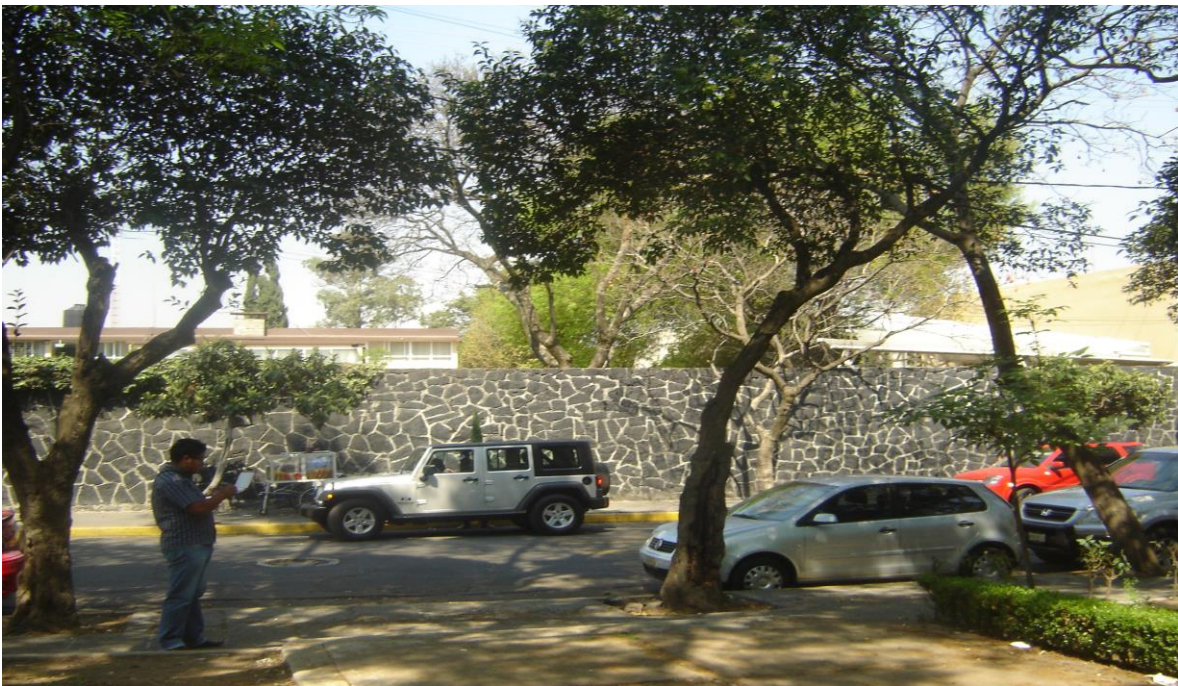
Foto 8: Clasificación de vegetación parque Benito Juárez, Tlalpan.