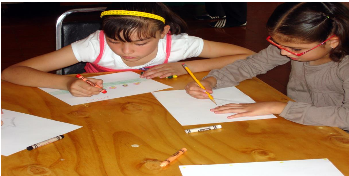
Foto 4: Representaciones graficas de Niños participantes del Taller