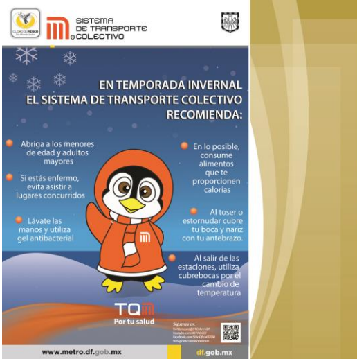
Propuesta de Diseño de Cartel “Temporada de Invierno”