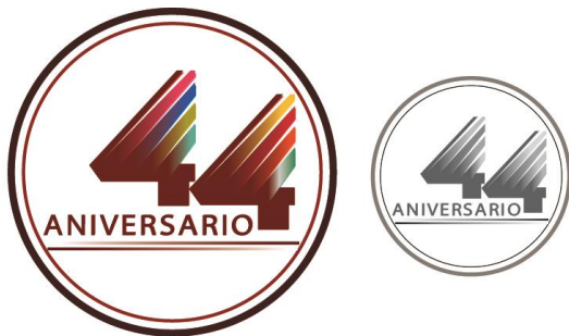
Diseño de Logotipo y Pin 44 Aniversario del Metro