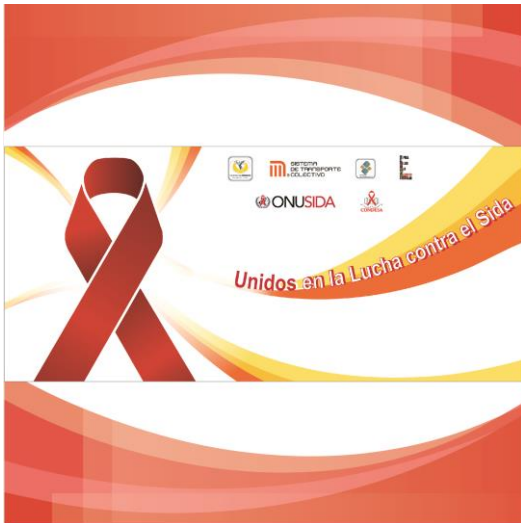
Diseño de Back Evento SIDA