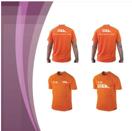
Diseño de Camisas “Ola Naranja”