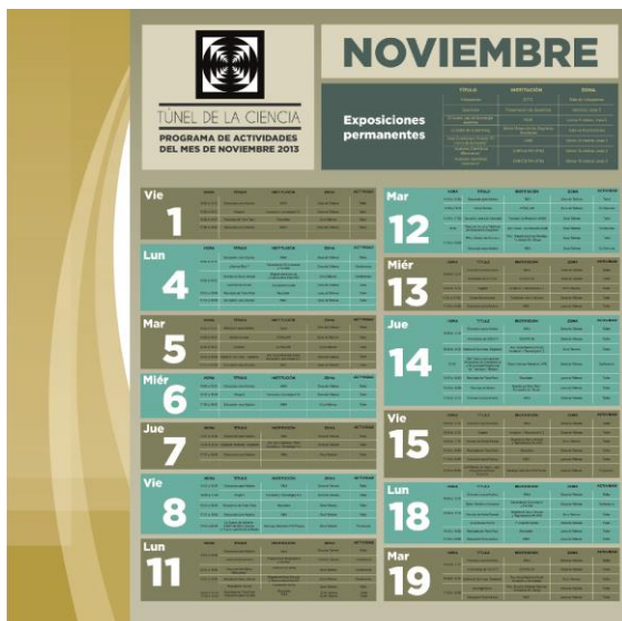
Diseño de Cartel “Túnel de la Ciencia”