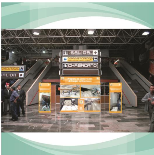
Fotomontaje de Pendones y Back del "Programa de Conservación de Imagen en Estaciones"