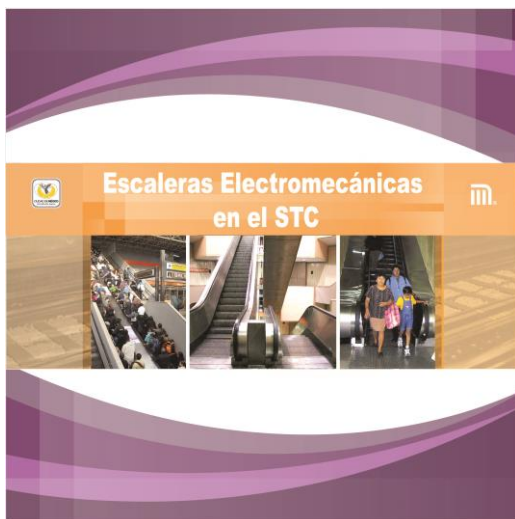
Back para Evento de Recuperación de Espacios “Escaleras Eléctricas”