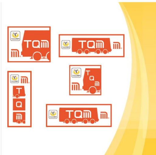
Diseño de Botones para Página Web