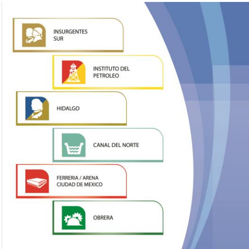
Diseño de Botones para Página Web