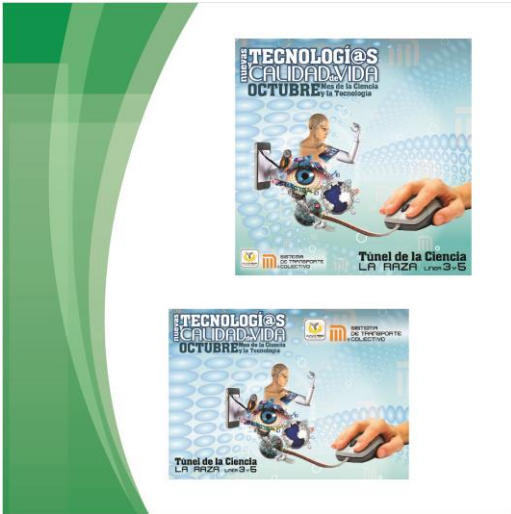
Edición de Cartel para la Semana de la Ciencia y la Tecnología