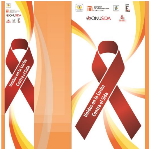
Diseño de Pendones Evento SIDA