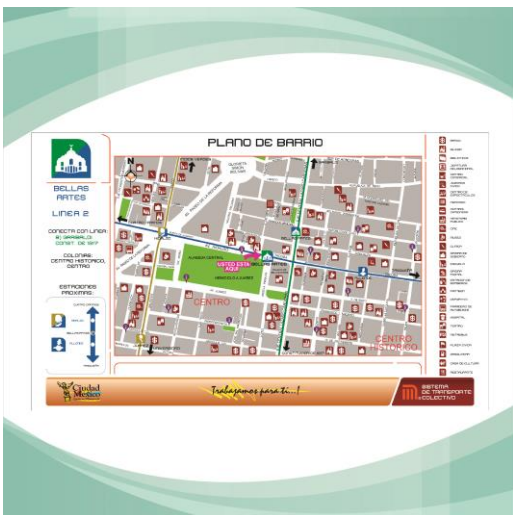
Edición de Planos de Barrio