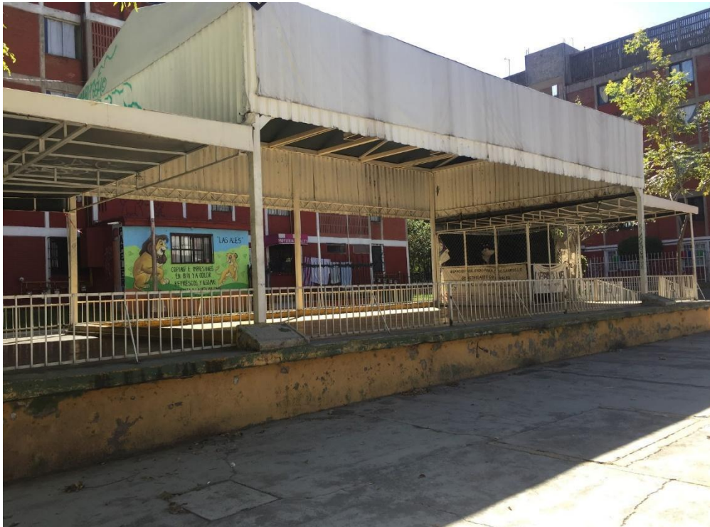
Domo donde se realizan proyecciones y actividades culturales, U. H. Acueducto de Guadalupe, 2018.

el audio, dos bocinas. Tienen aproximadamente 40 sillas de plástico que guardan en una pequeña bodega de 2x1 metros que está hecho de lámina, a un lado está un pequeño sanitario y cuenta con un lavabo en buenas condiciones. Tanto la bodega y el sanitario tienen candados. Arriba del estrado hay un pequeño espacio para guardar cosas, pero está vacío. En los costados de mayor longitud colocan unas lonas que permiten dar oscuridad para que la pantalla tenga una mejor apreciación.