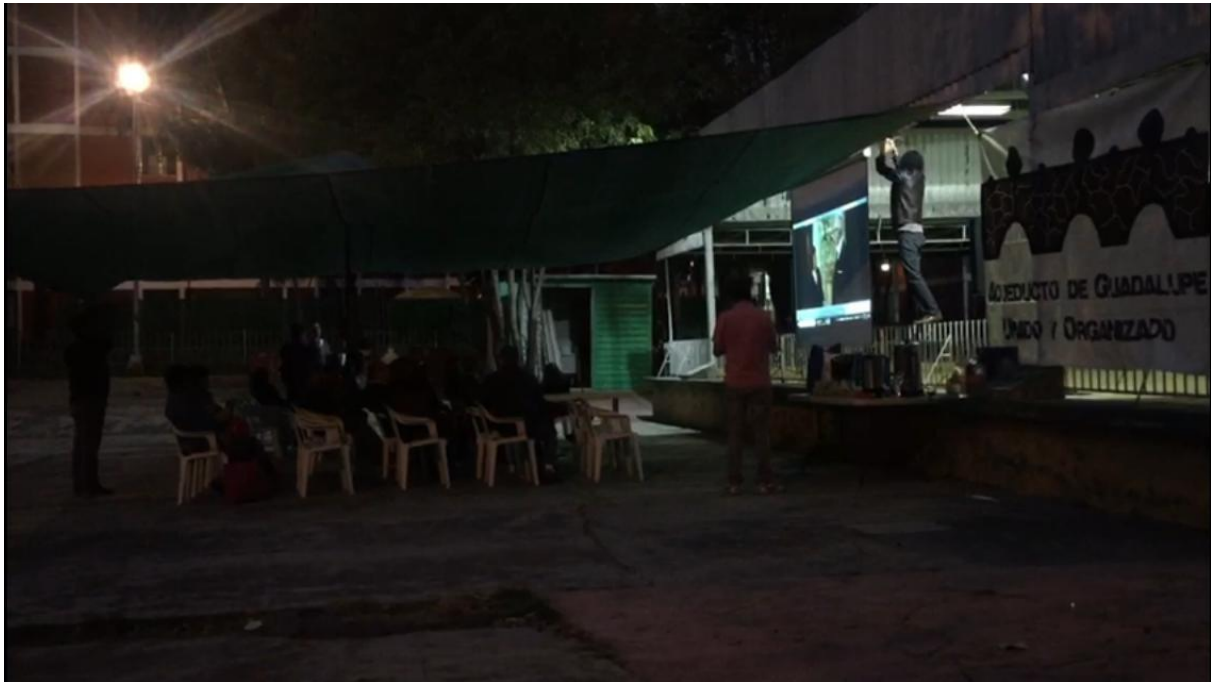
Grupo Acueducto Unido y Organizado en el #Romatón, 2018.