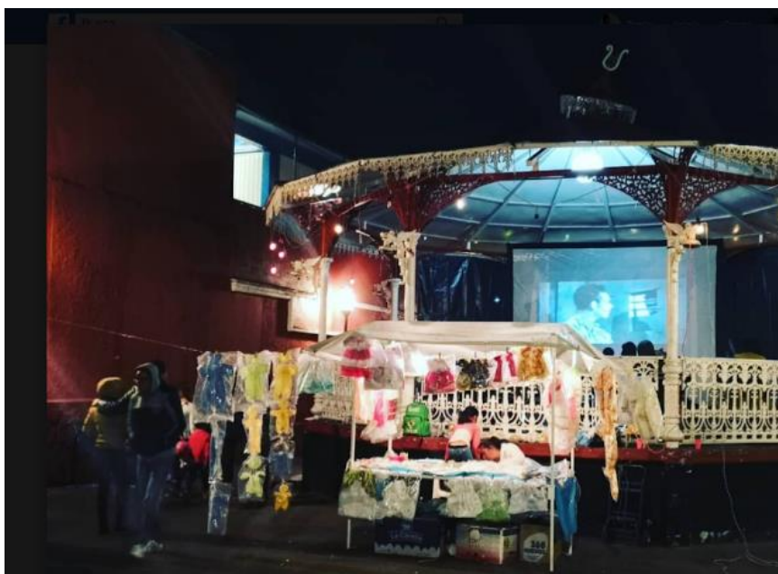
Proyección dentro del quiosco de San Pedro Mártir, Tlalpan, 2019, Fuente: Facebook Cine Club El Gato Azul.