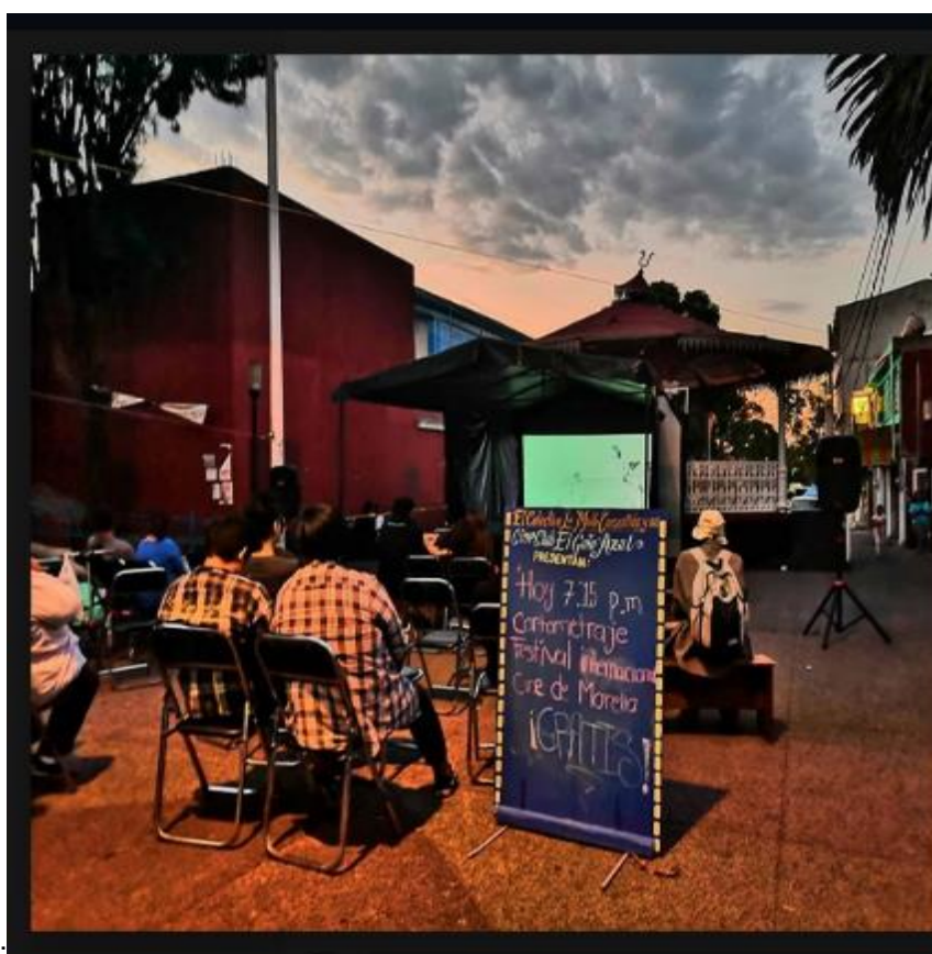
Proyección fuera del quiosco de San Pedro Mártir, Tlalpan, 2019, Fuente: Facebook Cine Club El Gato Azul