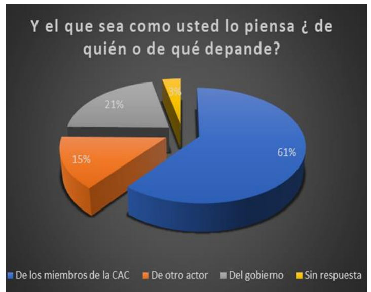
Gráfica 6.1. De quién depende que así sea