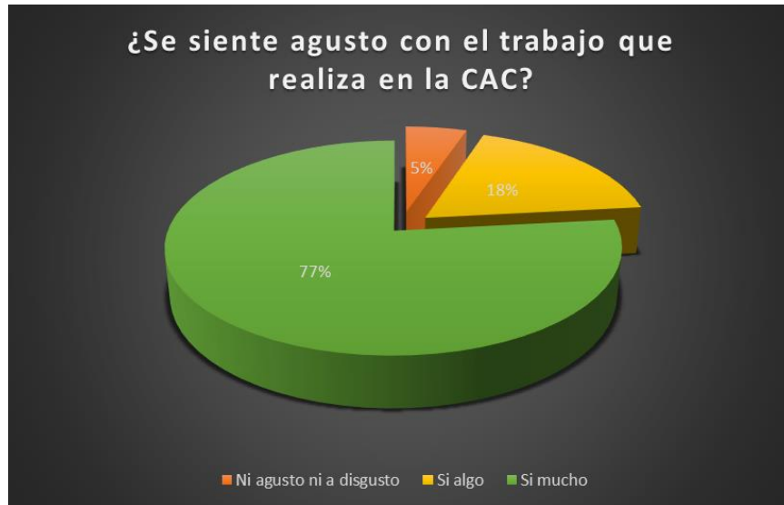
Gráfica 2. Grado de satisfacción con el trabajo realizado en la CAC