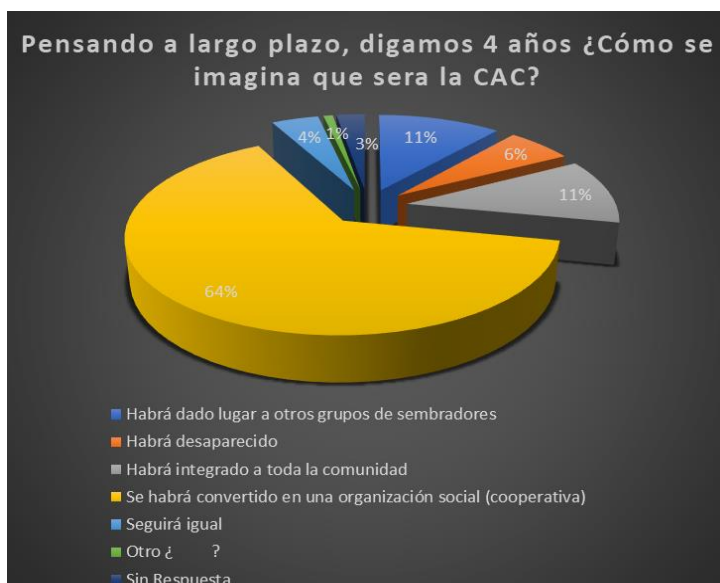
Gráfica 6. Como visualiza la CAC a largo plazo