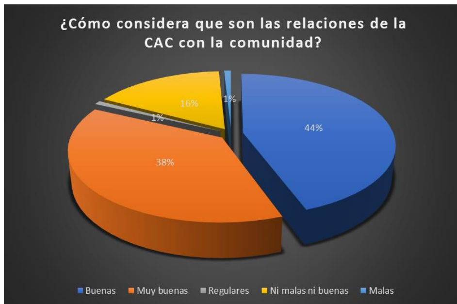
Gráfica 4. Relaciones en la CAC