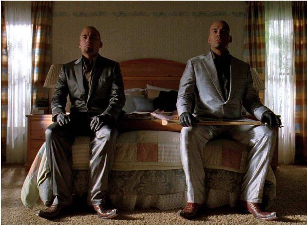
Leonel y Marco Salamanca, Clan Salamanca: Breaking Bad 2008.

“El Clan Salamanca lo forman Tuco Salamanca (Raymond Cruz), Héctor (Tío) Salamanca (Mark Margolis) y los Primos (Daniel Moncada y Luis Moncada), los principales distribuidores de la droga con los que se enfrenta Walter White. Representan los villanos por excelencia por sus métodos despiadados y sin contemplaciones, para mantenerse en el negocio, protagonizando las acciones más violentas de Breaking Bad . “ 88