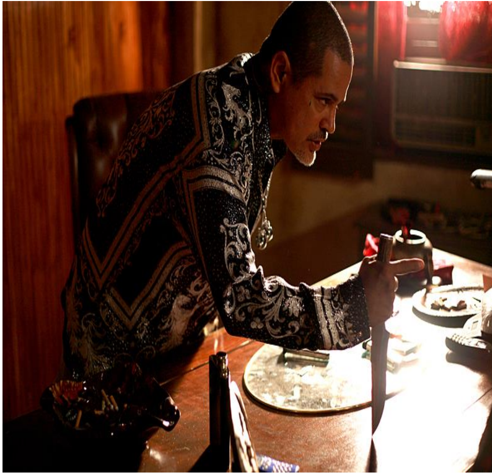
Tuco Salamanca, integrante y líder del Cartel de Juárez, México, en Albuquerque, Nuevo México: Breaking Bad 2008.

Esto tiene relación con el western porque plasma el imaginario social en donde los individuos del sur viven en un mundo sin ley y es exactamente lo que Breaking Bad proyecta en cuanto a la imagen de los mexicanos; otro personaje en la serie es Don Eladio Viente, quien es el principal líder de la organización criminal en Ciudad Juárez, México. El estereotipo plasmado a esta persona es negociador, pero a la vez violenta en la forma de relacionarse con personas de México o Estados Unidos, es de manera descortés y agresiva, porque todo lo que quiere lo obtiene mediante la violencia.