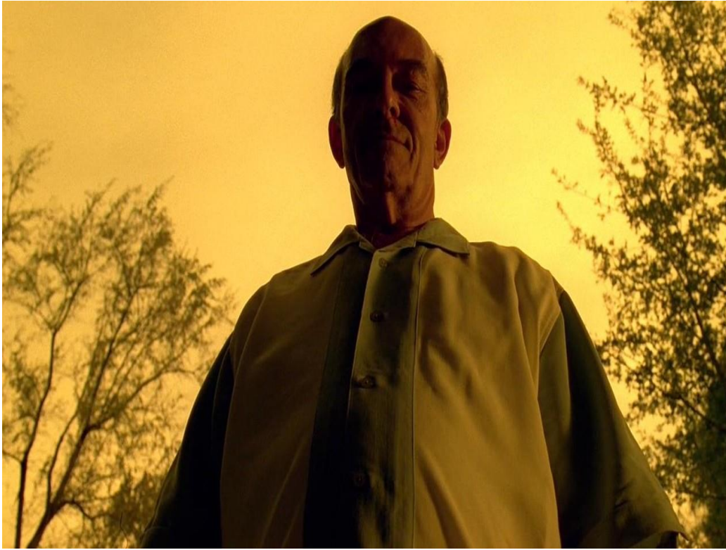
Héctor Salamanca, Clan Salamanca: Breaking Bad 2008.

En la actualidad el cine que proyecta Estados Unidos sobre México, en este caso el de Ciudad Juárez es negativo. La serie Breaking Bad contribuye a ello, pero lo que está en juego es que con la basta industria cinematográfica estadounidense las personas de varias partes del mundo se asemejan con su contenido y es así como estas mismas estereotipan al verse influenciados por este tipo de cine.