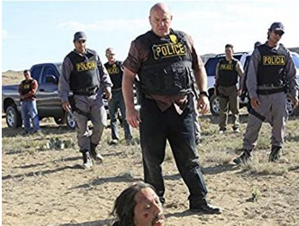
Hank Schrader, el Paso Texas: Breaking Bad 2008.

social también se plasma en la serie mediante el paso de las personas del sur al norte, la frontera juega un papel muy importante la serie muestra un lugar lleno de paraísos para los mexicanos y por otro lado un lugar de peligro cuando los estadounidenses observan o se informan que las personas del sur ya se encuentran en su nación.