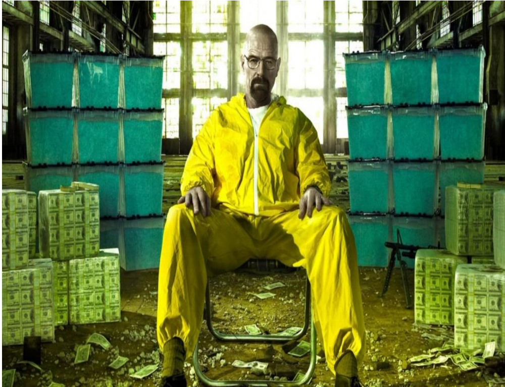
Walter White en la industria de la metanfetamina: Breaking Bad 2008.

donde los espectadores son ansiosos de los episodios, porque la violencia, la inteligencia, el crimen organizado, etc. Son expectativas que están a la espera de sus fans, y una vez proyectadas el consumidor las adopta.