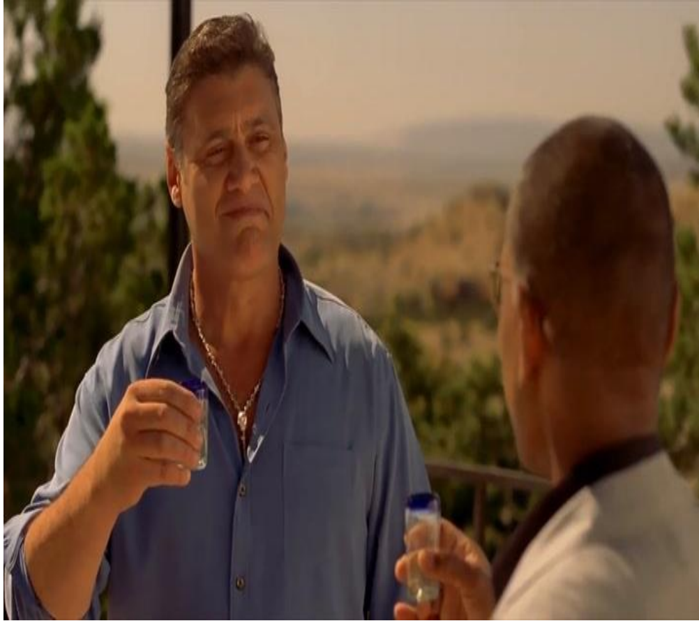
Don Eladio Vuente, líder del cartel de Juárez, México: Breaking Bad 2008.

“Una nueva clase consumidora, que posee una mayor alfabetización, tiene un bagaje cultural que le permite unas lecturas más complejas, agradece que se le muestre sin tapujos la realidad social, política y económica, los problemas familiares, la presencia de Walter White como un antihéroe con el que se implicará emocionalmente, una narración que va ser producida como una narración extendida, como en una larga novela, tamizada por la creatividad, desarrollada por el showrunner, Vince Gilligan, que va a emplear todo tipo de recursos narrativos, tanto de imagen como de sonido.” 86