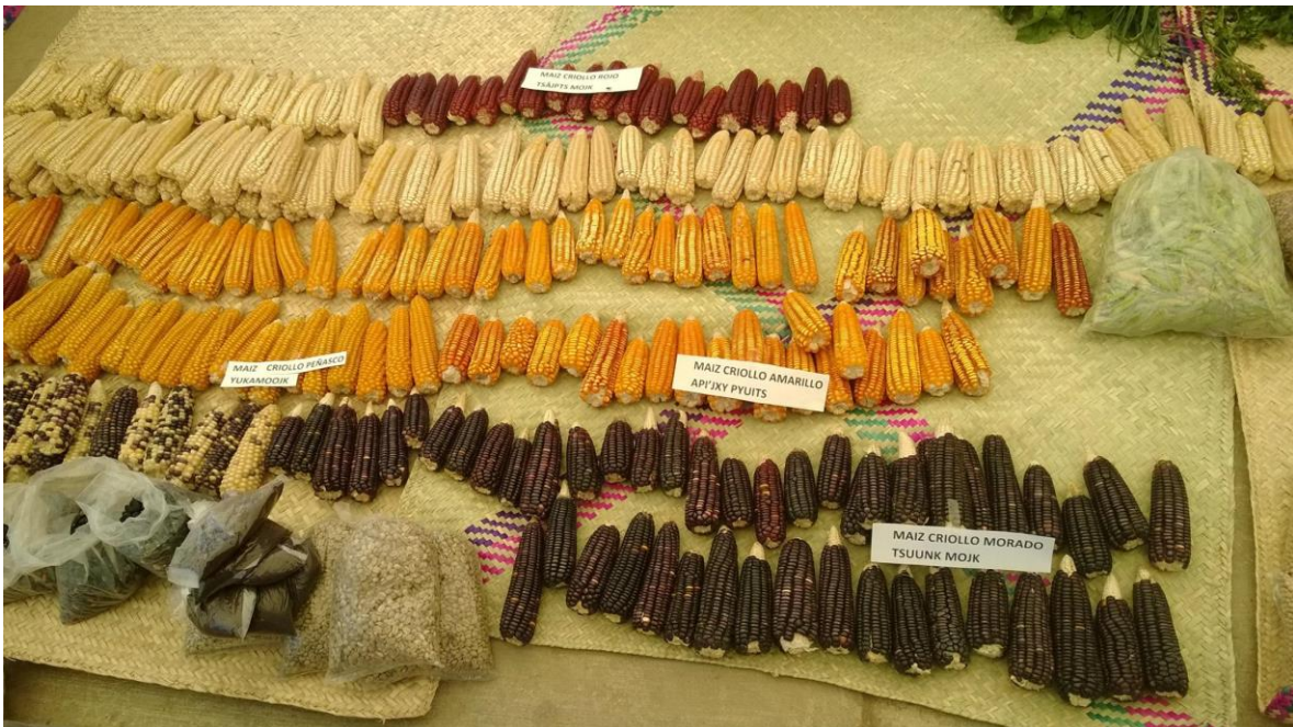
Ayutla Mixe. (s.f) [Tipos de maíz de la región]

https://www.facebook.com/photo/?fbid=582787868465072&set=a.582790425131483&__tn__=%2CO*F