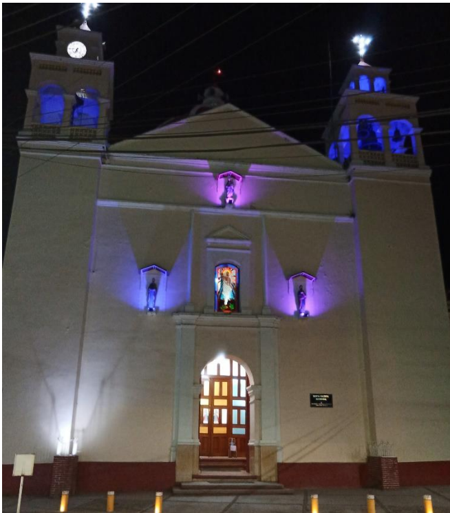
Ayutla Mixe. (s.f) [Fachada de la iglesia mostrando a los santos patronos del pueblo]

https://www.facebook.com/photo/?fbid=3540558866021276&set=a.586746134735912&tn=%2CO*F