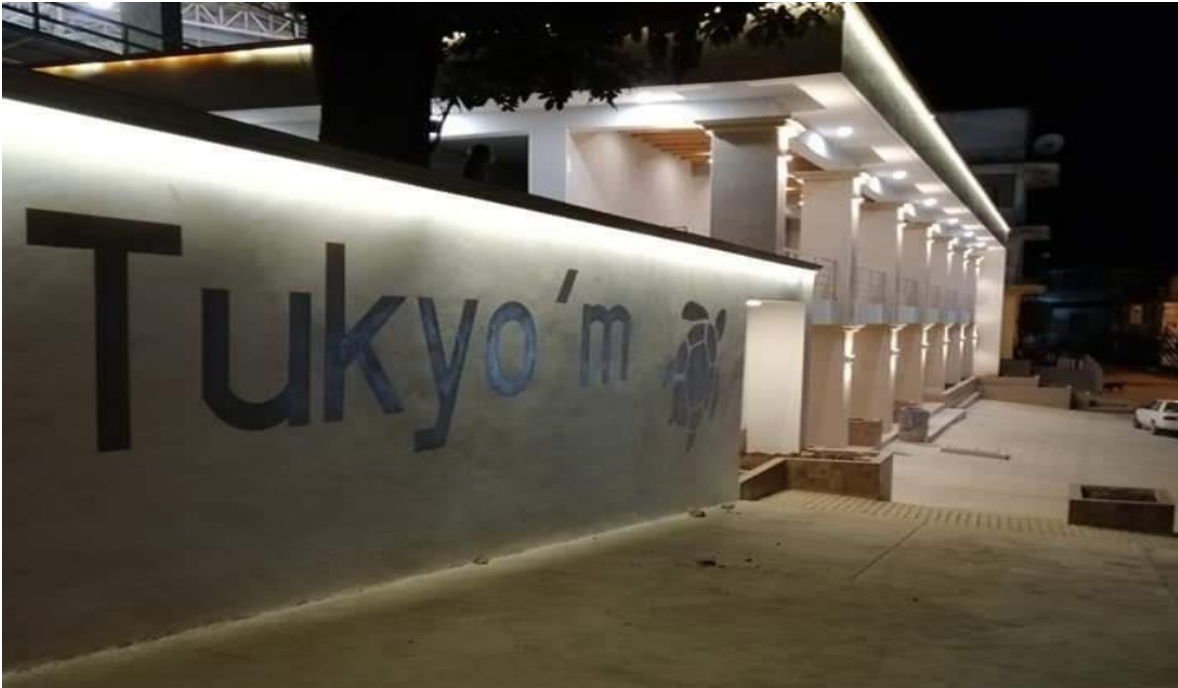
Ayutla Mixe. (s.f) [fachada de la plaza]

https://www.facebook.com/photo/?fbid=4184706728273150&set=a.581204918623367&_tn_=%2CO*F