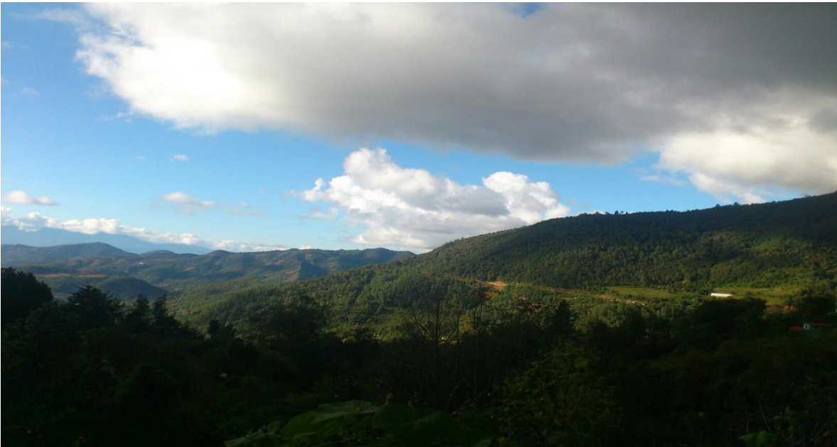
Ayutla Mixe. (s.f) [Vista de región mixe]