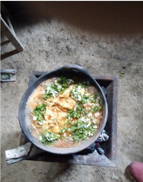
Ayutla Mixe. (s.f) [platillo tradicional de la región Mixe “Machucado”]

https://www.facebook.com/photo/?fbid=864961186914404&set=a.582790425131483&_tn_=%2CO*F