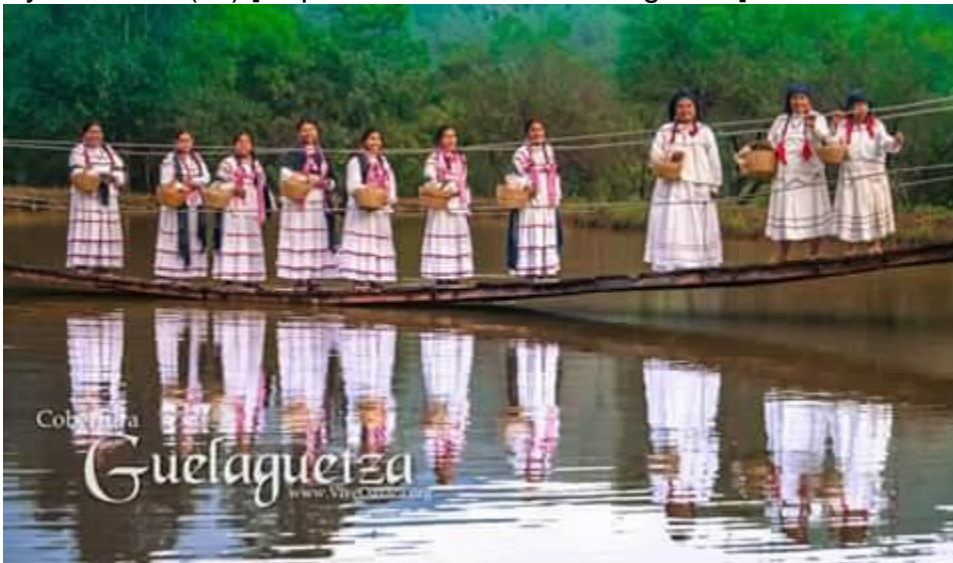
Ayutla Mixe. (s.f) [Representante en la Guelagueta]

https://www.facebook.com/photo/?fbid=855856724491517&set=a.581204918623367&__tn__=%2CO*F