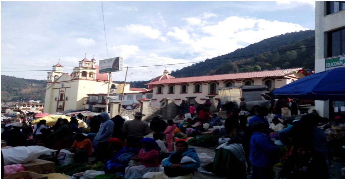
Ayutla Mixe (s.f) [Dia de plaza en Ayutla]

https://www.facebook.com/photo/?fbid=590575761019616&set=a.582790425131483&tn=%2CO*F