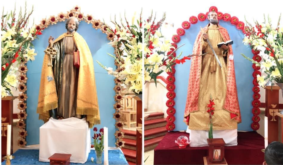
Ayutla Mixe. (s.f) [San Pedro y San Pablo, santos patronos del pueblo]

https://www.facebook.com/photo/?fbid=2662769487133556&set=a.581204918623367&tn=%2CO*F