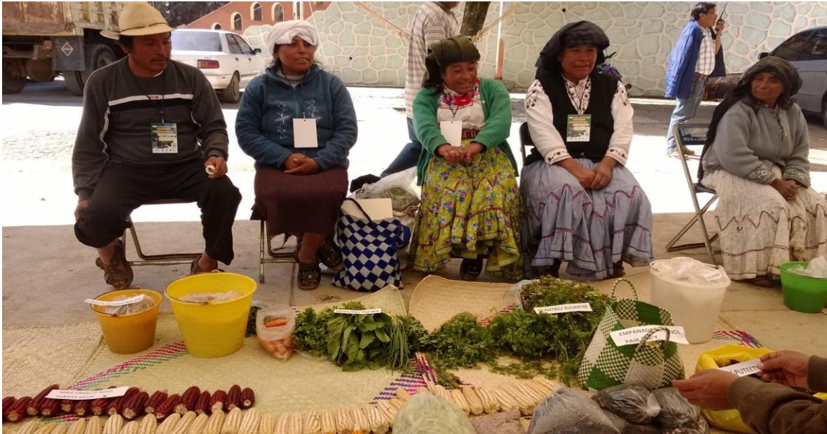
Ayutla Mixe (s.f) [comerciantes de la región Mixe]

https://www.facebook.com/photo/?fbid=582788041798388&set=a.582790425131483&tn=%2CO*F