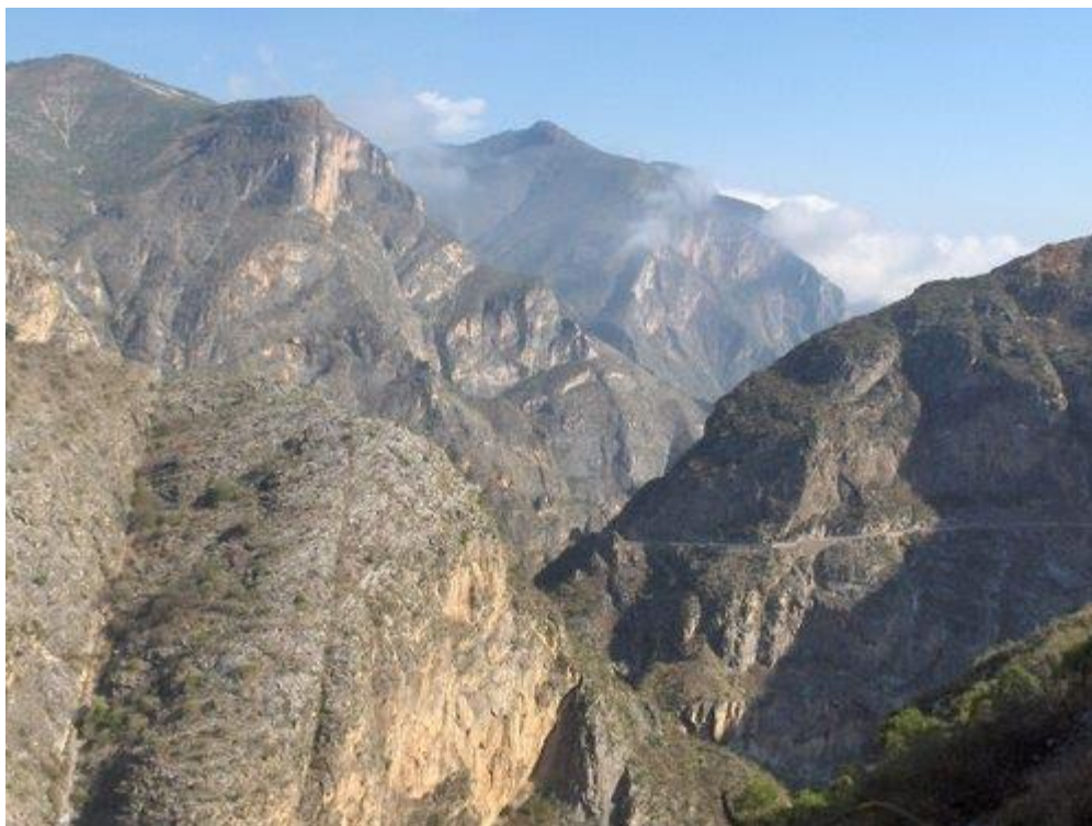
Paisaje del camino que conduce a la mina “El Cardonal”