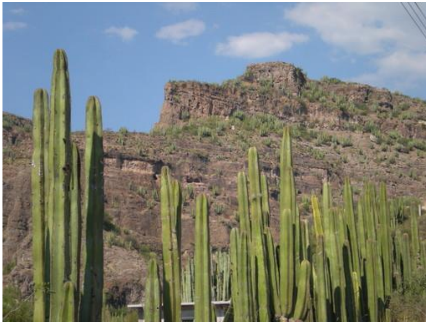
Paisaje de los alrededores de la cabecera municipal de Zimapán