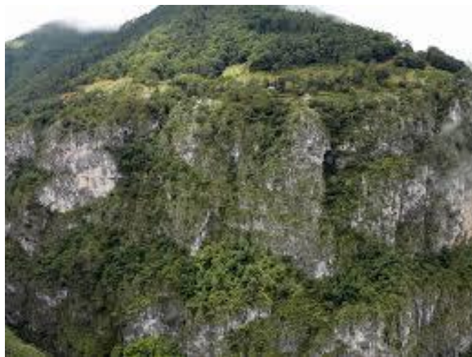
Paisaje del Parque Nacional de Los Mármoles, Zimapán

Hidalgo cuenta con 5 áreas naturales protegidas a nivel estatal y 4 a nivel federal, una de las cuales es el Parque Nacional de los Mármoles, que forma parte de Zimapán.