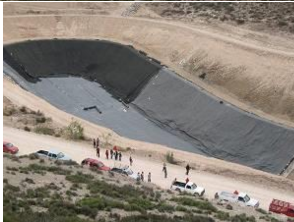
Instalaciones del confinamiento. En la tercera imagen puede observarse el primero de los cinco vertederos para almacenar los desechos tóxicos.