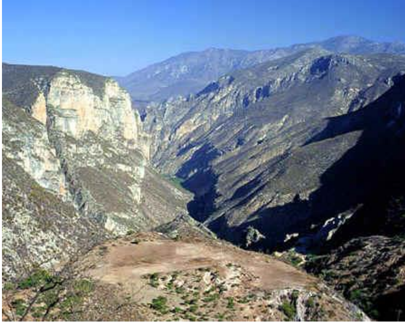
Paisaje de la zona montañosa cercana al confinamiento de desechos tóxicos

La mayor parte del territorio es abrupto y semidesértico. Su clima tiende a ser de templado a caluroso y cuenta con poca vegetación, básicamente cactáceas como nopaleras, matorral alto, maguey, órganos, biznagas, huizaches y mezquites. Su fauna es variada y se encuentran especies como el lobo, coyote, tigrillo, tlacuache, víboras, águilas, cuervos, lechuzas, calandrias, codornices, cenizos y cardenales.