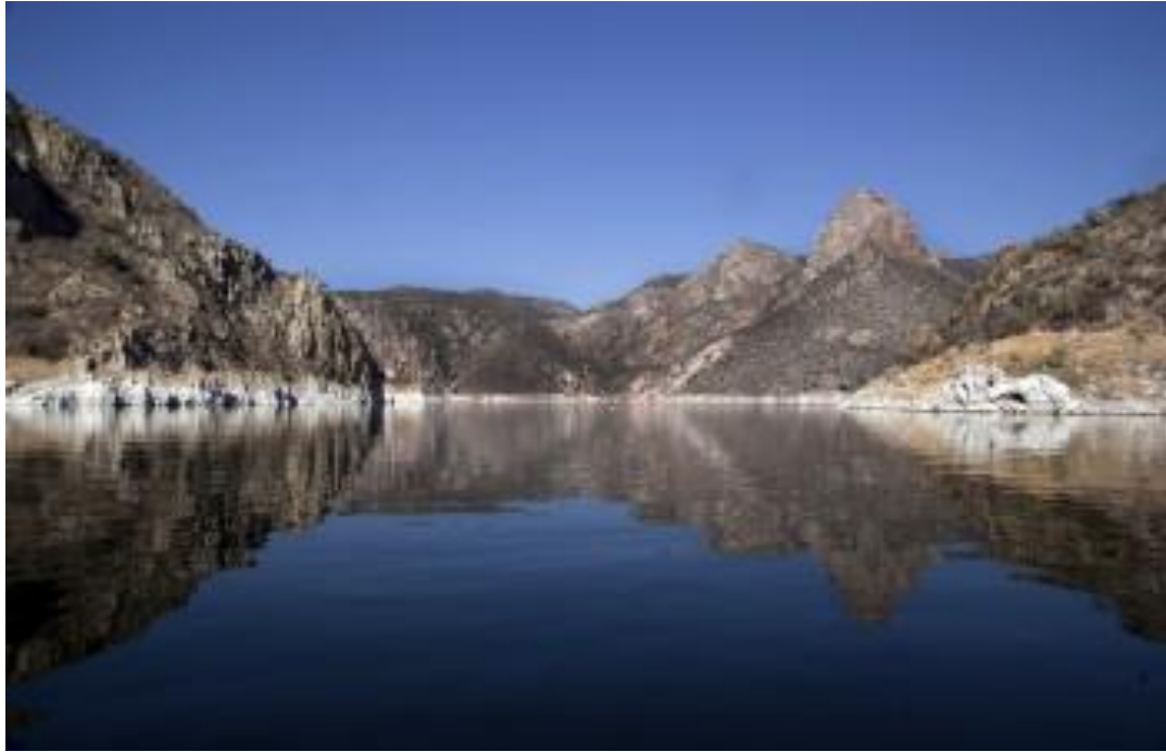
Paisaje de la presa de Zimapán

Un dato pertinente para este proyecto se refiere a que Hidalgo es un Estado con escasas corrientes de agua, debido que a las condiciones abruptas de la SMO generan que los escurrimientos pluviales desciendan a los estados vecinos de San Luis Potosí, Veracruz y Puebla. Para Zimapán las corrientes de agua cercanas se ubican 20 km al sur, en Tasquillo y 12 km al oeste en la Presa de Zimapán, misma que comparte con Querétaro.