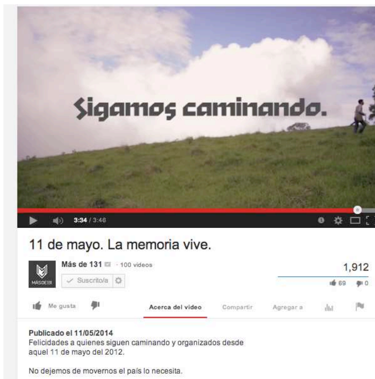
Imagen 13, captura de pantalla en YouTube el 06/06/14