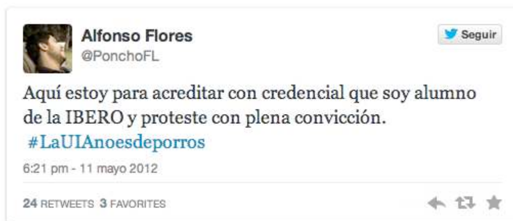
Imagen 3, obtenida en Twitter como captura de pantalla, mayo de 2014.

La cuenta de Alfonso vinculó a dos grupos que a simple vista, no tenían una conexión inmediata, pero que terminó conectando a los nodos. El tweet que permitió esta conexión fue: