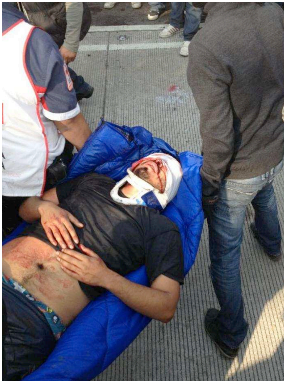
Imagen 10, “Herido 3”, Rodrigo Jardón, obtenida de http://1dmx.wordpress.com/fotografia/

Para conocer más testimonios, imágenes y videos sobre lo que ocurrió el #1Dmx, se recomienda visitar las páginas “Operación 1Dmx” http://www.op1d.mx/ , que es un portal informativo que se acompañó de una serie de protestas el 1 de diciembre de 2013, sobre todo a un año de la represión policial en 2012. También está el sitio “1Dmx cuenta tu historia” http://1dmx.wordpress.com/ en donde aparecen videos, fotos, testimonios y otros materiales de personas que estuvieron presentes el 1 de diciembre, o también hay el video “1Dmx San Lázaro”