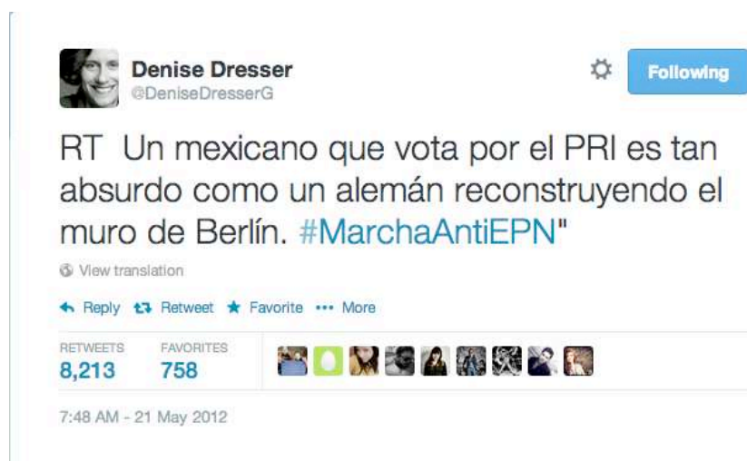
Imagen 2, obtenida en Twitter como captura de pantalla, mayo de 2014.

“¿Y tú, te sumas?” es la pregunta que Dresser lanzó al final de su tweet, y que responde a una coyuntura electoral en la que el PRI era el principal enemigo y que su candidato, no debía ganar con sus habituales y seculares artimañas priistas. Un tweet de la también periodista en mayo de 2012 confirma la posición que asumió desde ese entonces, una posición que marca como retrógrada el regreso del Partido Revolucionario Institucional a la silla presidencial.: