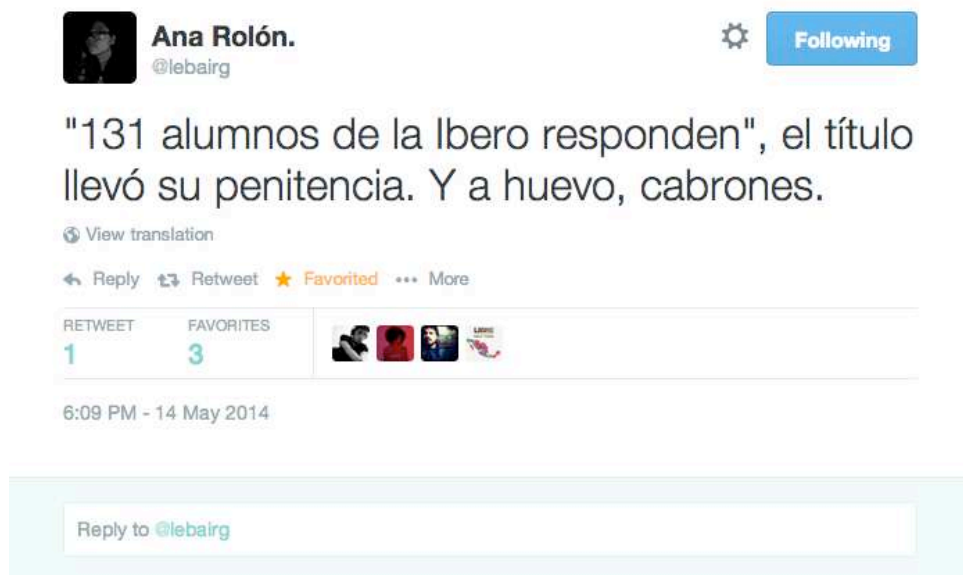
Imagen 12, Captura de pantalla en Twitter 14/05/14