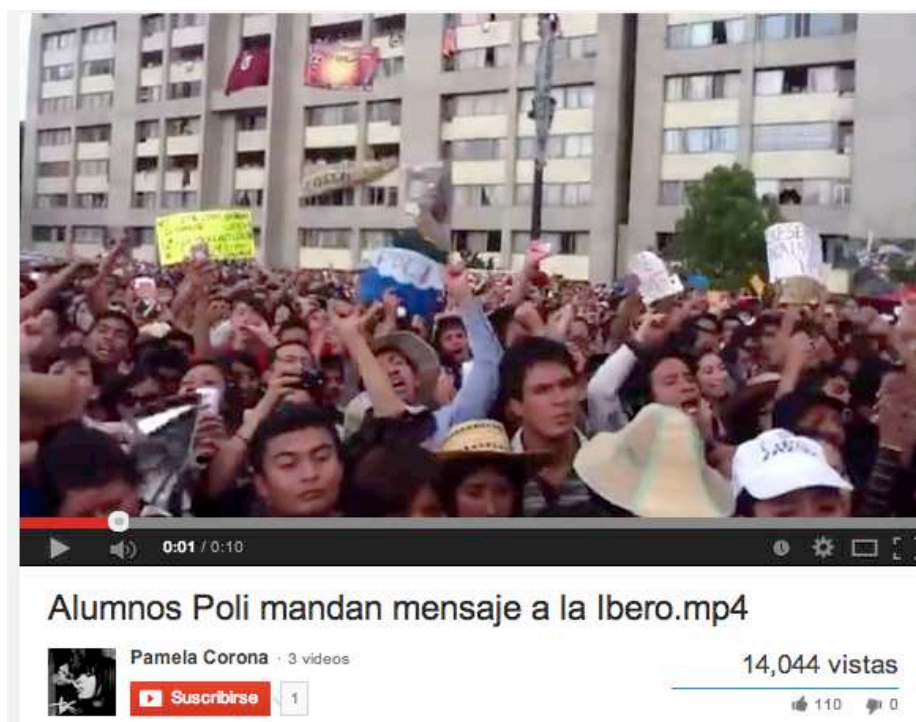
Imagen 4. Obtenida como captura de pantalla de YouTube, mayo de 2014.

Habían pasado doce días de la protesta contra Peña Nieto en la UIA en 2012, cuando estudiantes del Poli alzan en conjunto el puño y brazo izquierdo para corear efusivamente “Ibero aguanta, el poli se levanta”.