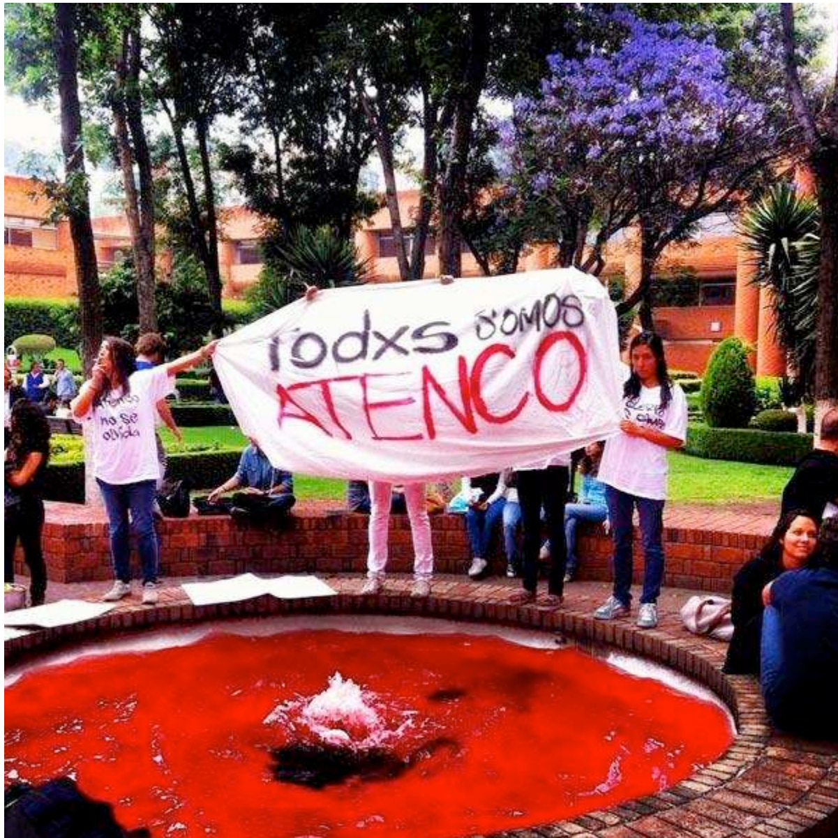
Imagen 5

hicieron que las estudiantes hicieran uso de su voz una vez más. Eran 4 mujeres que recuperaban otras luchas, las abrazaban y colgaron una manta con la leyenda “Todxs somos Atenco”.