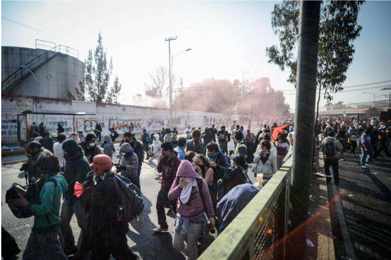
Imagen 9, “1 de diciembre, 63”