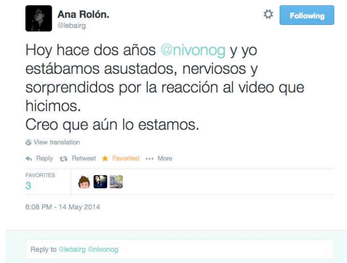
Imagen 11, Captura de pantalla en Twitter 14/05/14