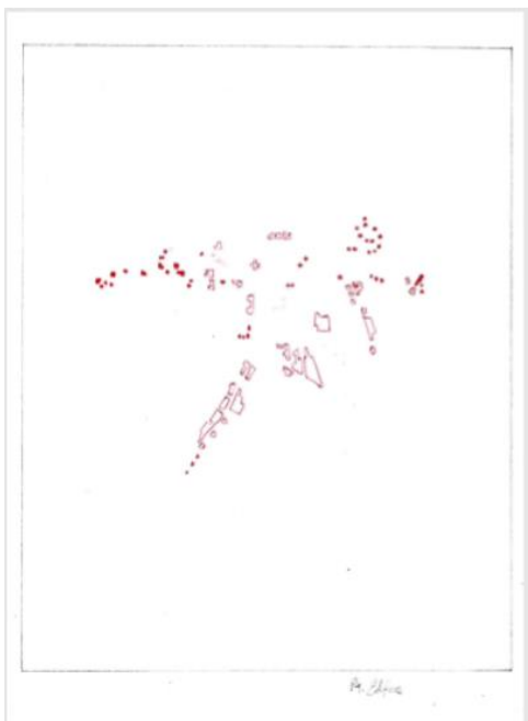
Plano 4. Edificios