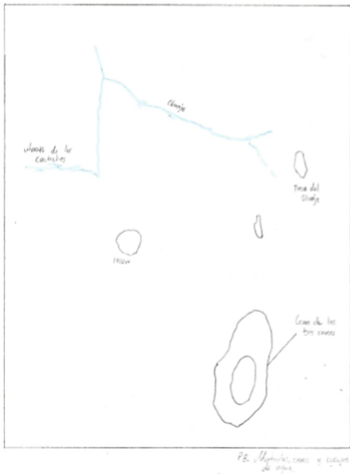
—Plano 2. Montículos, cerros y cuerpos de agua—