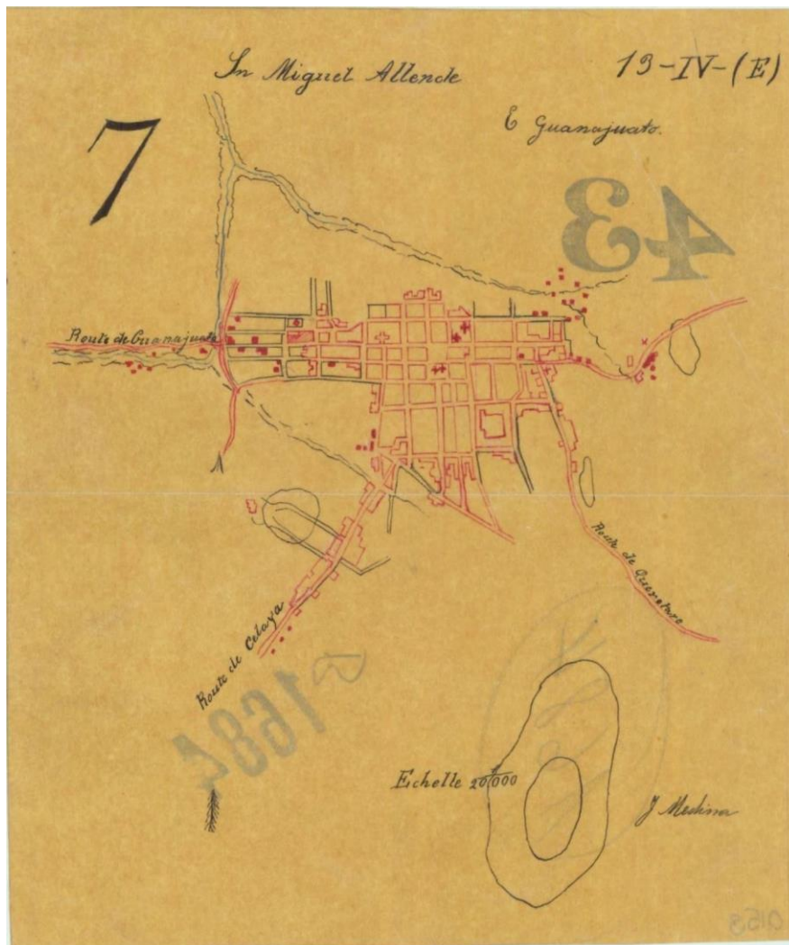
Plano 1. Plano original, San Miguel de Allende siglo XX