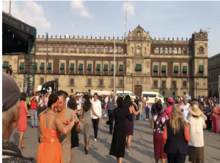
Foto 1. Gente bailando danzón un sábado por la tarde en la plancha del zócalo de la CDMX, febrero 2020.

La imagen II (la imagen de arriba) presenta el cartel que se publicaba en las redes sociales del Gobierno de la Ciudad de México para invitar a las personas a bailar danzón los días sábados en un horario de 15:00 a 17:00 horas en la plancha del zócalo de la Ciudad de México.