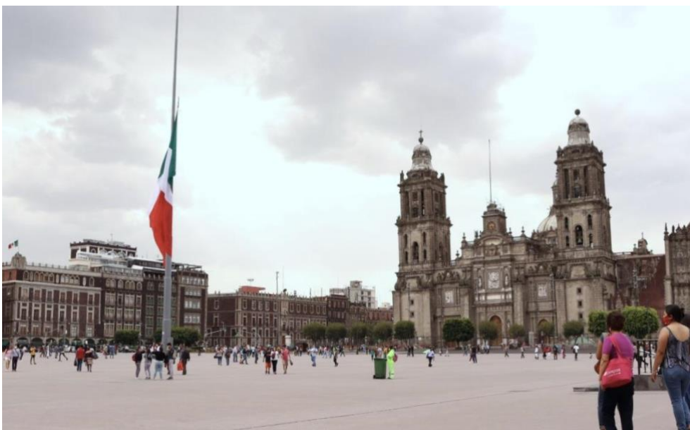
Foto 10. Plancha del Zócalo durante la Pandemia de Covid-19 sin personas de la tercera edad bailando danzón, julio 2020.