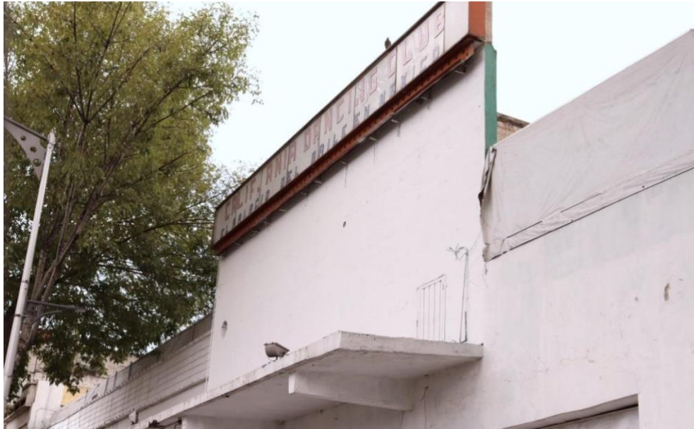
Foto 12. Entrada del Salón California Dancing Club durante la pandemia por Covid-19 en la Ciudad de México, julio 2020.