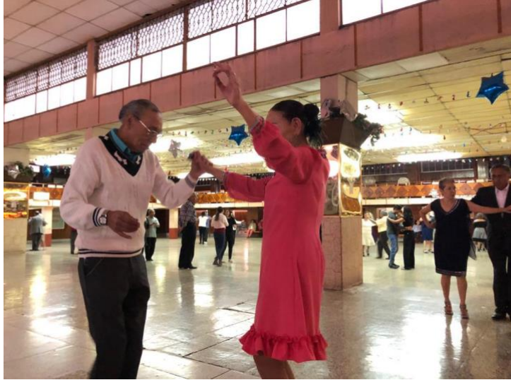
Foto 4. Pareja bailando un danzón en el salón de baile “California Dancing Club un viernes por la tarde, enero 2020.

La foto 3 (en la parte de arriba) presenta los horarios del salón California Dancing Club, este cartel se encuentra pegado a un costado de la puerta del salón, aquí podemos ver que abren de viernes a lunes, y que los domingos son exclusivamente al género grupero.