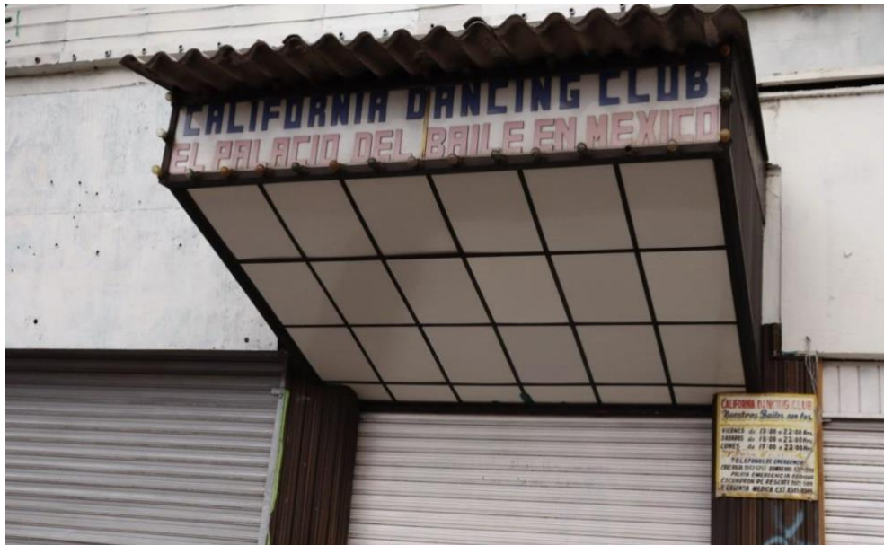
Foto 11. Entrada del California Dancing Club cerrado por la emergencia sanitaria de Covid-19 en la Ciudad de México, alcaldía Tlalpan, julio 2020.

De esta manera podemos ver cuales son los lugares más significativos para bailar danzón en la Ciudad de México algunos de ellos plazas públicas y otros son salones de baile como, por ejemplo, la plaza del danzón la cual se encuentra en La Ciudadela, la Alameda del Sur, la plancha del Zócalo de la Ciudad, el Salón de Baile California Dancing Club y el más antiguo de ellos, el Salón Los Angeles, a lo largo de este apartado pudimos ver por medio de fotografías como la gente se reunía a bailar los viernes y sábados por la tarde-noche y después vimos un salto de cómo algunos de estos mismos lugares se vieron afectados en su totalidad por culpa de la emergencia sanitaria por esta razón es que se encuentran o vacíos o sin ninguna persona bailando a su alrededor.