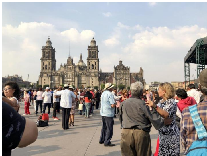
Foto 2 Catedral metropolitana de la Ciudad de México y gente bailando danzón en la plancha del zócalo de la CDMX, febrero 2020.