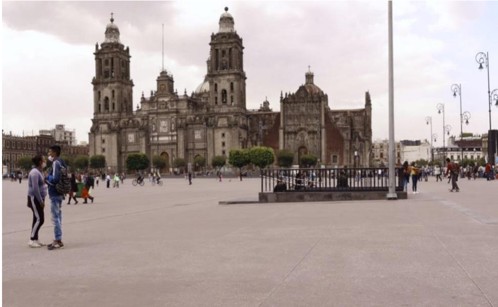
Foto 9. Zócalo de la Ciudad de México sin kiosco en temporada de pandemia por Covid-19, julio 2020.