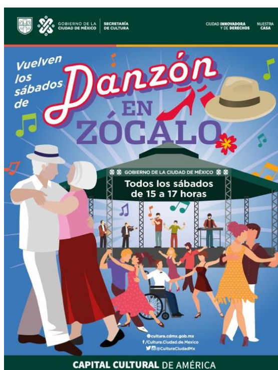
Cartel del evento “Danzón en el zócalo”