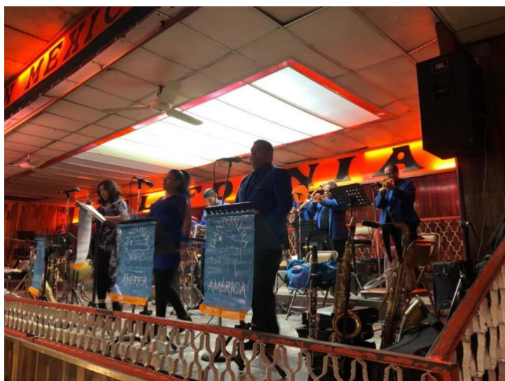
Foto 5. Danzonera tocando en vivo en el salón de baile California Dancing Club un viernes por la tarde, enero 2020.