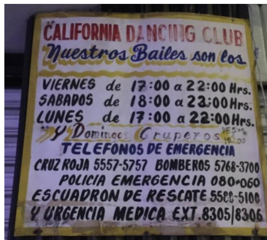
Foto 3. Horarios del salón de baile “California Dancing Club”, febrero 2020.