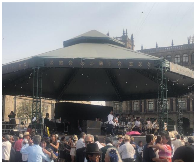
Foto 8. Danzonera tocando en vivo en el Zócalo de la Ciudad de México, febrero 2020.

En el transcurso de la pandemia por covid-19 las actividades en la Ciudad de México tanto al aire libre como en lugares cerrados se vieron pausadas para evitar grandes aglomeraciones de gente y así evitar que el virus se propague entre la gente que asiste, de esta manera es que en la plancha del Zócalo de la ciudad se retiró el kiosco donde se juntaba la gente anteriormente a bailar los días sábados, las puertas de los salones de baile, como lo son el California Dancing Club y el salón Los Angeles se encuentran cerradas hasta nuevo aviso y las plazas públicas como el jardín Morelos ubicado en La Ciudadela y la Alameda del Sur ambos cuentan con las actividades recreativas suspendidas hasta nuevo aviso.