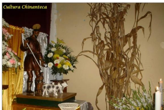
3Del Facebook Cultura Chinanteca

Es por esto que, a él se le tienen que pedir las buenas cosechas, las condiciones climatológicas favorables para sus campos de cultivo, orar por la salud de los habitantes originarios que se encuentren en otros lugares trabajando y así como agradecer por el bienestar de los pobladores en general. Estas prácticas se pueden ver en cualquier época del año; pero en estos días de festividad (13,14,15 y 16 de mayo) es cuando se puede ver la máxima expresión de este ritual.