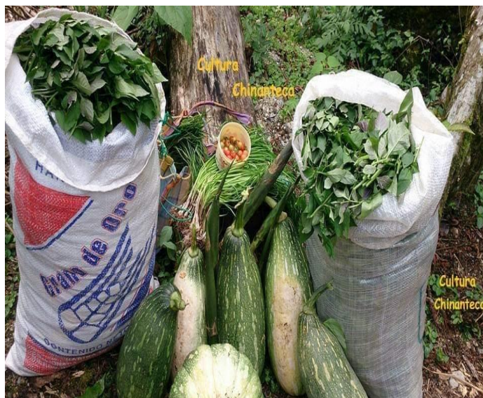
2Del Facebook Cultura Chinanteco

animales de granja sean cuidados y bien alimentados al igual que lo que se siembra debe estar en buen estado y con una serie de cuidados básicos.