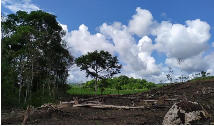
5 Comunidad de San Isidro Arenal

El pueblo de San Isidro Arenal.