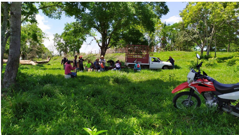
11 Junta comunal en tiempos de covid-19 (menor asistencia)