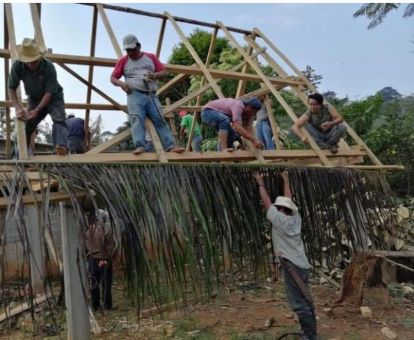
6 Tequio en San Isidro Arenal