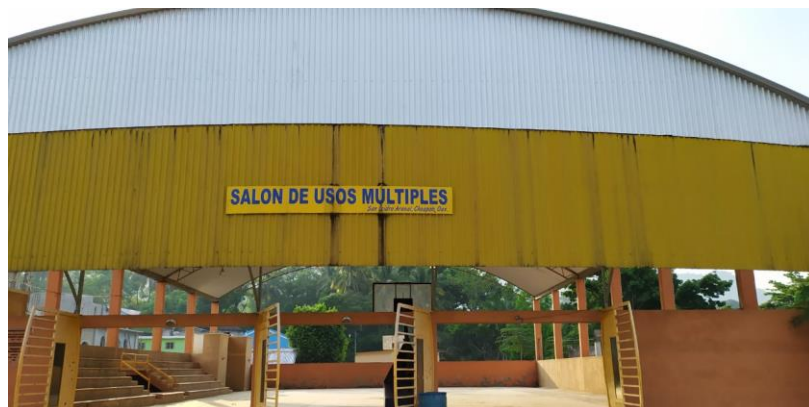
8 Salon de usos multiples