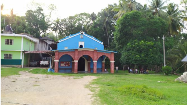
10 Fachada de la parroquia