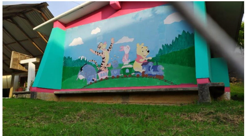
7 Jardín de niños