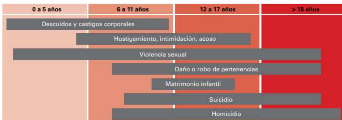
Cuadro 1. Violencia de la que son víctimas los niños

Fuente: adaptación de UNICEF (2017b, p. 9) * UNICEF. (2017b). Preventing and Responding to Violence Against Children and Adolescents. Theory of Change. Nueva York: Child Protection Section, UNICEF/ recuperado de UNICEF.