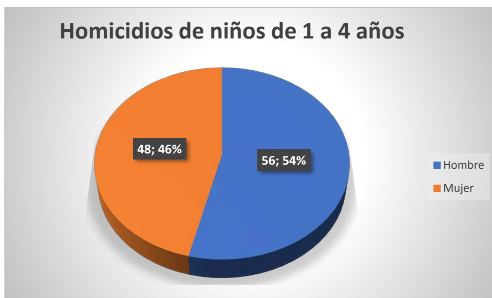
Gráfica 2. Homicidios de niños de 1 a 4 años de edad.