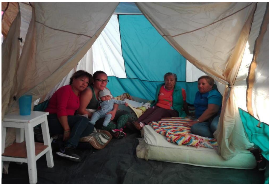
Figura 5. Improvisación de la vivienda. Elaboración Pacheco P.