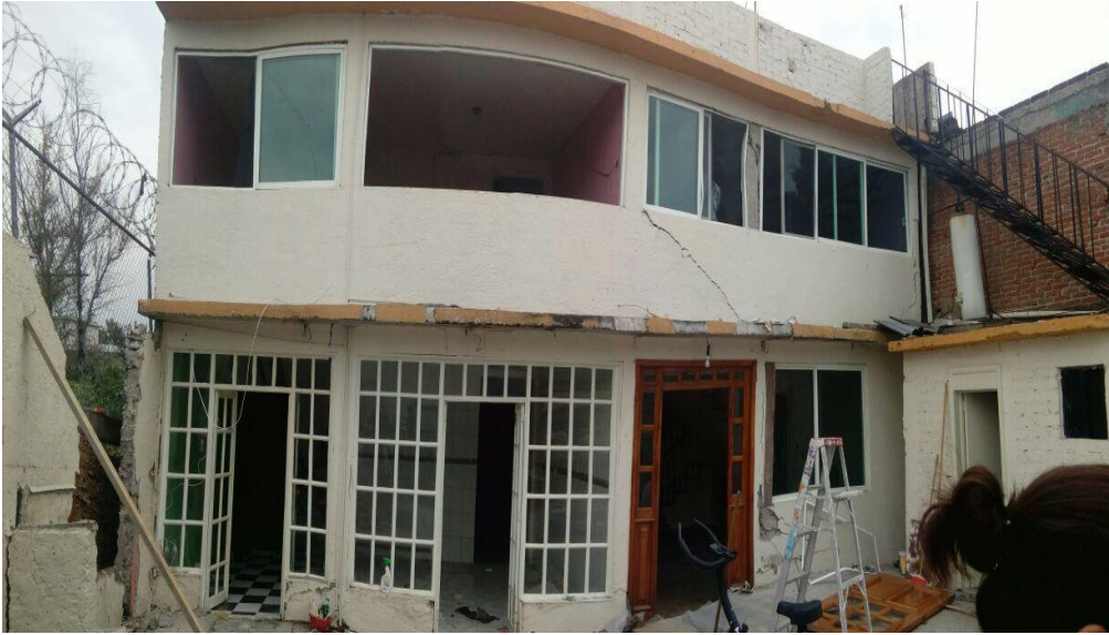
Figura 1. Casa afectada por el sismo del 19 de Septiembre de 2017. Colonia del Mar, Tláhuac. Elaboración Pacheco P.