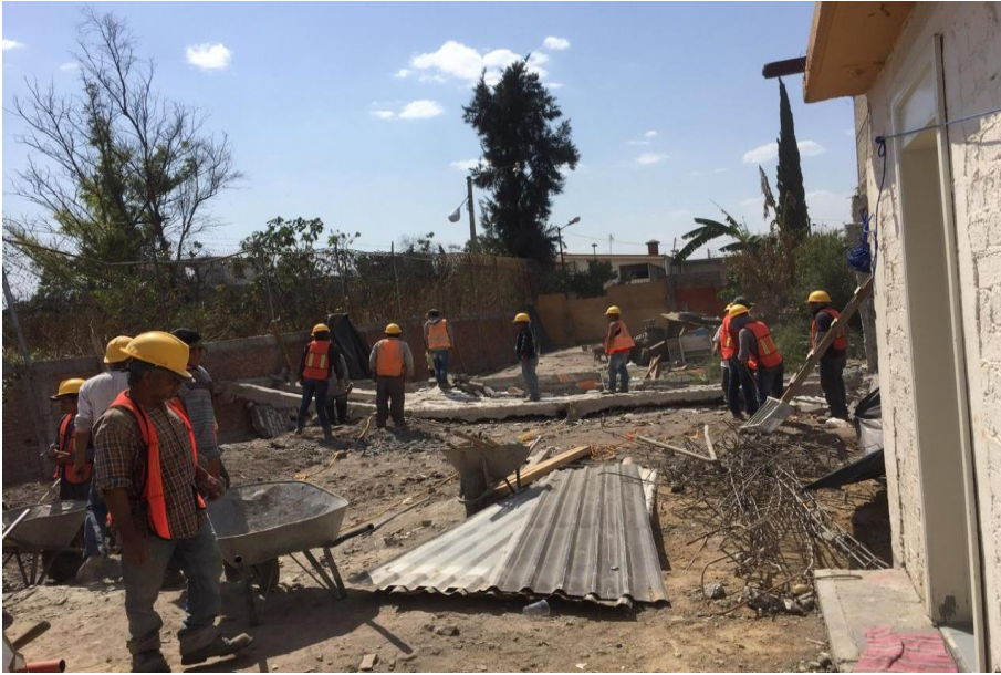
Figura 9. Limpieza del terreno. Elaboración Pacheco P.