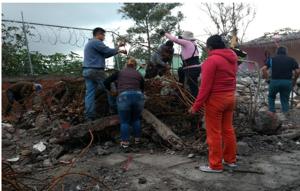
Figura 6. Remover escombros. Elaboración Pacheco P.