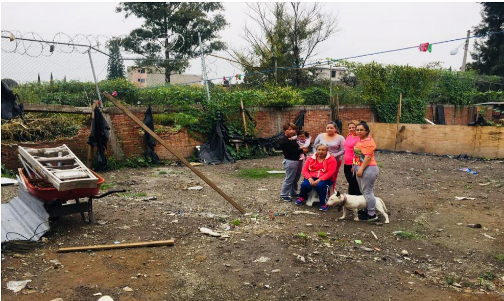
Figura 10. Terreno de la vivienda. Elaboración Pacheco P.