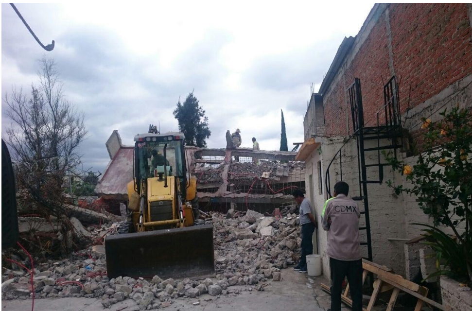
Figura 8. Maquinaria utilizada para quitar escombros. Elaboración Pacheco P.