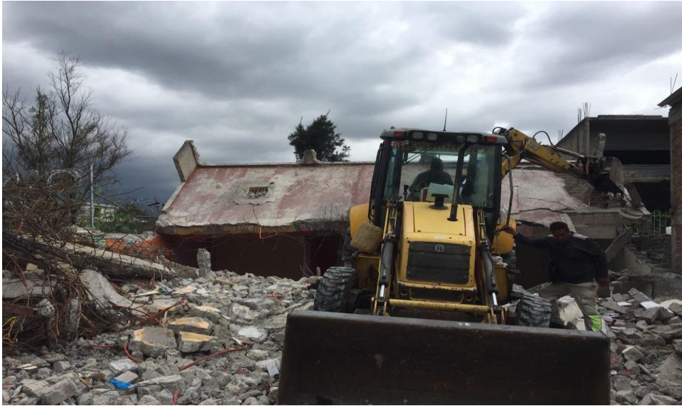
Figura 7. Remover escombros, casa en la Colonia del Mar, Tláhuac. Elaboración Pacheco P.