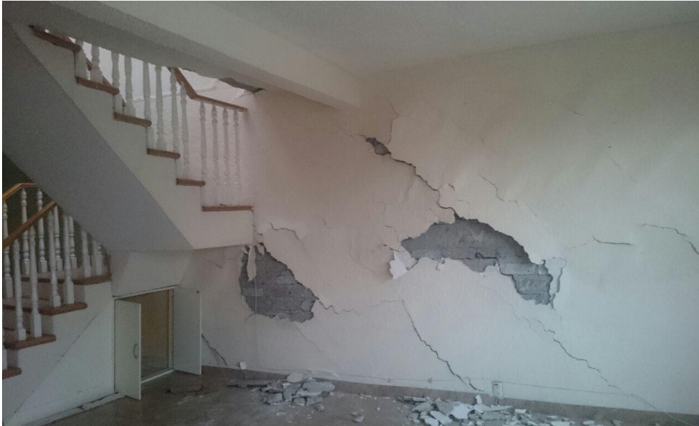
Figura 3. Grietas dentro de la casa. Colonia del Mar, Tláhuac. Elaboración Pacheco P.