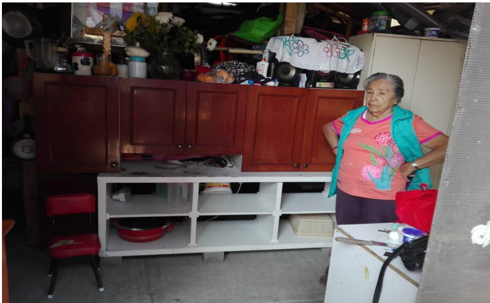
Figura 2. Afectada por el sismo en la Colonia del Mar, Tláhuac. Elaboración Pacheco P.