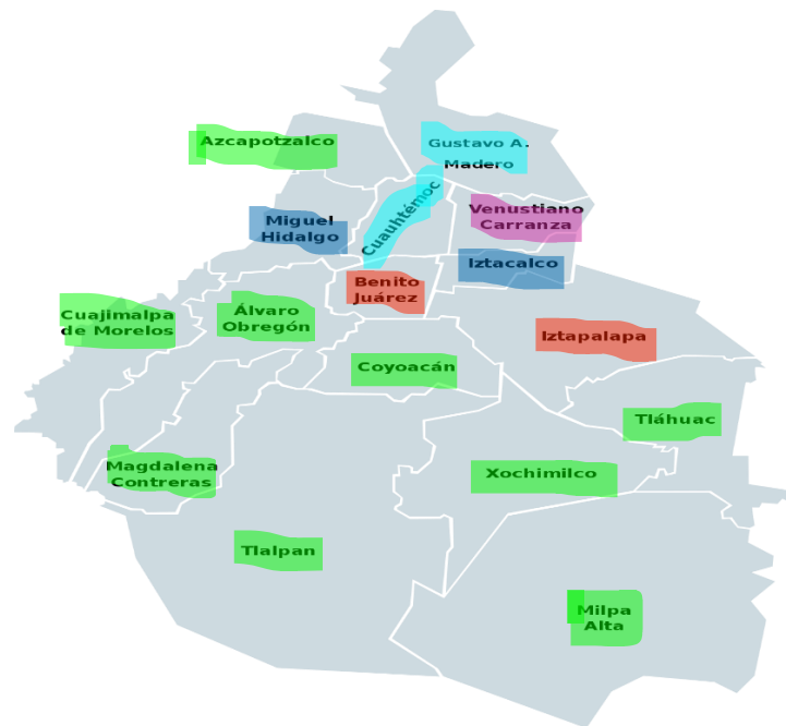
MAPA 3.1: División Política de la Ciudad de México 40

A continuación, se presentará un mapa de la división política de la Ciudad de México, con el objeto de que el lector, cuente con un aproximado acerca de la localización geográfica de las personas en situación de calle: