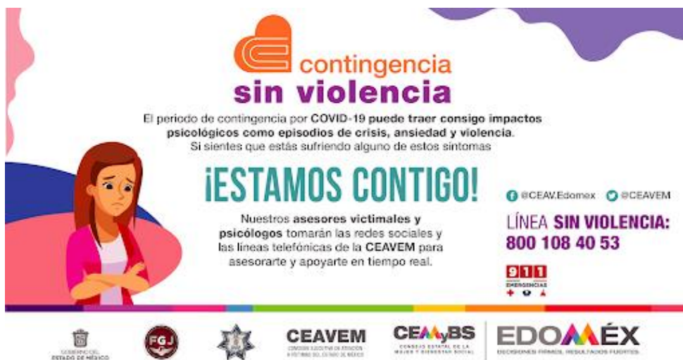
FIGURA 4. CAMPAÑA “CONTINGENCIA SIN VIOLENCIA”.

El hashtag #ContingenciaSinViolencia comenzó a dominar las redes sociales, paralelamente al movimiento en línea, el gobierno del Estado de México lanzó una campaña con el mismo nombre, lo que representa un hecho significativo dado que dicha entidad concentra el mayor número de casos de violencia de género en todo el país (Velasco, 2020).