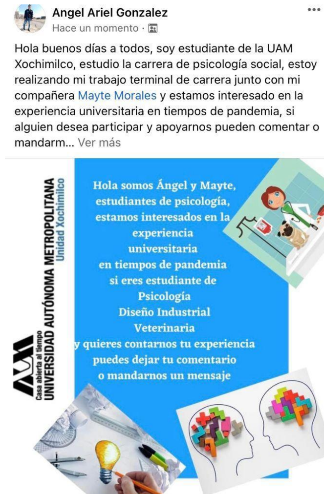
Figura 4. Publicación de facebook, invitación

Una vez que fuimos obteniendo respuesta de los alumnos decidimos realizar grupos de whatsapp para integrar a los participantes y proporcionarles el encuadre, los cuales también sirvieron para mantener una comunicación directa con todos los interesados en participar. Se dejó la publicación durante unos días y fuimos agregando a aquellos que nos contactaron a los grupos de whatsapp, teniendo como único requisito obligatorio ser estudiante de la UAM Xochimilco de alguna de las carreras ya mencionadas.