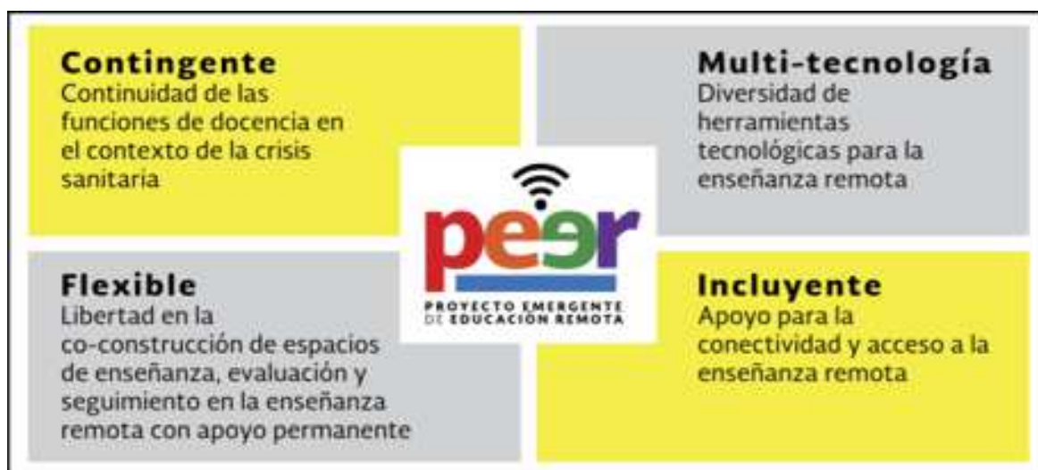
Figura 2. Proyecto Emergente de Enseñanza Remota, informe ejecutivo (s/f. p.3)

Es decir que se ha buscado procurar la formación universitaria, dando asesoría y soporte técnico sin poner en riesgo la salud de la comunidad. Es así que se crea el sitio UAM virtu@l 1 el cual ofrece información de cada unidad relacionada con el soporte técnico, a académicos y a alumnos. El cual está a cargo de especialistas en cuestiones de manejo de las tecnologías particulares de cada unidad. Es importante mencionar que, en cada unidad, hay herramientas particulares en las que se ofrece soporte especializado.