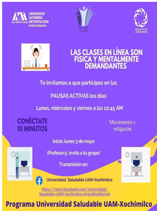
Figura 5. Publicación de la UAM

Decidimos mandarles esta imagen (Figura 5) ya que es una plática que aborda las diversas dificultades que conlleva estar dentro de las clases en línea. De este modo les enviamos esta información para que ellos conocieran parte de las estrategias de la UAM que abordan temas del agotamiento virtual.