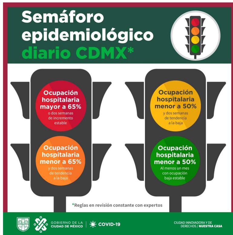
Figura 1. Semáforo epidemiológico

Dentro de las medidas sanitarias frente a la contingencia se optó por el cierre de planteles educativos de todos los niveles, desde básico hasta nivel superior. Es así que las universidades en México, públicas y privadas, han vivido la contingencia de manera transformadora puesto que, debido a la urgencia de prevención de contagios fue necesario trasladar la educación a las modalidades en línea. Nosotros como estudiantes vivimos los distintos procesos de adaptación que se implantaron en aras de la continuación de las actividades formativas. La educación remota es ejemplo de cómo las medidas sanitarias alteran los modos de vivir.