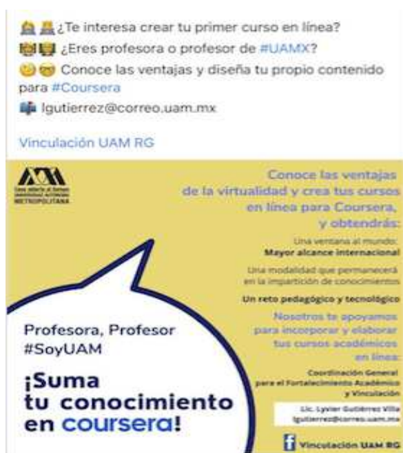
Figura 8. Cursos a profesores

Esta imagen (Figura 8) trata de los cursos a profesores para una actualización de sus clases en línea y las formas más óptimas de llevarlas a cabo en aras de un buen aprendizaje. Varios de nuestros participantes desconocían estos cursos y les alegró saber de ellos, diciendo que se los pasarían a sus profesores para que ellos pudieran tomarlos. Otros nos comentaron que les parecía una gran estrategia para que los profesores pudiesen adaptarse mejor a esta nueva modalidad.