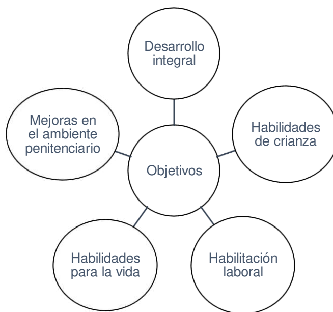
Ilustración 1. Objetivos del Modelo de atención para mujeres madres y sus hijas e hijos en contacto con el sistema penitenciario.

Elaboración propia con base en: Organización Reinserta. Reporte anual 2019. Disponible en: https://reinserta.imgix.net/pdfs/2020/02/314/reporte-anual-2019-web.pdf [Consultado el 28-07-2020]