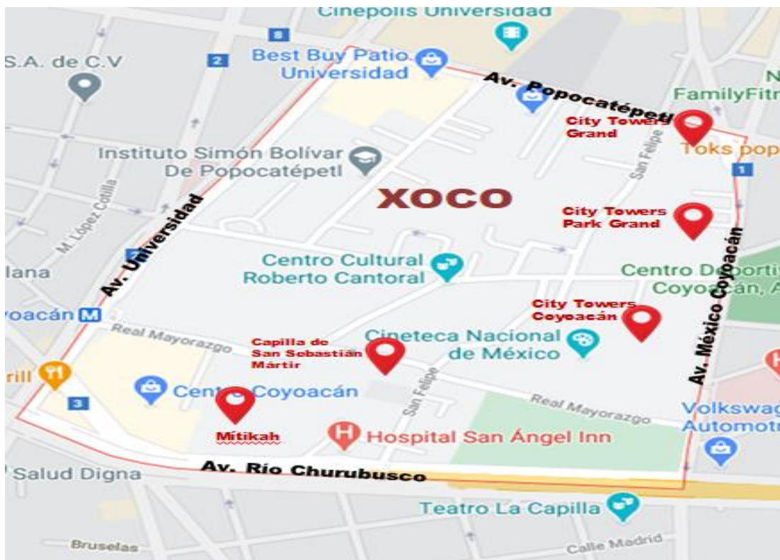
Figura 4. Mapa Xoco.

El pueblo originario de San Sebastián Xoco ubicado en la alcaldía Benito Juárez en la Ciudad de México, colinda al norte con Avenida Popocatepetl, al sur con la Avenida Río Churubusco, al este con la Calzada México-Coyoacán y al oeste con la Avenida Universidad (Figura 4). Es necesario destacar que de las alcaldías que conforman la ciudad central, Miguel Hidalgo, Cuauhtémoc, Venustiano Carranza y Benito Juárez, esta última es que cuenta con un mayor número de edificaciones. Prueba de ello es que de acuerdo con Ramírez (2019) durante 2006-2009 se edificaron alrededor de 789 unidades habitacionales en la alcaldía.