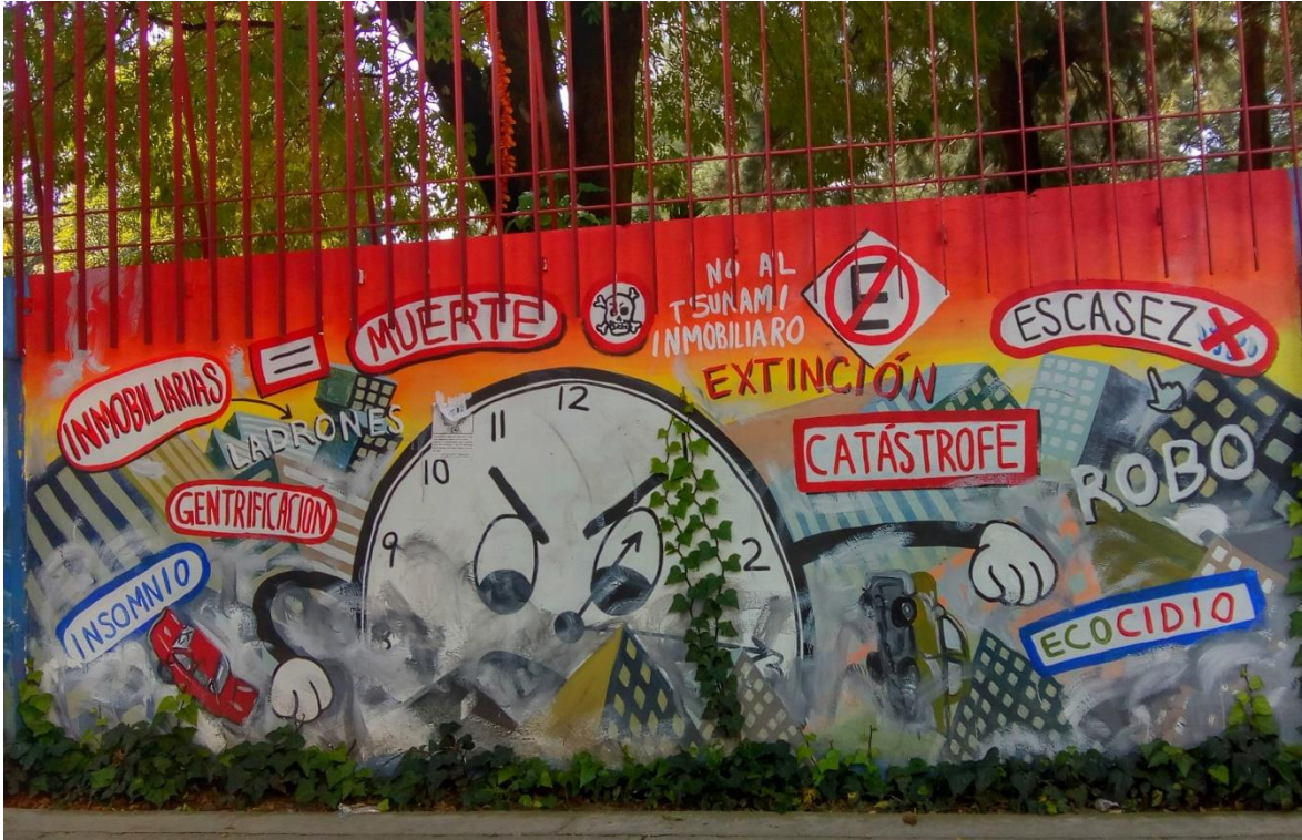
Figura 7. Murales en el pueblo de Xoco.