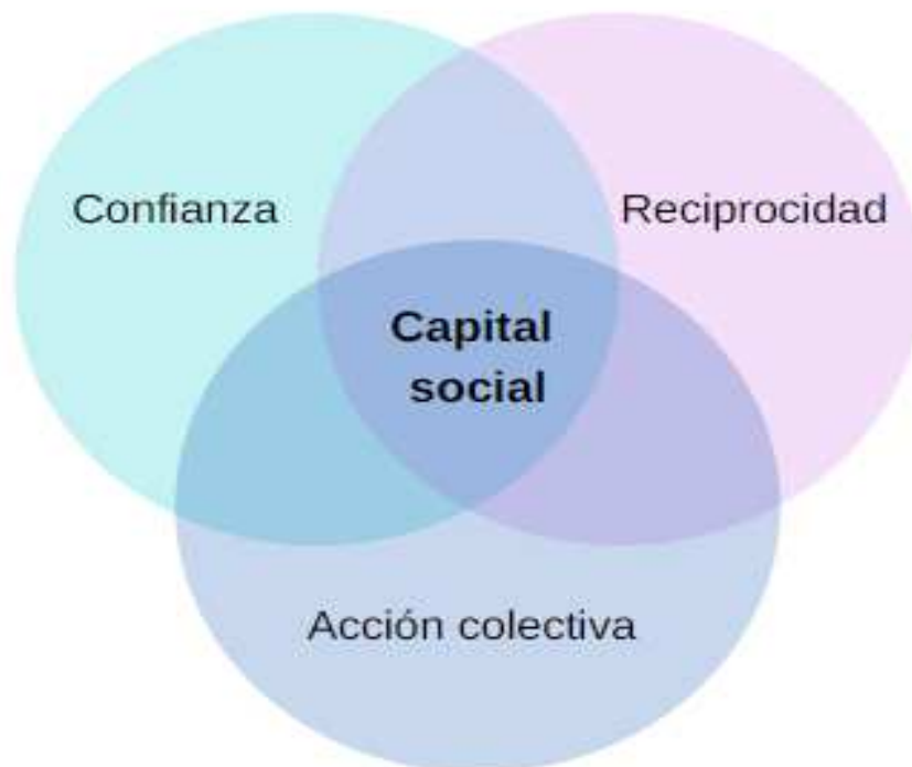
Figura 1. Capital social.

En resumen, el concepto de capital social ha sido estudiado desde diversas perspectivas, por ende se han generado posturas teoricas diferentes. No obstante, los autores previamente planteados coinciden principalmente en que el capital social se sustenta principalmente en la confianza, la reciprocidad y la acción colectiva.