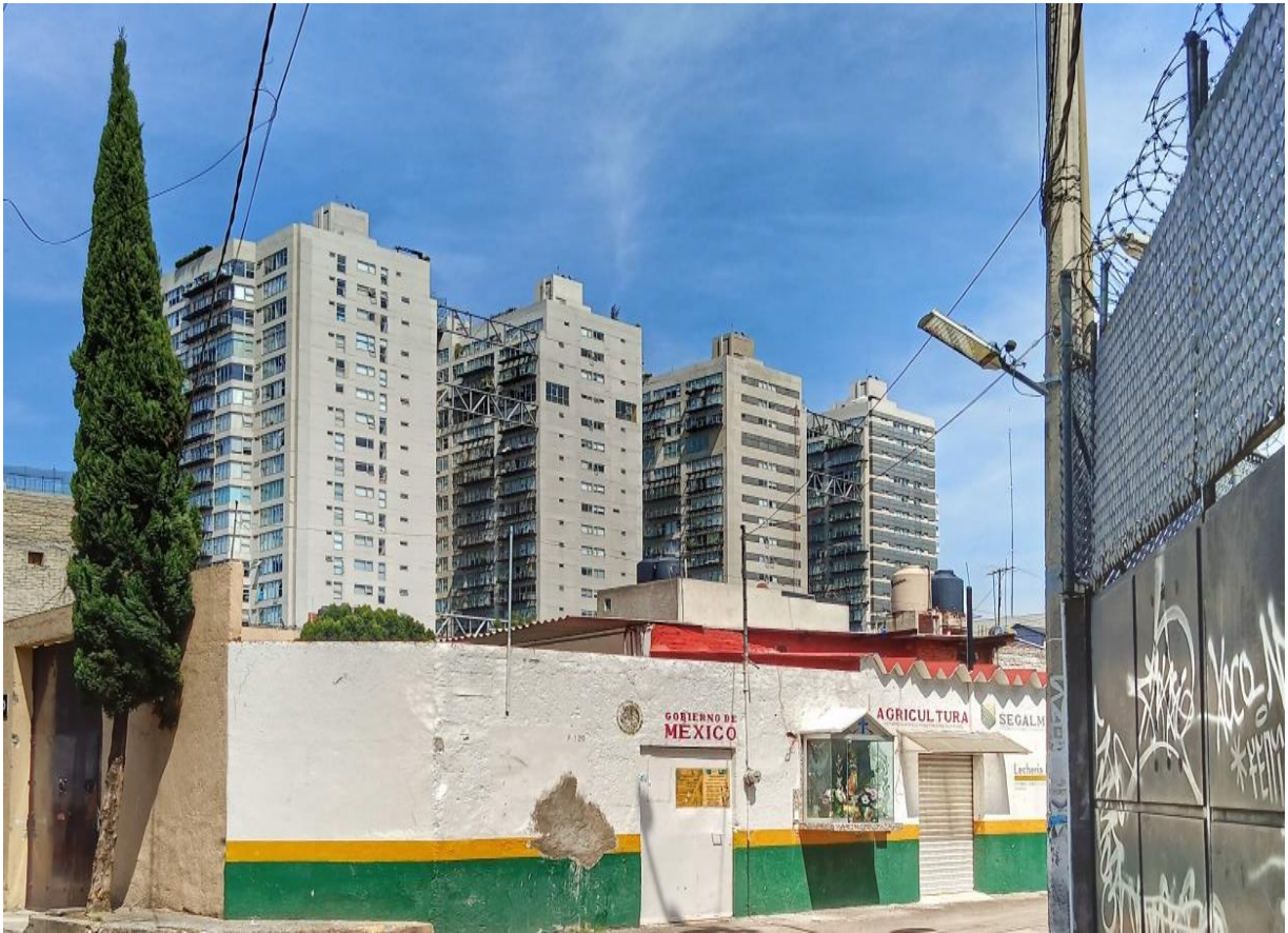
Figura 6. City Towers.