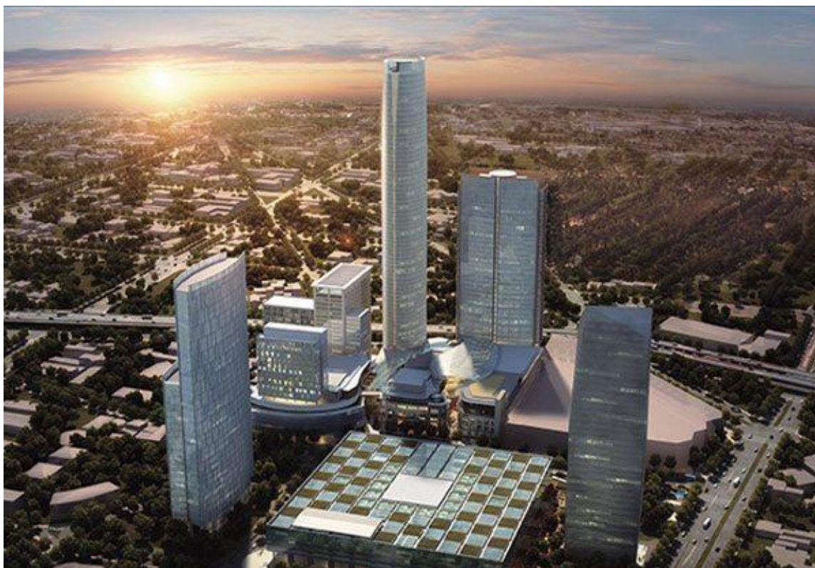
Figura 5. Mítikah proyecto concluido.

Mítikah de 64 pisos, de uso mixto oficinas y centro comercial semi abierto ocupan los primeros 20 pisos, del piso 21 al 40 son residencias, del piso 41 al 64 son pisos bajo arrendamiento para centros educativos, médicos, entre otros (Figura 5).