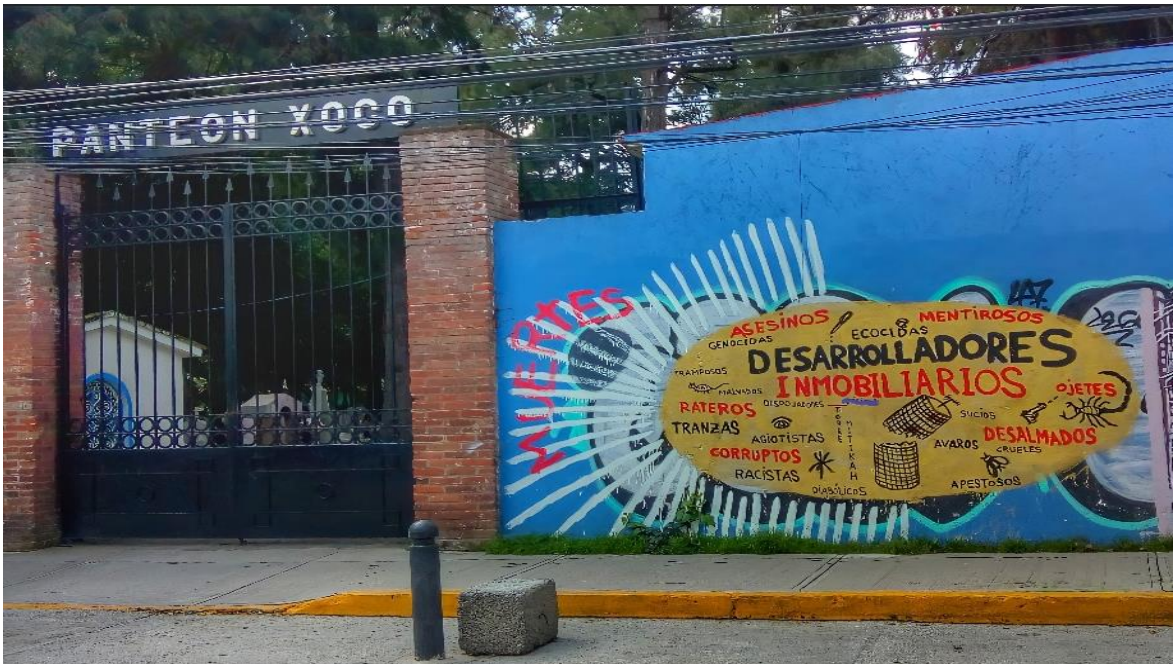
Figura 8. Murales en el pueblo de Xoco.

Algunos pobladores mostrarán nostalgia al ver que el pueblo se ha modificado a consecuencia de los desarrollos inmobiliarios. Al respecto una pobladora