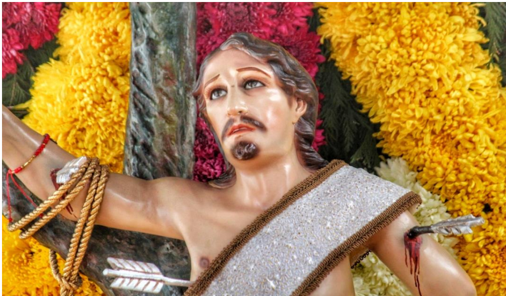
Figura 2. San Sebastián Mártir de Xoco.

Posterior a su muerte cobró fama durante la Edad Media y se extendió por toda Europa, siendo un muy venerado en España. Siendo así, como parte de los tributos después posteriores a su muerte, se le dedicaron espacios para adorarlo, tales como iglesias y capillas. Tras la caída de México-Tenochtitlan, en la Nueva España en 1663 se edificó la capilla de San Sebastián Mártir (Figura 3) en el pueblo de Xoco, la cual se aprovechó para para evangelizar al pueblo, dado que los pobladores se reunían en ella para adorarlo. (Padrón, 2015)