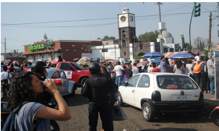
Foto 26. " Avenida Tláhuac" (Santos D, San Francisco Tlaltenco, 2018)