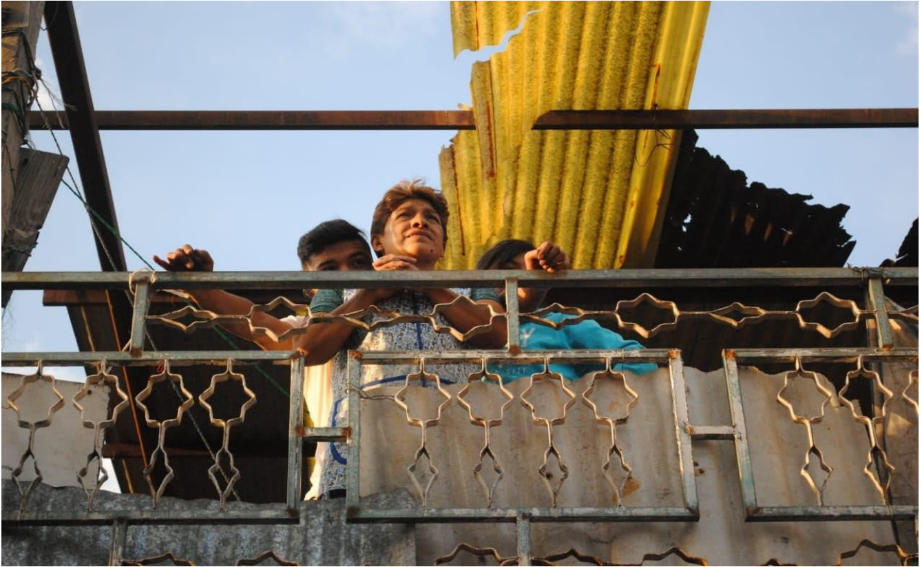
Foto 13. "Lugar para contemplar". (Santos D, San Francisco Tlaltenco 2018)