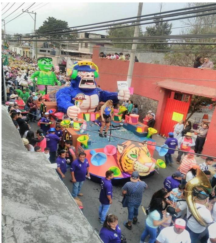
Foto17, "El carnaval acción espacio como un todo que crea la fantasía carnavalesca"(s/a, San Francisco Tlaltenco, 2020)