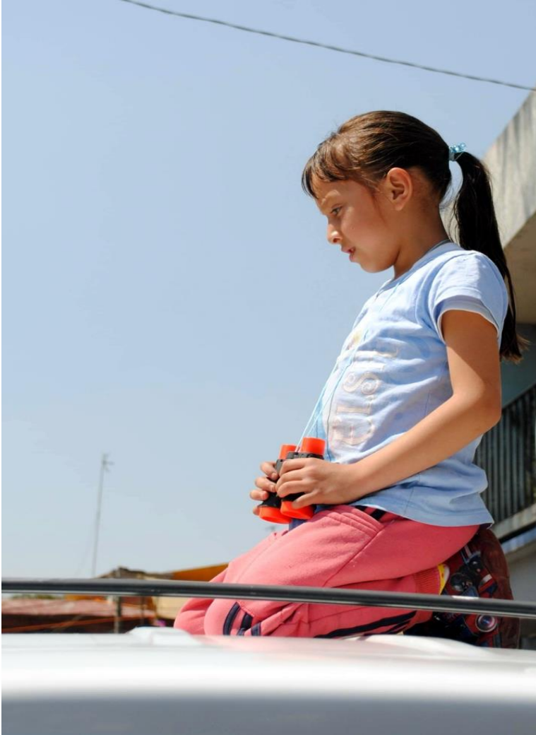
Foto 14. "Son para verte mejor". (Santos D, San Francisco Tlaltenco, 2018)