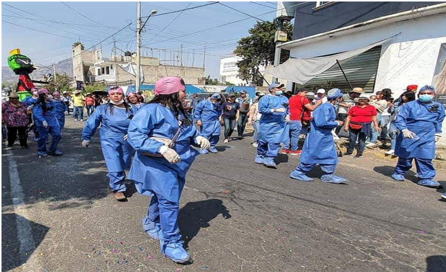
Foto 07 “Cambios de los papeles sociales de sus respectivos dominios de origen”