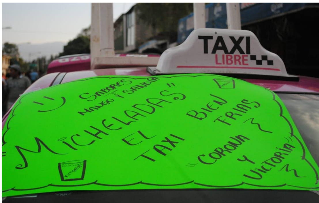
Foto 06, "Cambios de objetos de sus respectivos dominios de origen" (SantosD, San Francisco Tlaltenco, 2019)