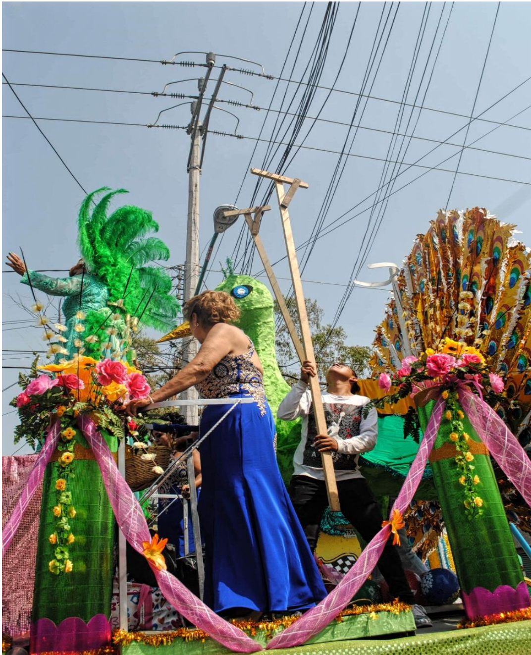
Foto 04. "El carnaval diseña un espacio social y físico diferente enfrentándose a la vida urbana en relación a conductas y objetos". (Santos D, Santiago Zapotitlán, 2018)