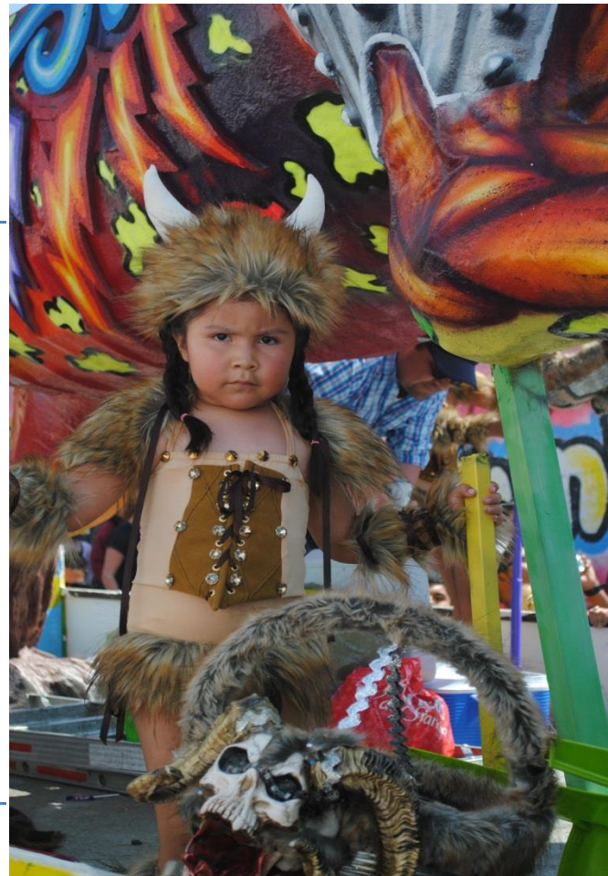
Foto 10. "Niña vikinga". (Santos D. San Francisco Tlaltenco,2019)