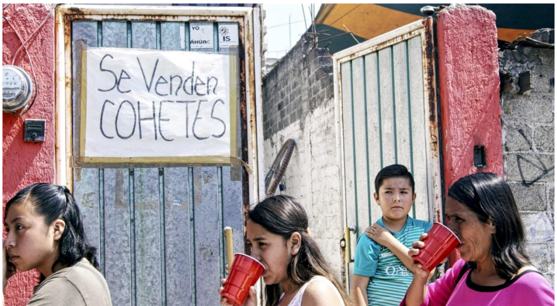
Foto 15. "Abriendo puertas y ventanas ", (Santos D, San Francisco Tlaltenco, 2018)