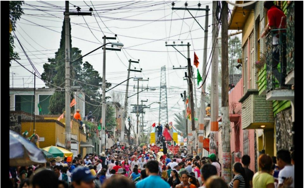
Foto 01. “El carnaval celebrara el movimiento social de los individuos y marcara transiciones de un estado de vida a otro creando su propio plano mediante el intercambio, objetos y acciones”.(s/a, San Francisco Tlaltenco, 2013)