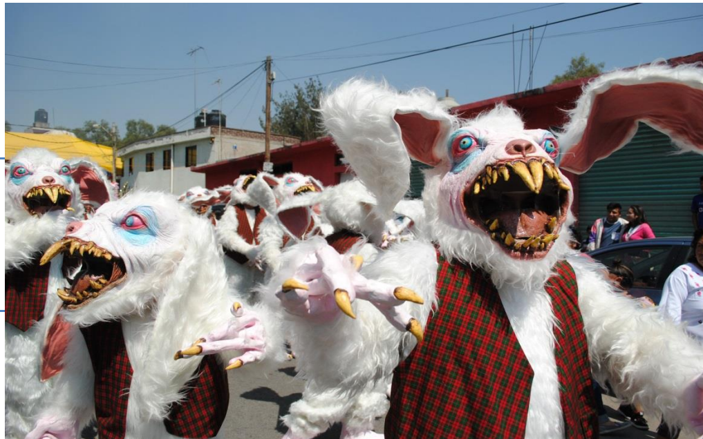
Foto 22. "Conejos Monstruo" (Santos D, San Francisco Tlaltenco, 2018)