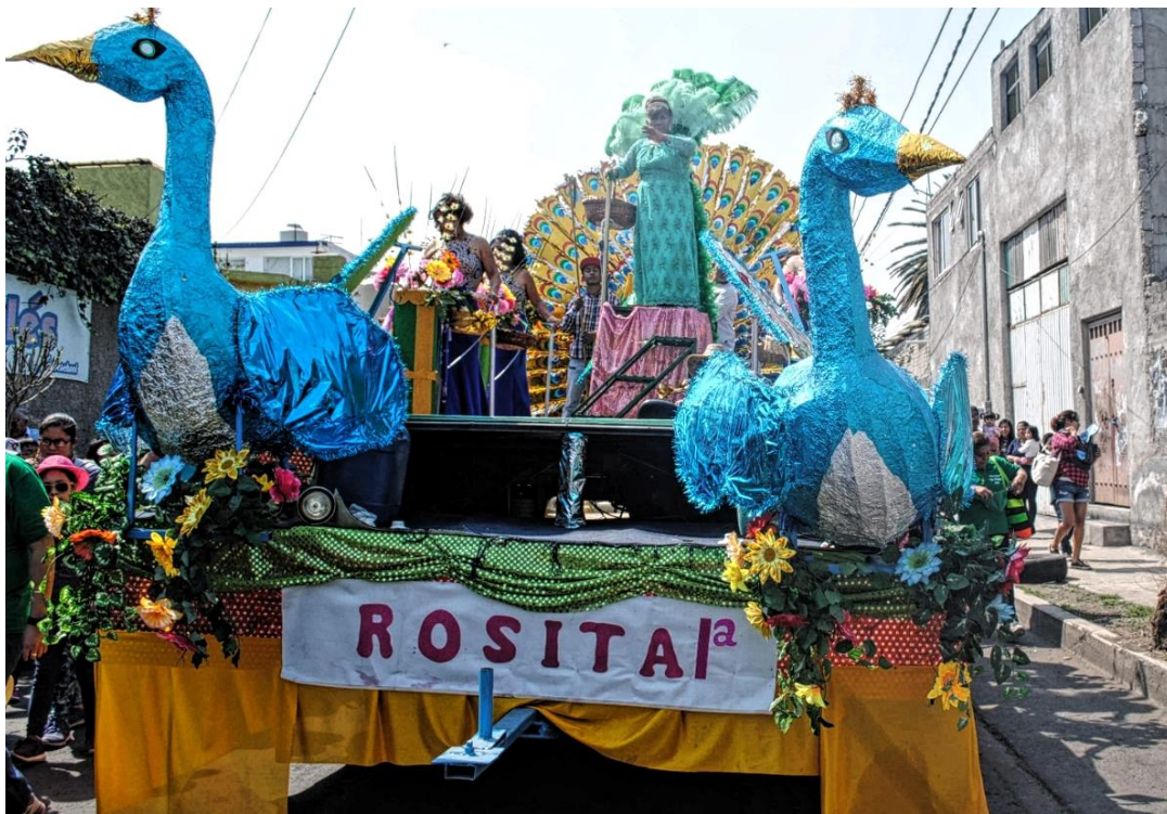
Foto 05: "La Realeza: Rosita1a y sus damas" (Santos D, Santiago Zapotitlan, 2018)