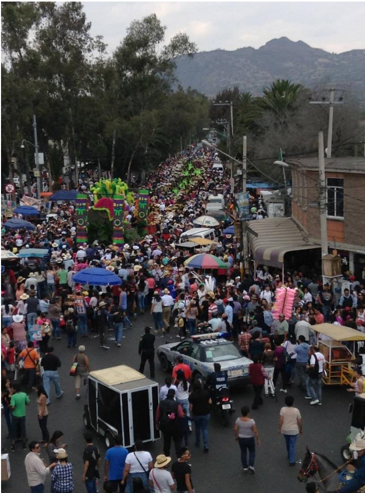
Foto 19 "Comunidad, Comunnita" (s/a, San Francisco Tlaltenco, 2020)