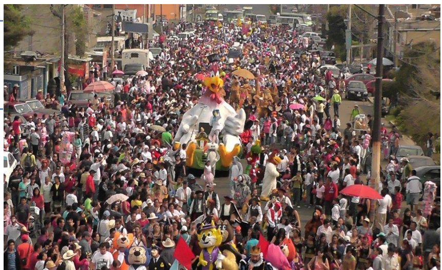
Foto 20 "Se expresa y hace uso del espacio público en permanente disputa" (s/a, San Francisco Tlaltenco, 2020)