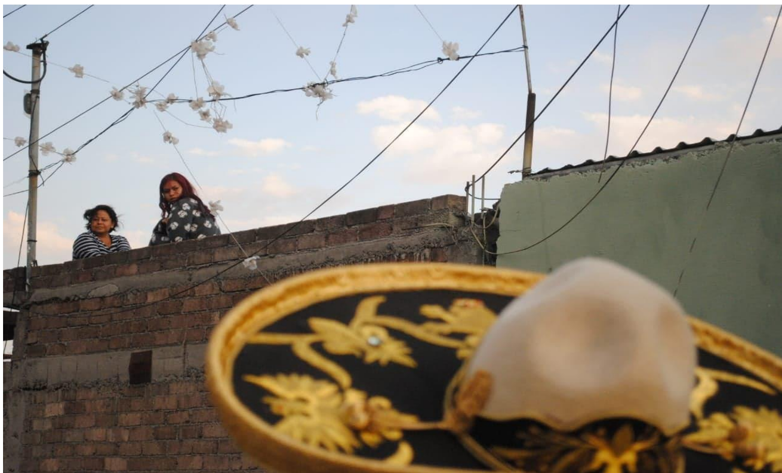
Foto 16. “vivir la fiesta franqueando el espacio público- privado como un todo en el carnaval”