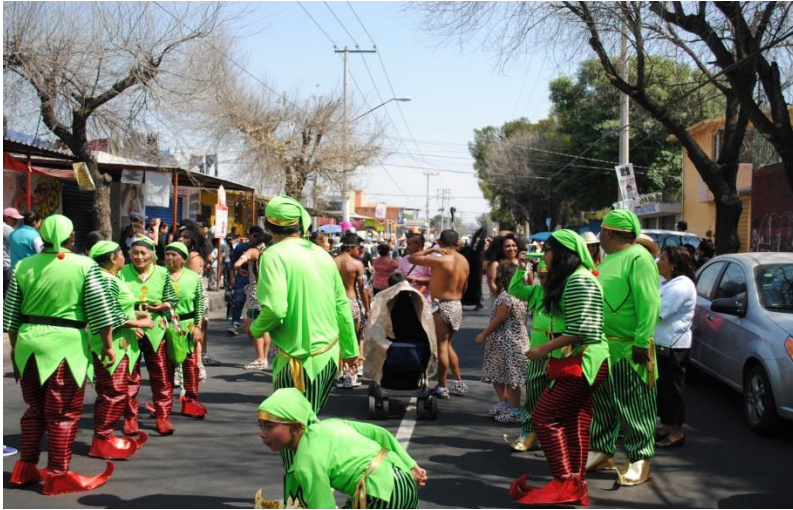
Foto 23. “Duendes y cavernícolas” (Santos D, San Francisco Tlaltenco, 2018)