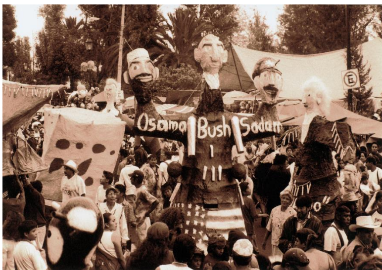
Foto 18. "En el carnaval se descubren tres aspectos de la comicidad, lo cómico bufón, lo cómico burlesco y lo cómico grotesco, considerando que lo grotesco es siempre lo satírico. Lo bufón simplemente produce la risa espontanea, sin dificultad, sin esfuerzo y convoca a las masas. Mientras que lo burlesco produce la risa en el público cuando se tiene antecedentes que se implica en el acto. Lo grotesco, en cambio, es un elemento que considera elementos del contexto histórico, porque siempre es satírico y solo se exagera lo que nunca debía existir.

El humor carnavalesco es un humor festivo que pertenece al patrimonio del pueblo, porque durante su celebración todos ríen, es una risa generalizada y universal. "(Foto y cita de Villarruel Bulmaro )