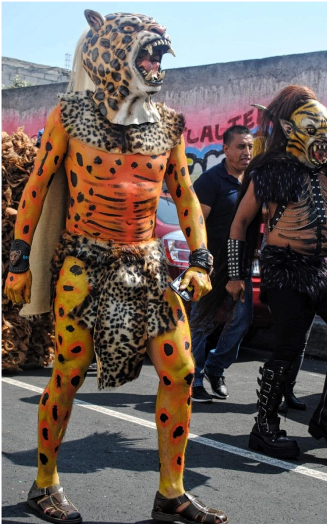
Foto2. "Hombre jaguar, monstruo, hombre y rotulo chilango". (Santos D, San Francisco Tlaltenco, 2019)