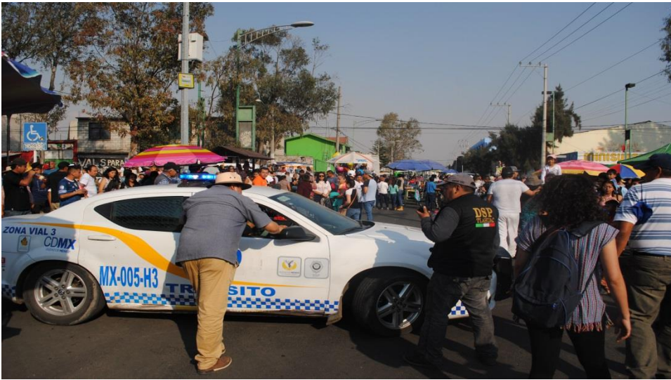
Foto 26. “Comprender lo que hacen en tanto lo hacen”. (D, San Francisco Tlaltenco, 2018)