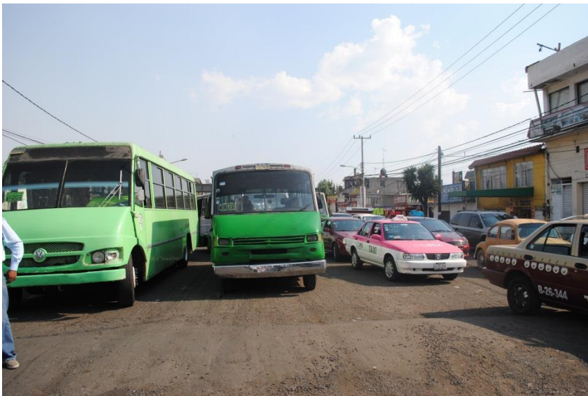
Foto 24. “El tiempo en la ciudad se detiene por el tiempo del carnaval”. (Santos D, San Francisco Tlaltenco, 2018)