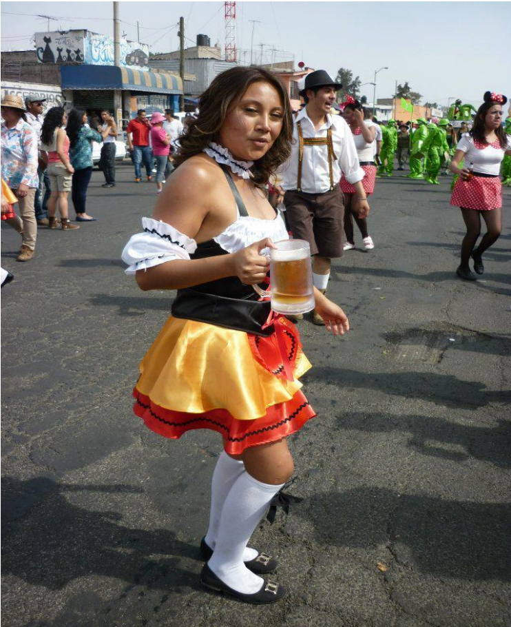
Foto25. "Cerveza Babara a la Mexicana ". (Club Juvenil, San Francisco Tlaltenco, 2013)