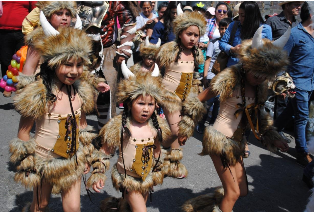
Foto21. "Niñas vikingas". (Santos D, San Francisco Tlaltenco, 2018)