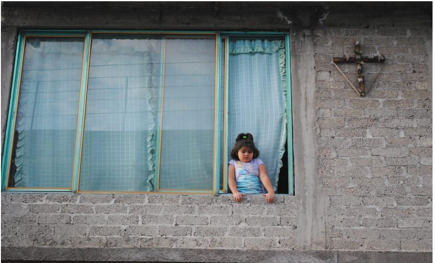
Foto 12. "Niña de Tlaltenco" (Santos D, San Francisco Tlaltenco, 2018)