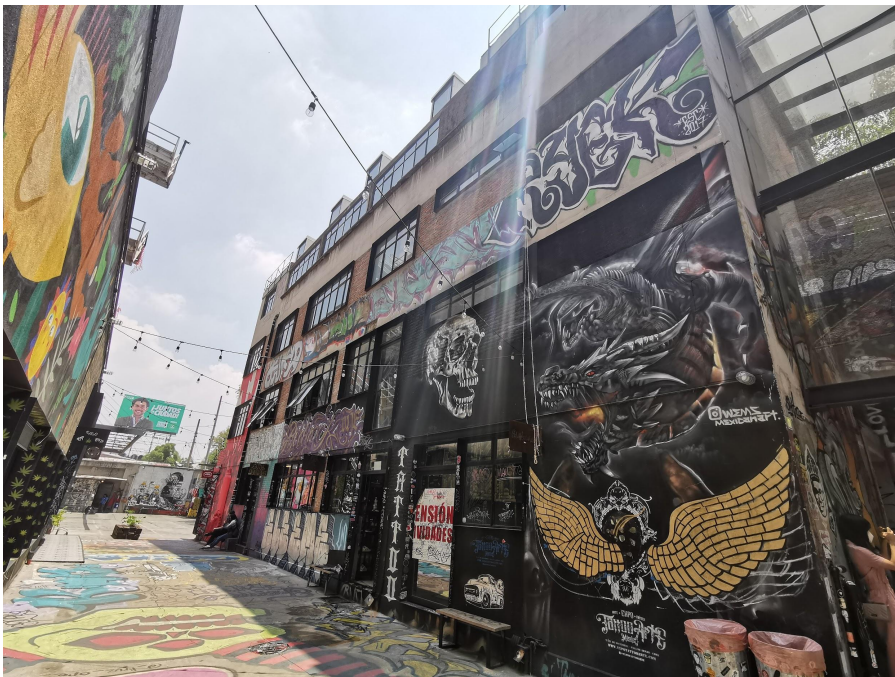
Vista desde el fondo de los locales comerciales. 15 de mayo del 2021 en Ex-Fábrica MX.

En el siguiente link se encuentra una lista reproducción en la cual se encuentran múltiples videos tomados a lo largo de 5 meses de trabajo de campo: