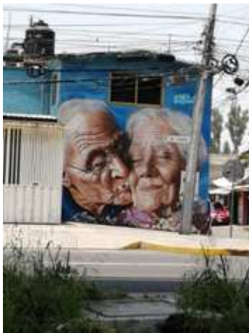
"AMOR ETERNO" duek colaboración con fresabogota Mural para un asilo en Av. Tlahuac