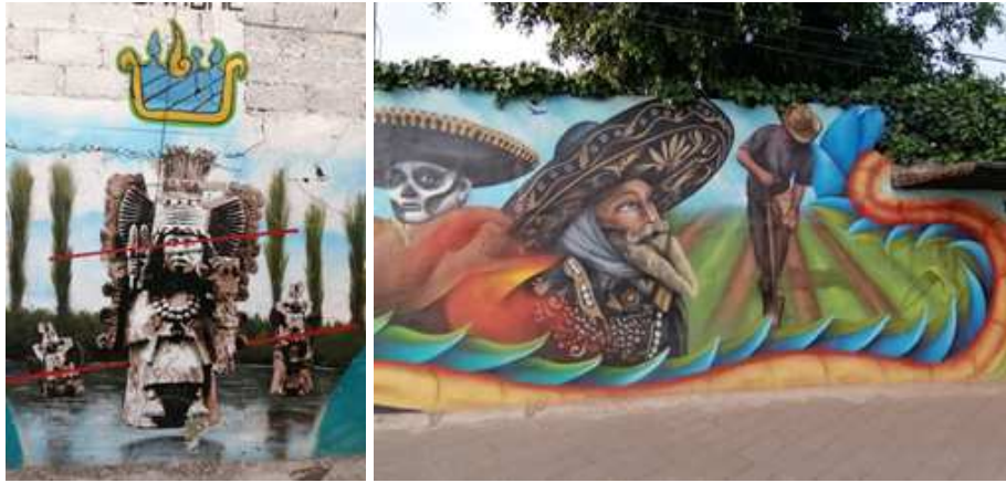
Av. San Rafael Atlixco, paraje: puente de Tlaltenco, Alcaldía Tláhuac.