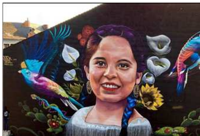
“Cualtzin talticpac” (belleza sobre la tierra),