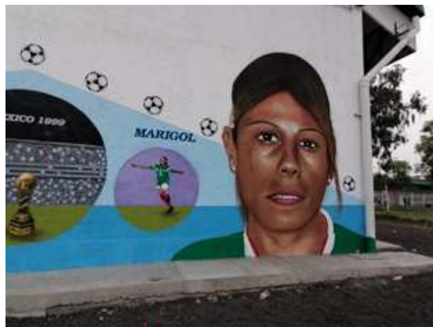
Trabajo realizado para la alcaldía de Tláhuac Mural realizado por Tania en colaboración con Zuker