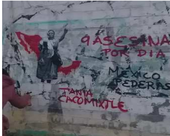
Escritora: Tania Ambas expresiones se encuentran en la Alcaldía Tláhuac, realizadas por el Colectivo Cacomixtle

Muchos escritores critican y reposicionan propuestas que entran en conflicto visual con los cánones y valores que actualmente se tienen, por ejemplo plasman modelos con características reales de la mujer mexicana que llevan a plantearse nuevas subjetividades.