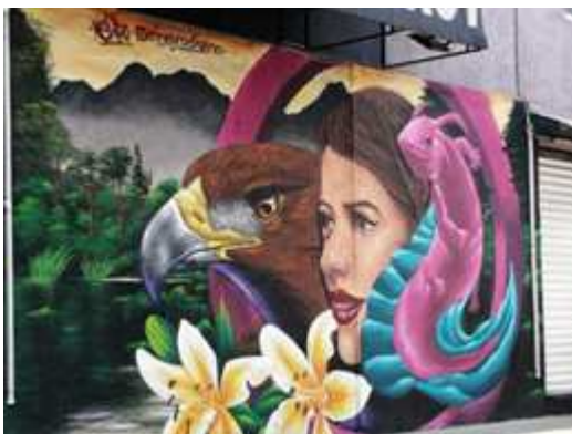
Elnegrodiseño, Alcaldía Tlahuac