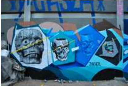
Cdmx, escritor Zuker Zuker