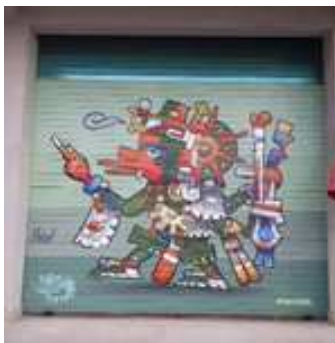
Alcaldía Magdalena Contreras Escritor: Zuker