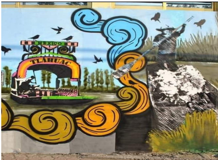
Mural por el día de los humedales en Tláhuac. Mural colectivo. Febrero, 2021