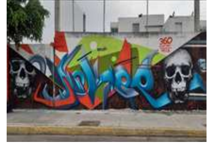
Cabeza de Juárez graffiti realizado por