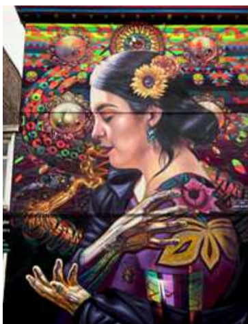
“Joyas Mexicanas” murales realizado por Duek

Muchos escritores critican y reposicionan propuestas que entran en conflicto visual con los cánones y valores que actualmente se tienen, por ejemplo plasman modelos con características reales de la mujer mexicana que llevan a plantearse nuevas subjetividades.