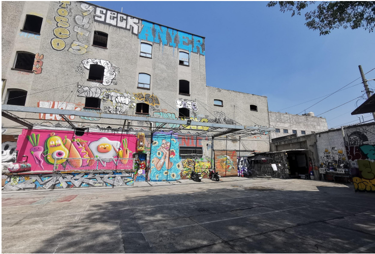
Vista lateral de la bodega principal. Foto tomada el 15 de mayo del 2021 en Ex-Fábrica MX