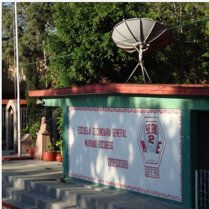
Fotografía 4. Secundaria Mariano Escobedo

La Escuela Secundaria General No 2 Mariano Escobedo está ubicada en la capital Santiago de Querétaro, Querétaro 31 . De acuerdo con el Consejo Nacional de Evaluación de la Política de Desarrollo Social (CONEVAL), el estado presenta condiciones socioeconómicas de baja marginalidad y con respecto de las 32 entidades federativas, ocupa el lugar 18 en porcentaje de población en pobreza y pobreza extrema (CONEVAL, 2012).