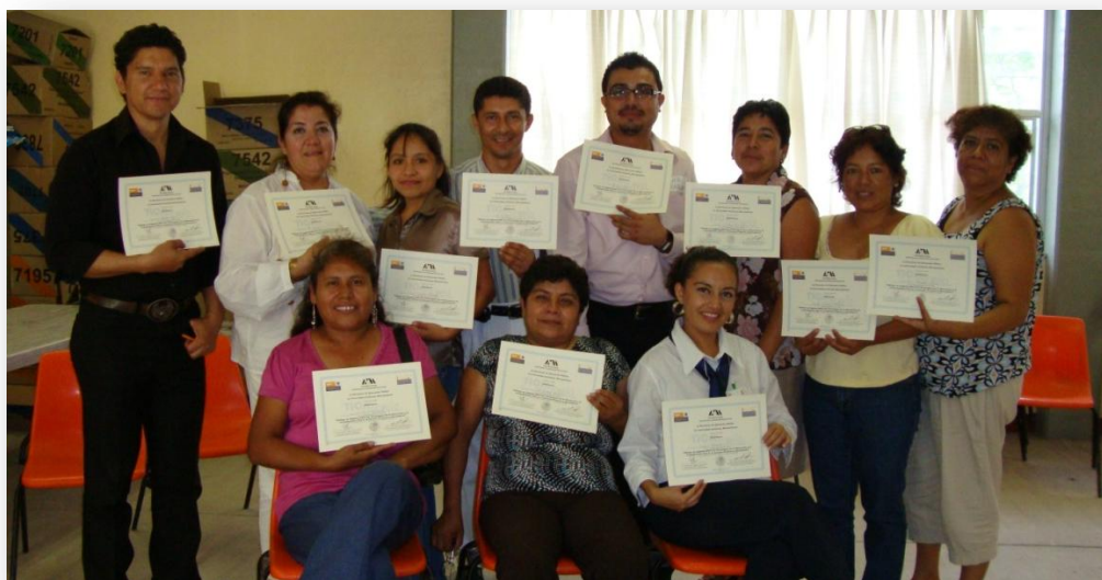
Fotografía 3. Profesores participantes de la Secundaria José Agustín.

Los profesores participantes de la Secundaria José Agustín fueron trece: once profesores de diversas materias, dos prefectos y una trabajadora social 30 . El lugar de la reunión fue una sala, y los participantes estuvieron sentados en círculo. La conversación grupal duró aproximadamente 2 horas dividida en tres partes: