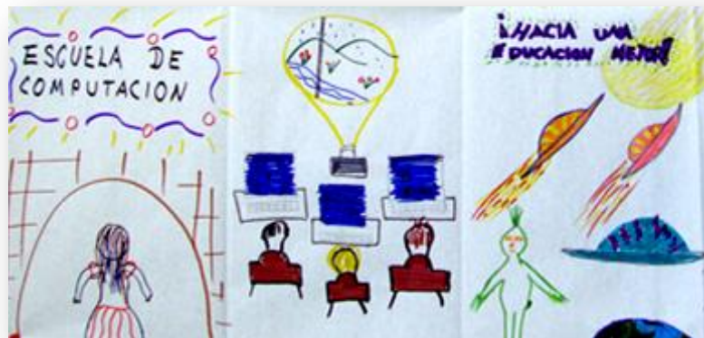
Figura 3. Fragmento de la historieta cuatro, Secundaria José Agustín.

En este discurso se sugiere la idea de tecnología como revolucionaria y promotora del cambio social, así: “habrá que adaptarse y cambiar los modos de hacer las cosas, por el ‘bien’ de los alumnos. No adaptarse implica hacerlos ineficientes en el