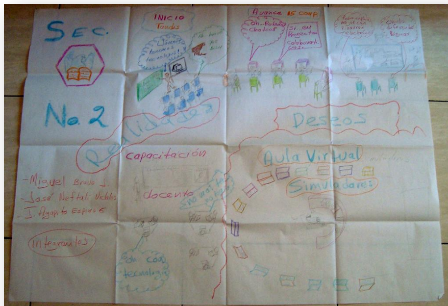
Figura 5. Historieta uno de la Secundaria Mariano Escobedo

representación de los paneles y demás, donde ellos a través de los sensores podrán representar virtualmente sucesos políticos, situaciones de problemas ecológicos, los inventos de la química, los avances científicos. Ya está todo conectado con sensores para hacer una representación, en este sentido hay una conexión con los contenidos, la información, los aprendizajes y la realidad, hay una combinación de realidad con representación. Es de manera general nuestro proyecto de historieta. (Historieta 1: Pepe, Agapito y Miguel, Qro. 2009)