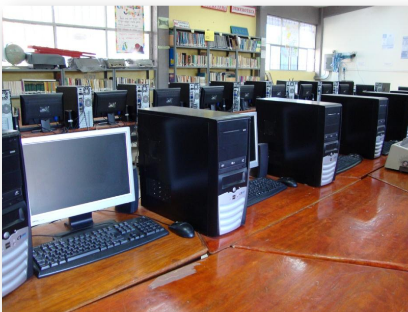
Fotografía 9. Biblioteca de la escuela Secundaria Mariano Escobedo

Constantemente están haciendo falta equipos. Aunque se han comprado bastantes, ahora se han comprado para la biblioteca 28 computadoras. (Entrevista Director Qro, 2009)