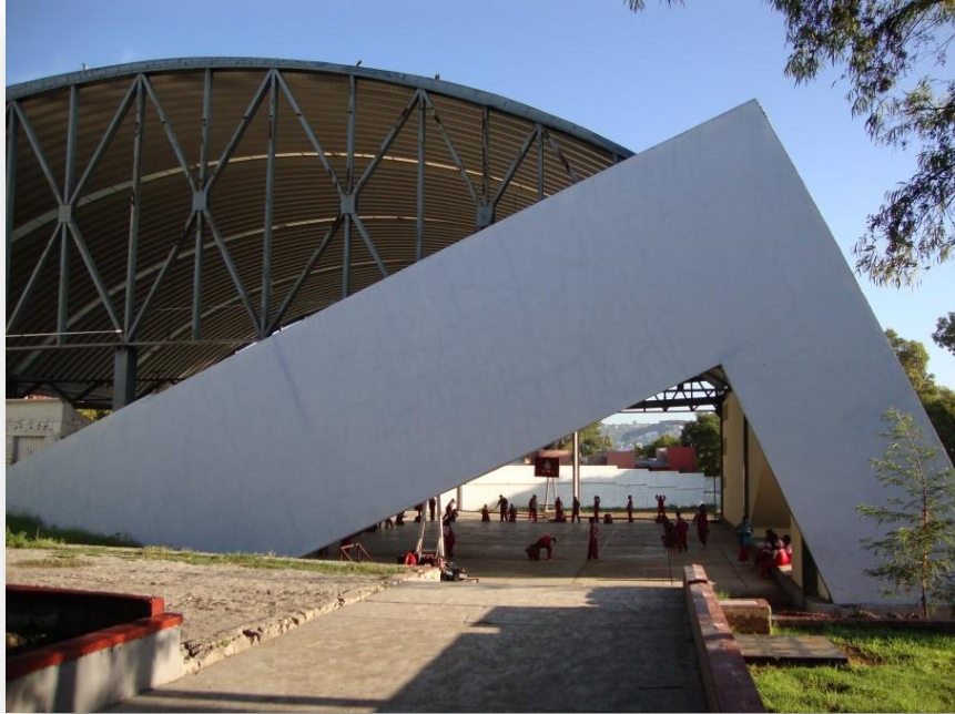
Fotografía 6. Instalaciones deportivas de la Secundaria Mariano Escobedo.