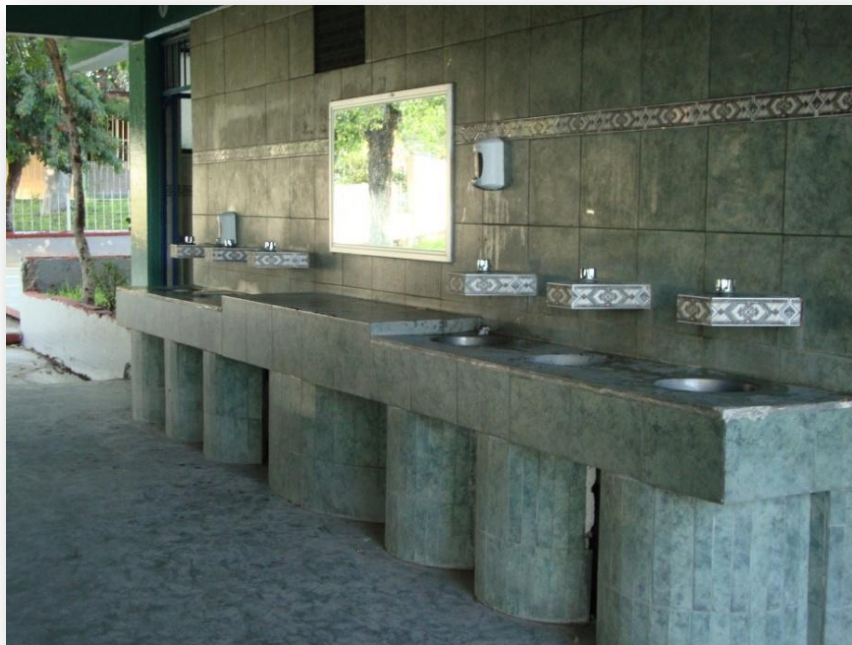
Fotografía 7. Baños de la Secundaria Mariano Escobedo.