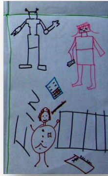
Figura 1. Fragmento de la historieta uno, Secundaria José Agustín.