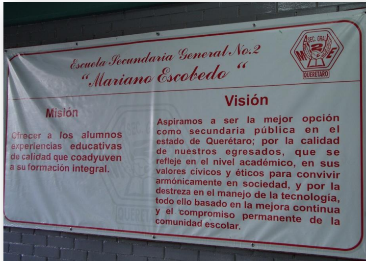
Fotografía 8. Misión y visión de la Secundaria Mariano Escobedo.