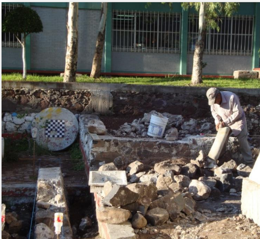
Fotografía 5. Mejoramiento de las instalaciones de la Secundaria Mariano Escobedo.

incluye una fotografía tomada al momento de la visita a la escuela, que muestra el continuo mejoramiento de las instalaciones escolares.