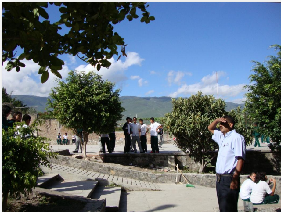
Fotografía 2. Secundaria José Agustín

Sin embargo, los matices se tornan más favorables en la capital, Chilpancingo de los Bravo, donde se encuentra ubicada esta escuela. Esta secundaria tiene un “índice de marginalidad bajo” (ENLACE, 2013), brinda un servicio matutino y vespertino y está situada en un terreno con pendiente (como se muestra en las fotografías 1 y 2).