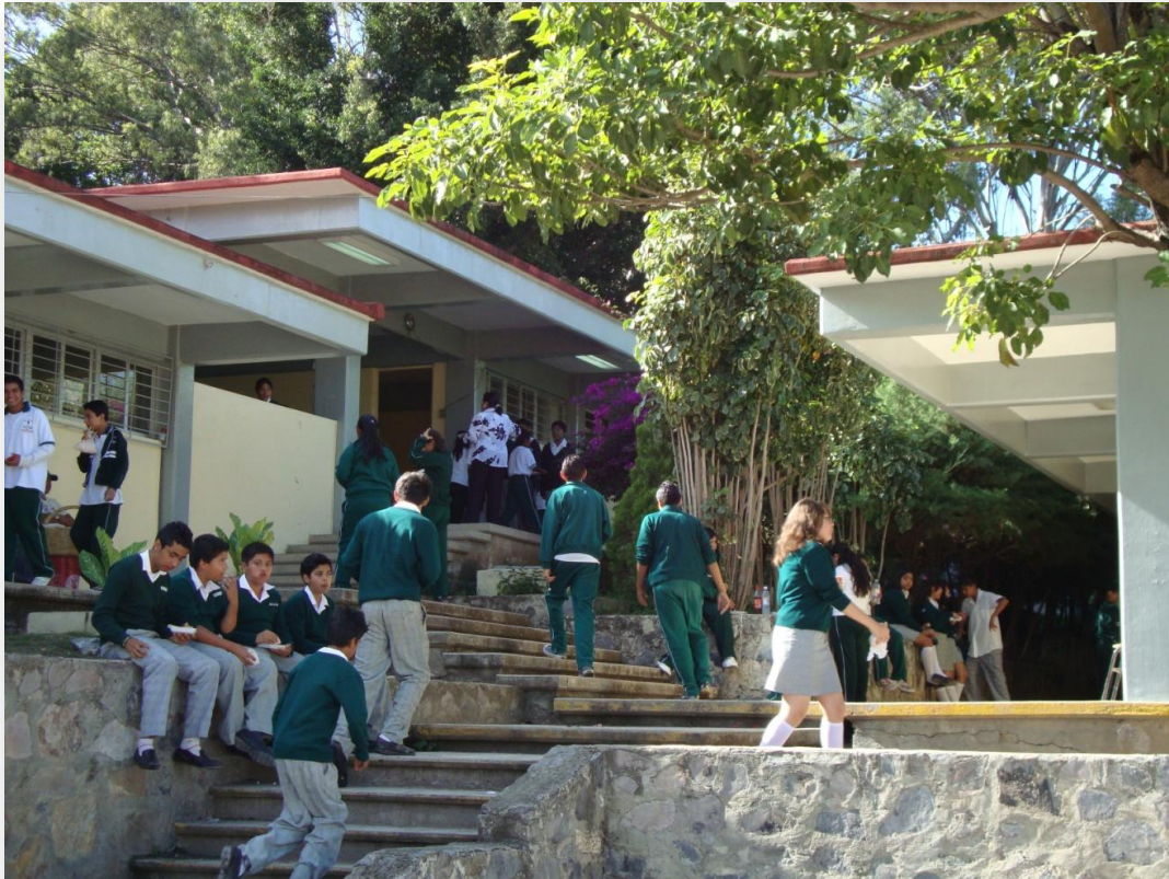
Fotografía 1. Secundaria José Agustín

La Escuela Secundaria José Agustín Ramírez está ubicada en el estado de Guerrero 26 , uno de los estados más pobres de la república mexicana. De acuerdo con el Consejo Nacional de Evaluación de la Política de Desarrollo Social (CONEVAL), Guerrero presenta condiciones socioeconómicas de muy alta marginalidad. Con respecto de las 32 entidades federativas, ocupa el segundo lugar en porcentaje de población en pobreza y pobreza extrema (CONEVAL, 2012).