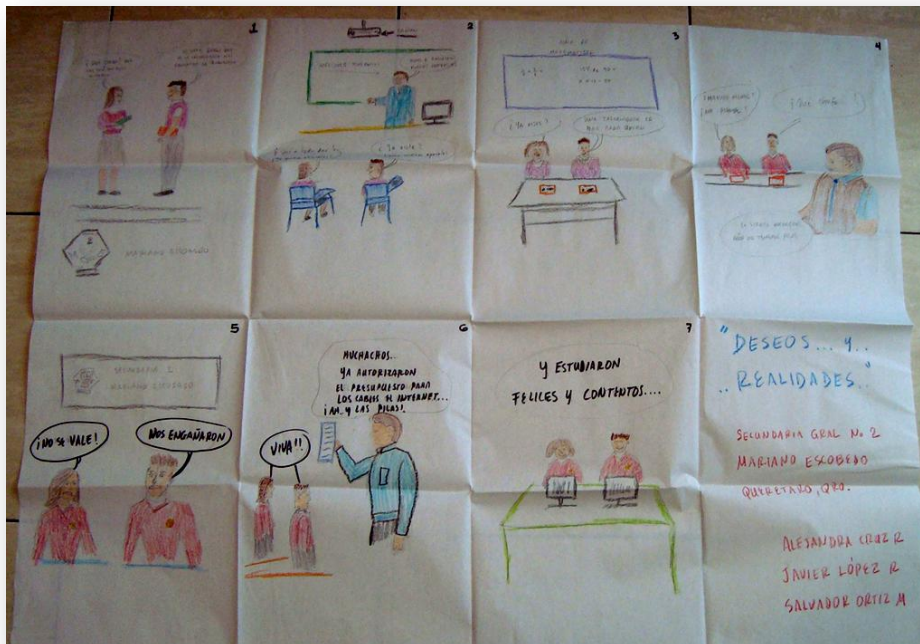
Figura 4. Historieta tres de la Secundaria Mariano Escobedo

Las tecnologías encierran muchas promesas y expectativas, movilizan entusiasmo; pero el riesgo es que se apaguen, no funcionen o no haya presupuesto para sostenerlas. En la historieta, los profesores eligen terminar la historia con un “final feliz”, consiguiendo el dinero para hacerlas marchar, pero puede percibirse cierta angustia en relación a lo frágil o delicado del equilibrio que las hace funcionar.