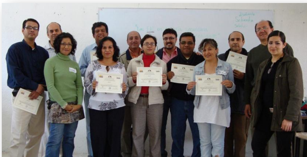
Fotografía 10. Profesores participantes de la Secundaria Mariano Escobedo

En la Secundaria Mariano Escobedo los profesores participantes fueron doce. El lugar de la reunión fue una sala y los participantes estuvieron sentados en círculo. La conversación grupal duró aproximadamente dos horas dividida en tres partes: