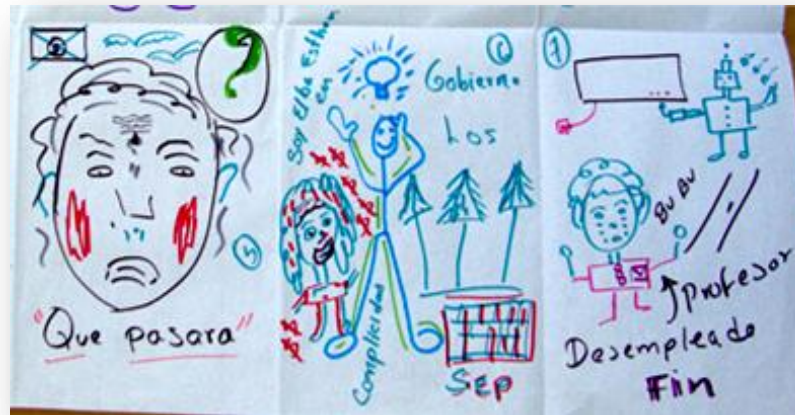
Figura 2. Fragmento de historieta, Secundaria José Agustín.