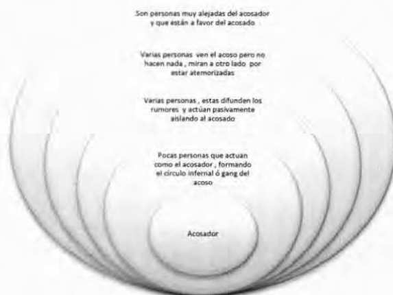
Figura 2. Esquema de los gangs del mobbing (Del Pino, 2007:103).

El gran acosador y su equipo forman parte de “una especie de “círculo infernal” con el que establecen un escenario conspiracional para perpetrar el exterminio laboral de su víctima, por lo cual los victimarios se localizan junto con el instigador en los tres primeros círculos de acción del mismo con la finalidad de conseguir su objetivo. Son los colaboradores tácitos y los cómplices o testigos mudos, mientras que al final se ubican los testigos no mudos, quienes están en contra de esta violencia laboral psicológica, son quienes no lograron ser seducidos o corrompidos por el gran acosador para tal efecto” (Del Pino, 2007:103).