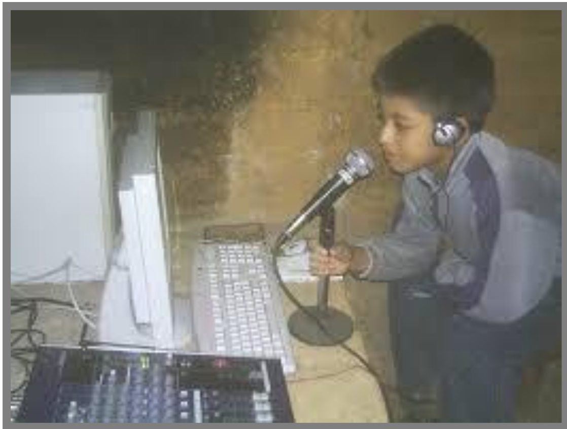
El niño narrador