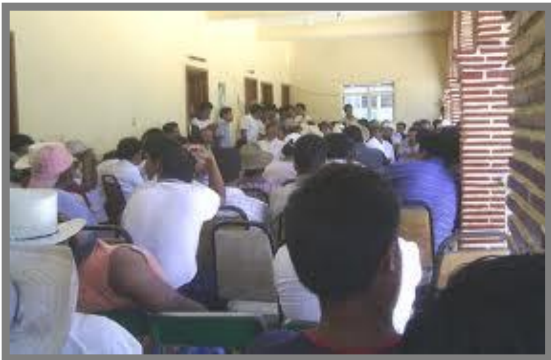
La asamblea comunitaria