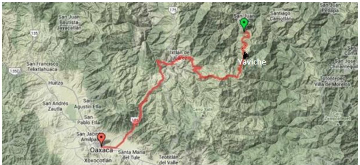
La ruta Ciudad de Oaxaca- Santa María Yaviche