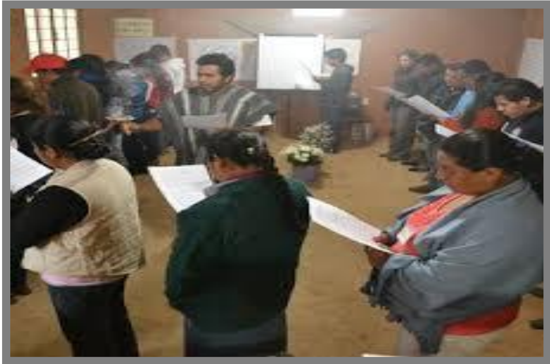
En sesión con la comunidad