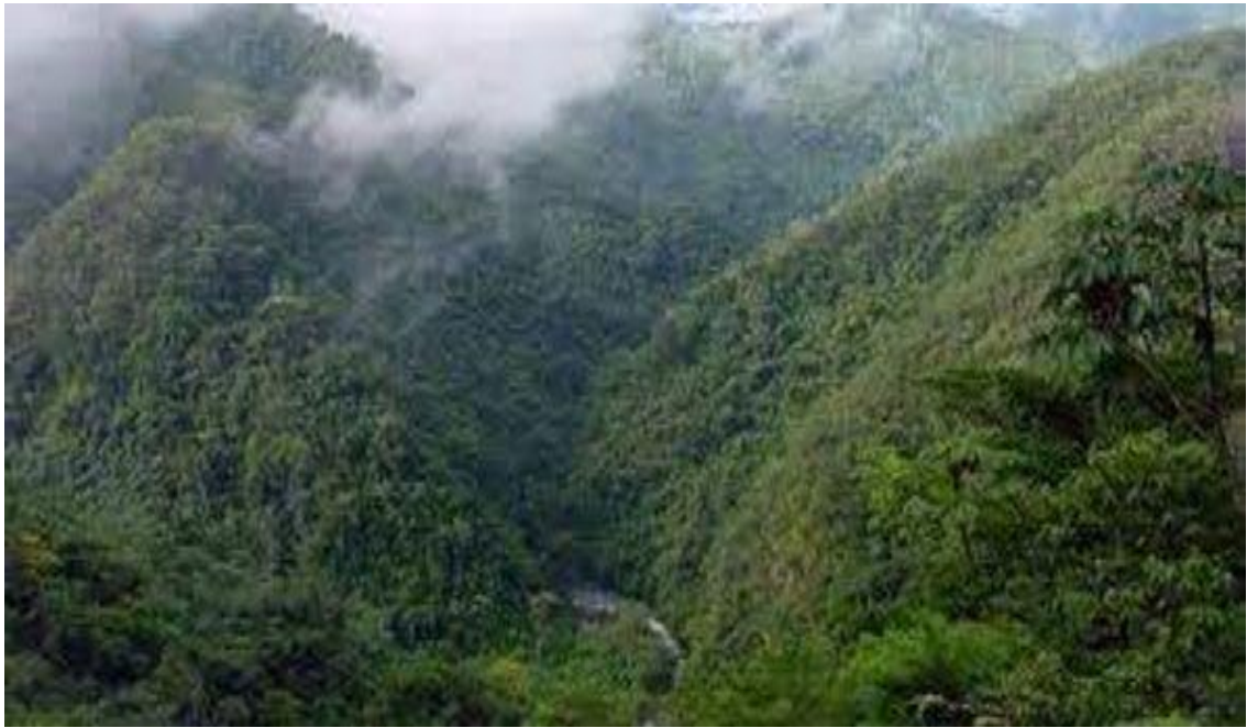
Los recursos forestales