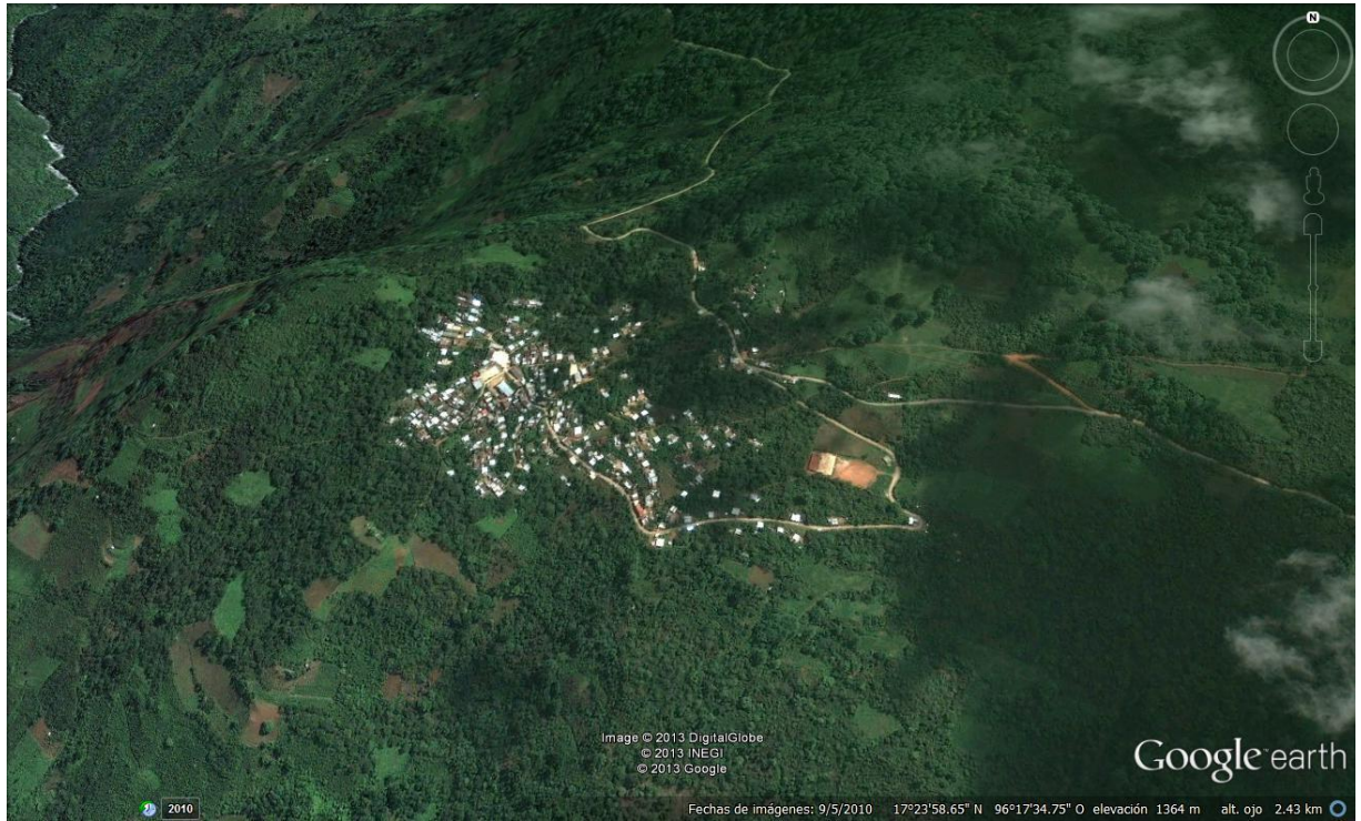
Mapa en relieve