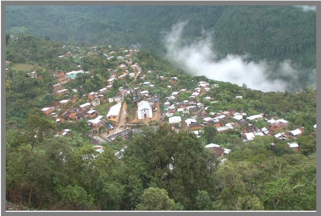
Santa María Yaviche