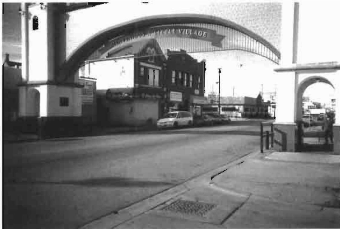
Calle 26 en La Villita (Chicago, Illinois)

los cuales han de señalarse los puntos mágicos o religiosos que comunican los dominios de lo sagrado y lo profano. Por nuestra parte hemos venido diciendo que la migración, al evocar algunos rasgos del peregrinaje religioso (como el carácter sacrificial y mesiánico), también llevan consigo una serie de emblemas y prácticas sociales que les permiten presentificar su tierra natal. Con ellos intentarán llevar a cabo una operación simbólica de fundación del nuevo mundo, pero a diferencia del peregrinaje religioso sus símbolos suelen ser profundamente profanos, los cuales, sin embargo, no dejan de ser sagrados. Los migrantes, al igual que los peregrinos convocados por Dios, también necesitan crear imaginariamente un espacio vital donde se mantenga de algún modo su propia identidad. Cuando llegan a Estados Unidos, al menos los primeros emigrantes, llevan a cabo un proceso fundacional que les permite organizar una suerte de cerco significativo para enfrentarse a la tierra extraña que los ve con recelo y desconfianza.