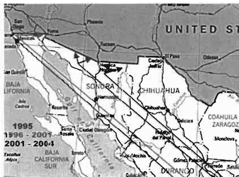
Cambio en las rutas del cruce fronterizo

En la zona de Sonoyta se encuentran los pasos conocidos como la Garita , la Nariz , las Flores y el Durazno , por estos lugares los migrantes caminan de uno a tres días hasta Ajo y Selles buscando llegar a Tucson Arizona. El cruce en el corredor Naco-Agua Prieta implica sortear los peligros del Desierto Alto, la vigilancia de la Border Patrol y las balas de los cazamigrantes del rancho Roger Barnett. Además de tener que caminar hasta tres días, en el área de Naco son frecuentes los asaltos 173 .