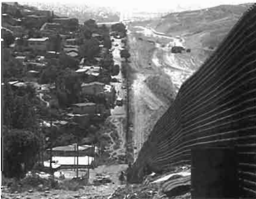
La "Barda" en Tijuana, Baja California

Confiamos en seguir adelante con este intento de comprensión del fenómeno migratorio más allá de la lectura de su componente económico funcional, pero por el momento consideramos pertinente tomarnos unos momentos para seguir pensando.