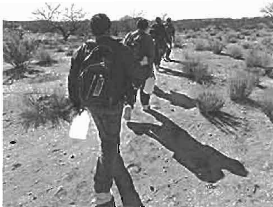
Caminando en el Desierto de Altar, Sonora

Detrás de los números están las personas con sus sentimientos, emociones y pensamientos. Su comprensión no se agota considerando únicamente lo económico. Más aún, al dinero, al éxito o al fracaso en la aventura migratoria se le imponen una serie de sentidos que nos remiten a un sistema de referencias simbólicas que van más allá de lo material. Así, el sentido de la construcción de la casa, la troca , el terreno o los animales pagados con migradólares trasciende la inmediatez de su representación dineraria y nos envía a un orden de sentido tejido con los hilos de la esperanza, la utopía, la nostalgia, la pérdida, el sacrificio y la muerte.