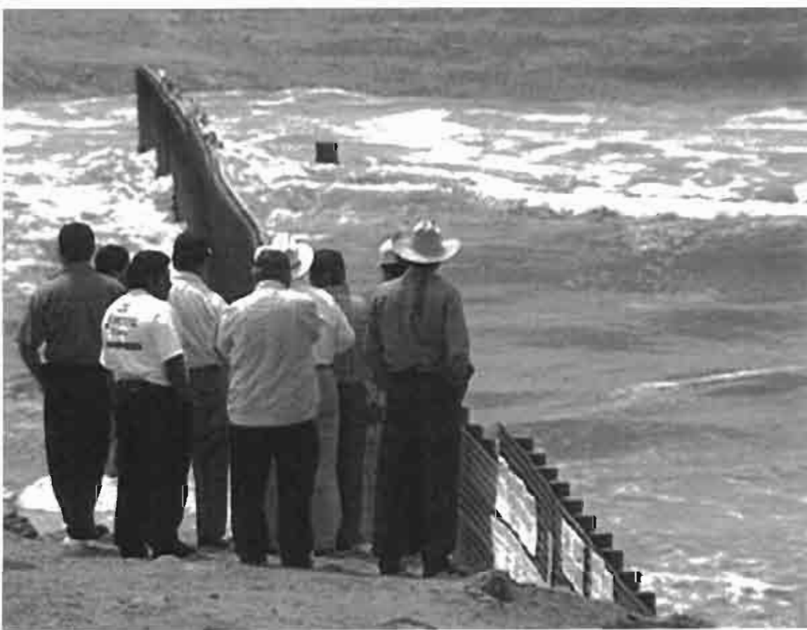
Frontera en Tijuana

Emigrar a los Estados Unidos no representa para los trabajadores únicamente el recurso desesperado para tener trabajo, es también una forma de interpretar el mundo, de construir el mundo. Es también dispositivo pedagógico que prepara a los hijos para ingresar al circuito migratorio. Representa igualmente el andamiaje simbólico e imaginario desde el cual se busca asignarle sentido a lo ominoso del cruce fronterizo.