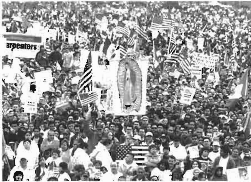
Mega marcha de migrantes en Chicago el 1º de mayo

El 1 de mayo la celebración del día del trabajo sirvió de marco a la realización de una mega marcha a la que se llamó “Un día sin inmigrantes” acompañada de un boicot contra los productos de compañías como Kimberly Clark y Coca Cola.