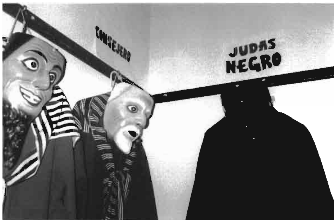
Vestimentas usadas en la representación de la Judea en Purísima de Bustos, Guanajuato