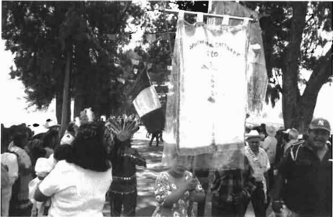
Fiesta de la Santa Cruz en Victoria de Cortazar, Guanajuato

mientras los trabajadores que han vuelto de Estados Unidos se reúnen en la cantina, algunos han estado ahí desde que llegaron al pueblo.