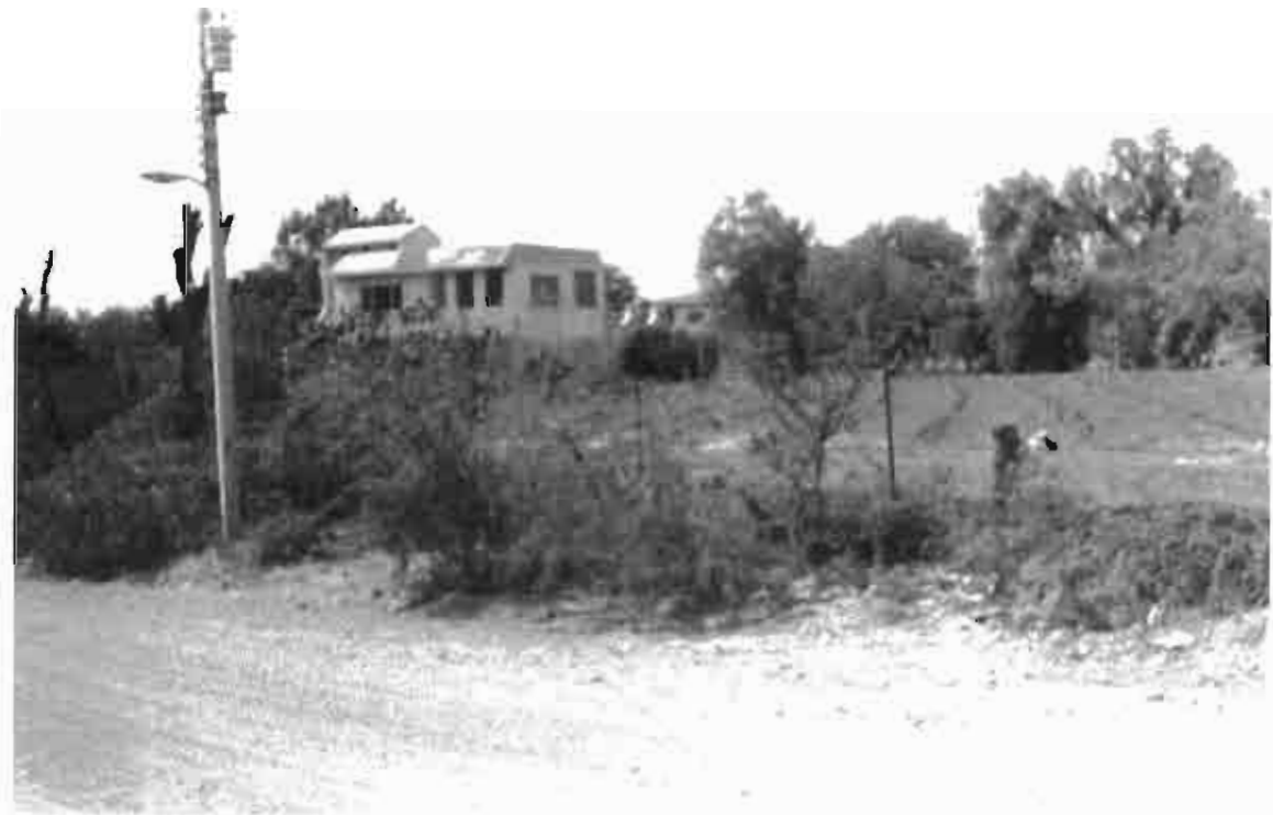
Con los dólares se levantan “ monumentos ” en las comunidades (Duartes, Guanajuato)

“Levantar los cuartos” o “tender una barda” es además de procesos de construcción urbana o fuentes de trabajo para los albañiles locales, manifestación simbólica del sufrimiento, monumentos que dan testimonio de que allá los otros trabajan y son buenos.