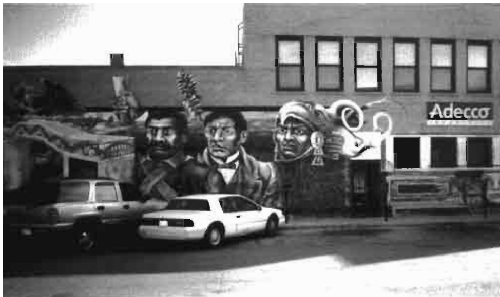
Emiliano Zapata, Benito Juárez y Cuahutemoc en el corazón de Chicago

cocina nacional. En las calles existen puestos de tamales, tacos, sopes y huaraches. En los nombres de los comercios se lee: “El Cocula”, “India Bonita”, “La Michoacana”, etcétera. En los muros de las calles, además de los grafittis suelen verse pinturas murales donde se fusionan las imágenes de la Virgen de Guadalupe, el Cerro de la Villa y las figuras de Zapata o Francisco Villa, son testimonios de una memoria colectiva que se niega a desaparecer.