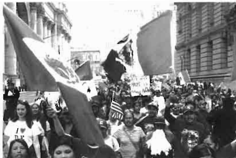
Migrantes mexicanos en New York, 1º de mayo de 2006

Ese día los migrantes hicieron sentir su presencia, abandonaron sus labores en el campo, la cocina, la fábrica, la construcción y demás para sumarse a la protesta. Se calcula que han participado ¡2 millones! de personas en las manifestaciones y las movilizaciones han abarcado, de marzo a mayo de 2006, más de 60 ciudades de Estados Unidos.