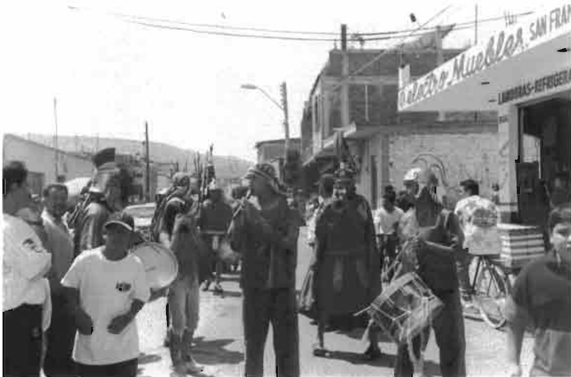
Fiesta de la Judea en Purísima de Bustos, Guanajuato