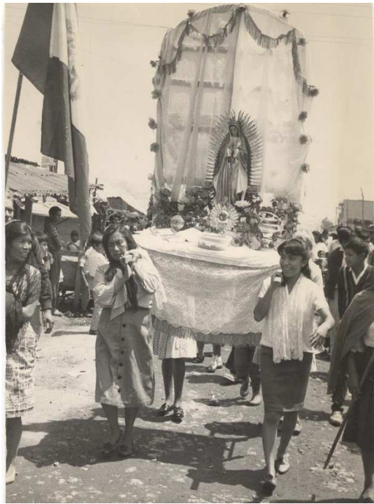
Ilustración 1. Virgen de Guadalupe y Mujeres